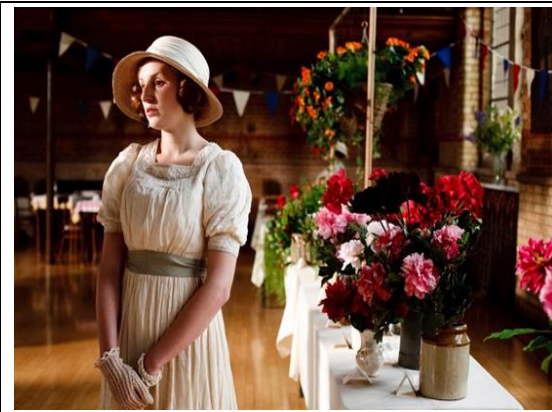
شكل (٤) (شخصية إيديث بيلهام)

https://planterraevents.com/blog/downton-abbey-fashion-floral-inspiration