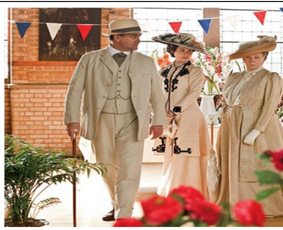
شكل (١) (الأسرة الحاكمة في معرض الزهور )