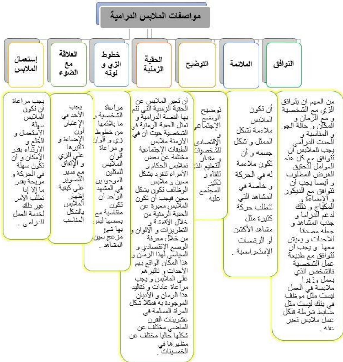
مخطط يوضح مواصفات الملابس الدرامية

و أول ملابس درامية تم إرتداؤها كانت لشارلي شابلن و هي بدله مع عصا و حذاء كبير و أول تصميم ملابس درامية صحيح كان في فيلم أسرار نيويورك و كان تايبير قطيفة أسود اللون مع بيرية و بلوزة بيضاء و انتشرت هذه الموضة بعد الفيلم.(مها عبد الرحمن، ٢٠٠٣)