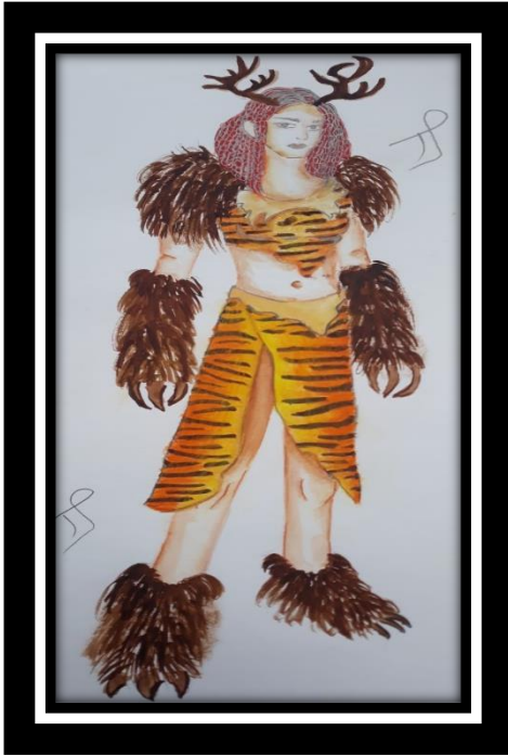
تصميم رقم (٣)