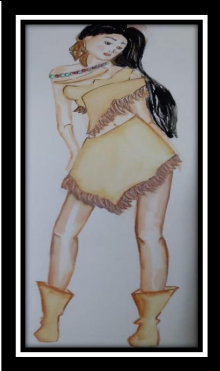
تصميم رقم (٤)

ترتدي تنورة و بلوزة من جلد الحيوانات للدلالة علي الحقبة الزمنية و أناقة الملابس للدلالة علي الوضع الإجتماعي. خطوط التصميم منحنية لإظهار رقة الشخصية و ضعفها . ترتدي حلق من ورق الشجر للدلالة علي الحقبة الزمنية و النوثة و الرقة . ترتدي عقد من أسنان الحيوانات و الأحجار الطبيعية للدلالة علي الزمن و المكانة الإجتماعية . الشعر الأسود المنسدل يدل علي عدم خروجها للصيد و تعرضها للمخاطر الموجودة في الحقبة الزمنية و بالتالي يدل علي قلة حيلتها و ضعفها و إعتماها علي الآخرين . إستخدام اللون الباهت للدلالة علي الخجل و عدم حب الظهور .