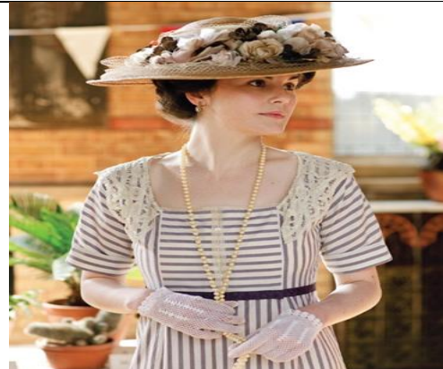
شكل (٣) (شخصية ماري جوزفين)