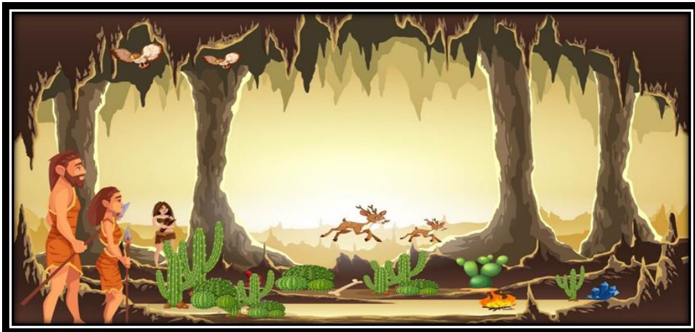
تصميم للديكور المتوقع وجوده في العصر الحجري من تصميم الباحثة