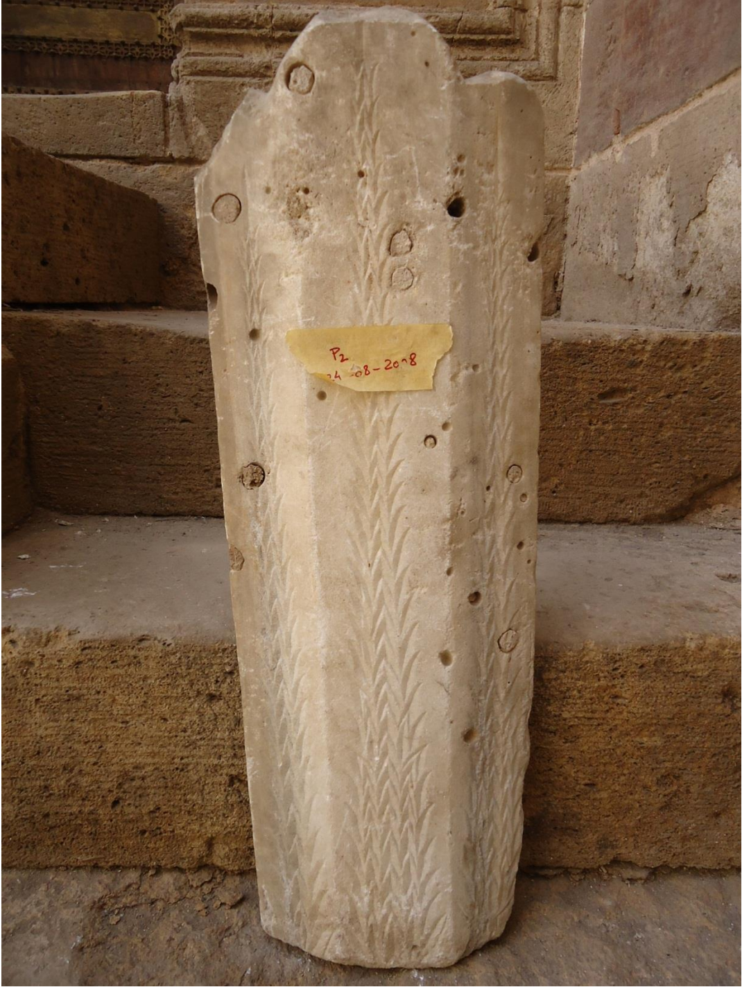
لوحة (٢) خلفية الشاهد وبها اشكال سنابل القمح