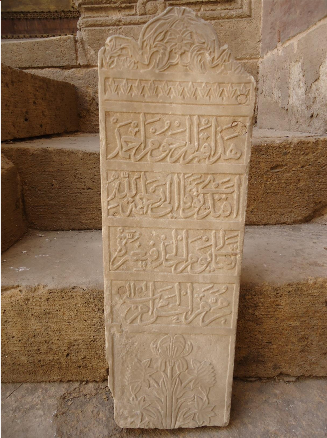
لوحة (١) واجهة شاهد قبر مؤرخ بسنة ١١٥١ هـ شكل توضيحي للنصوص الكتابية والزخارف