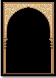
الشكل النهائي، (٩)