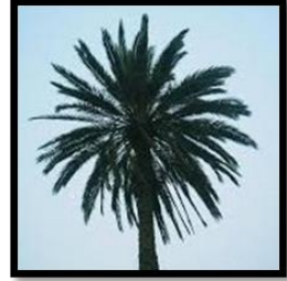
تحوير شكل النخلة، الصورة (٦).