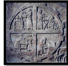
قصر اشور، ناعور، الصورة (٣) شباك الصيد، الصورة (٤) الماندالا الصورة (٥)

إذ تظل النقطة المركزية بعيدة المنال ( الماندالا mandala ) وهي مركز الدائرة والتي تحتاج الى التواصل الروحي والفكري معها. كذلك استلهم الفنان المسلم عناصر زخرفته من الدائرة، ووظفها في بنائه من التنظيم الهندسي الدائري، وعنصر الخط وهو محدد الشكل الخارجي للنخلة مكونا شكل نصف دائري استفاد منها الفنان في أشكال زخرفته وإدراك التفاصيل الدقيقة في كل الأجزاء، و هنا يدخل عامل الخيال و علاقته بالمحمولات، أي ما يحمله عقله من معتقدات دينية واجتماعية. فتكونت منها الأشكال المعمارية الهندسية، ومن خلال التكرار وكما هو واضح في بناء (قصر غرناطة). كذلك كانت النخلة بشكل عام هي الشجرة المقدسة في بلاد الرافدين، التي تُعد أيضاً في الحضارة الاشورية الشجرة الكونية المحملة بالتمر.