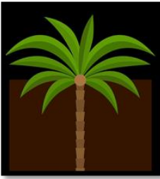
تحوير (١)، الصورة (٧).

وليس من الشجر شجرة تلقح غيرها، وليس من الشجر شجرة أكرم على الله من شجرة ولدت تحتها مريم بنت عمران)، فلقد جاءتنا كمية من الزخارف والتصاميم التي تناولت الشكل الخارجي لها وبتجريد واضح مع الحفاظ على رُوح النخلة وأجزائها لكن بتصميم معماري وبشكل جديد من خلال التحوير، والإضافة أو الحذف بغية تحقيق الهدف من التحوير، حيث قام الفنان المسلم بتحوير شكل النخلة أو جزءا منها لتتلاءم مع هدفه من توظيفها. (٢١) الصور (٦)، (٧)، (٨)، (٩). لقد كان تأثير النخلة على إدراك الفنان في زخرفته واضحا، حيث يختلف الباحثون حول دلالات الرسومات الزخرفية. فقد ربطها بعضهم بدلالات رمزية عقائدية في حين يؤكد الحرفيون إنها تحمل دلالات جمالية فقط. وإن للشكل الهندسي الدائري صفات ومميزات ودلالات رُوحية عميقة، تختلف عن جميع الأشكال الهندسية الأخرى؛ لكونه يمثل المحل الهندسي لجميع النقاط التي تبعد بعدا ثابتا عن نقطة معينة. فجميع الأشكال الهندسية محيطها الدائرة، والتي تدعى بمركز الدائرة وهي كفيلة بأن تجعل منها شكلا مميزا قابلا للاستمرارية ومبتعدة عن الأشكال الحدية. فالدائرة ترمز للشكل الروحاني الكوني في الحياة ومنذ البدايات الأولى للخليفة، فالإنسان كله يتكثف من خلال النطفة والبويضة المدورة ليعطي الجنين في داخل الرحم المدور، والرحلة الروحية التي على الإنسان خوضها في الحياة. والدائرة لها ميزات الحركة اللامتناهية، كالحياة والموت فهي حركة الدوالب الذي جعل كل شيء