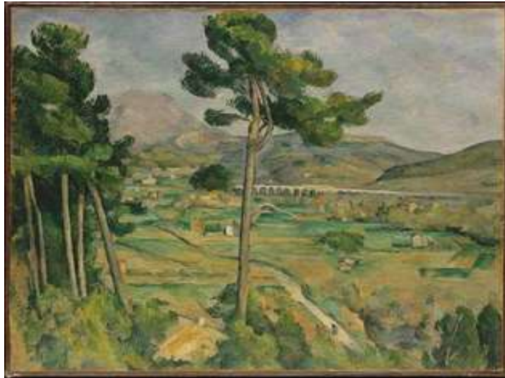
شكل رقم (٣) لوحة جبل سانت فيكتور ، للفنان سيزان ، ١٨٨٢-١٨٨٥ ، المتحف المتروبوليتان للفنون ، لندن.