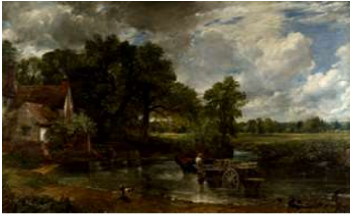
شكل رقم (٢) لوحة عربة التبن ، للفنان الإنجليزي جون كونستابل ، ١٨٢١ ، المتحف الوطني لندن