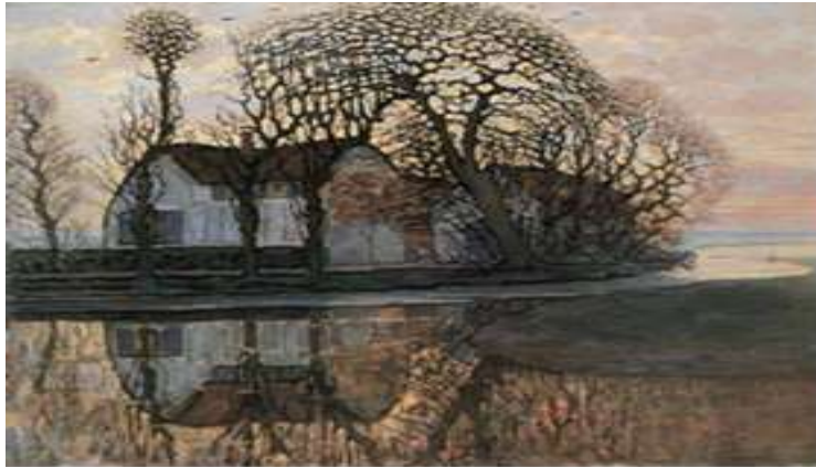
شكل (٦) مزرعة بالقرب من ديوفندرتش ، للفنان بيت موندريان، زيت على توال، ٨٦ * ١٠٧ سم ، ١٩١٦م .