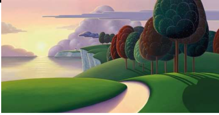
شكل (١٠٠) منظر طبيعي ، الفنان paul cornfield ، زيت على توال.

ويحدث في السنة أربعة فصول : وهي بالترتيب الشتاء ثم الربيع ، ثم الصيف ، ثم الخريف ، وكل فصل تحدث فيه تغيرات وخصائص مختلفة كما يأتي . " الربيع : في فصل الربيع تبدأ جذور البذور بالنمو، ويصبح الطقس أكثر دفئاً ورطوبة، وتذوب الثلوج ، ويزداد نزول الأمطار، ويمكن أن يؤدي ذلك إلى حدوث الفيضانات على طول المجاري المائية. الصيف : في فصل الصيف ترتفع درجة الحرارة ، حيث يكون أعلى درجة حرارة في فصل الصيف ، وفي حال ارتفاعها بشكل كبير فإن موجات الحر والجفاف قد تسبب مشاكل لدى البشر والنباتات . الشتاء : يكون فصل الشتاء بارداً، ويمكن أن تتساقط خلاله الثلوج في بعض المناطق" ١١ .