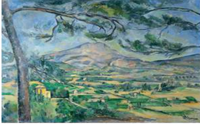
شكل رقم (١) لوحة (مجرى ماء عند جبل سان فيكتور) للفنان بول سيزان ، ١٨٨٥-١٨٩٥ ، متحف بوشكين بموسكو .