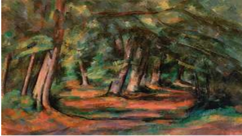
شكل (٥) لوحة أشجار متشابكة ، للفنان بول سيزان ، ١٨٩٢ م