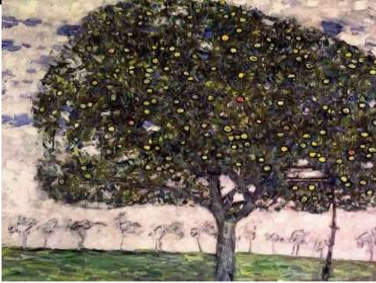
شكل (٤) شجرة التفاح ، جوستاف كليمت، زيت على قماش ، ٨٠*٨٠ سم ، ١٩١٦م