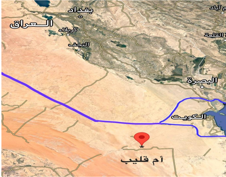
(1) خريطة تبين موقع أم قليب بالنسبة للحدود العراقية (قول ماب)