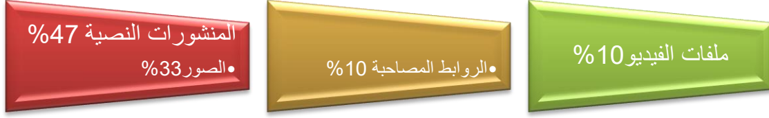
شكل رقم (1)