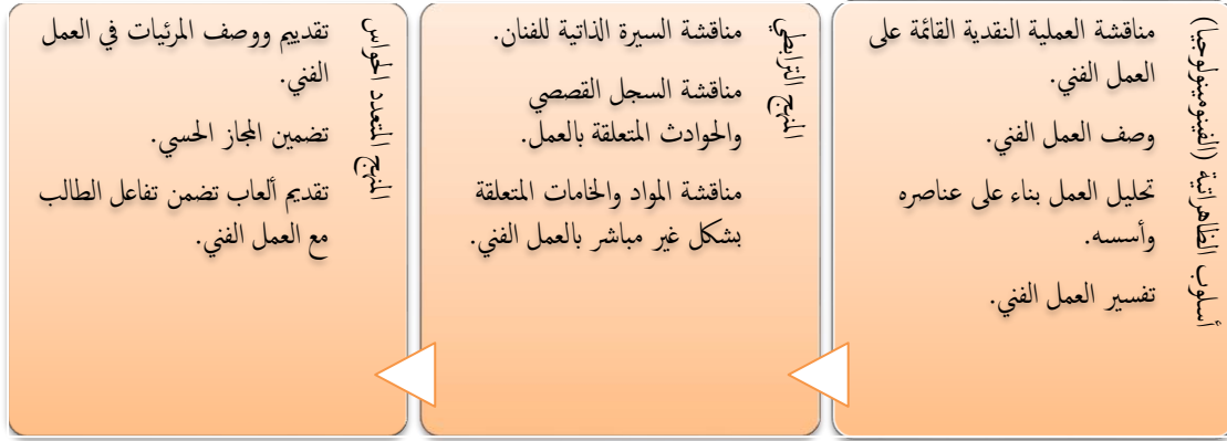
شكل رقم (٣): يوضح خطوات النقد الفني في نموذج هوروتيز (١٩٧٧)

ج- تفاعل الطالب مع العمل الفني من خلال تقديم الألعاب (Walsh, D. M. H,1992).