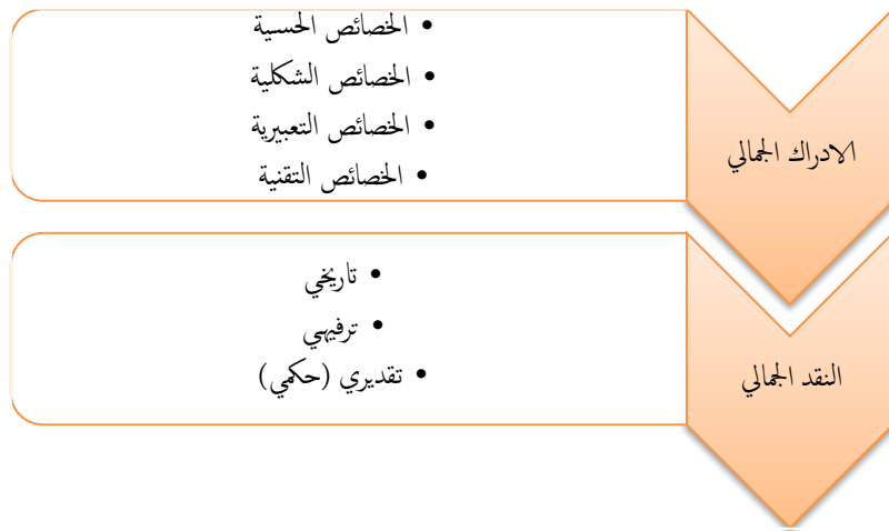
شكل رقم (٢): يوضح خطوات النقد الفني في نموذج براودي (١٩٧٢)

ج- تقديري (حكيم): تقدير قيمة العمل الفني بالنسبة للأعمال الأخرى التي هي من نفس النمط والمحتوى (Hamblen & Galanes, 1991, p.80).