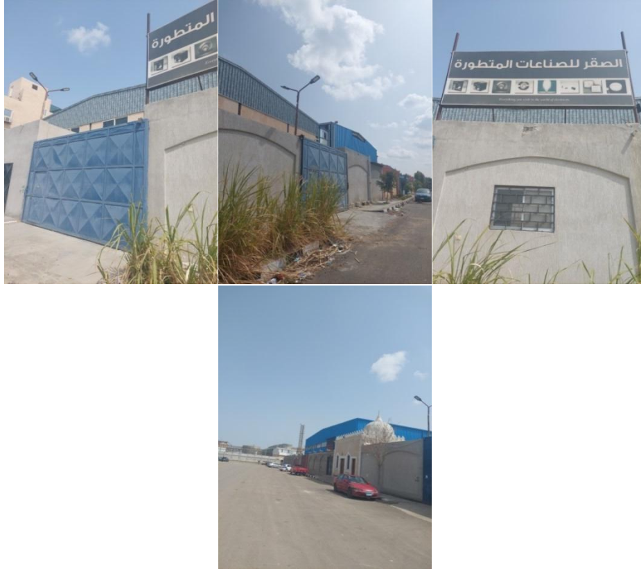
الصور (١-٤) توضح الشكل الخارجي للمصنع

كما ذكر المشرف على خطوط الإنتاج (أ.س) " احنا بينا علاقات كويسة واصحاب وينخرج مع بعض ودايمًا بنعمل حفلات وفي رمضان نعمل يوم نفطر كلنا مع بعض، ولو حد عنده مشكلة بيقولى وبيحبوا الحاج جداً". كما لاحظت الباحثة أن المدير الإداري أو المشرف في حالة توجيه تعليمات للعاملين، يتم توجيهها مباشرة وجهًا لوجه، وأيضًا في حاله الجزاء أو اللوم، فإن ذلك يتم توجيهه بصورة مباشرة.