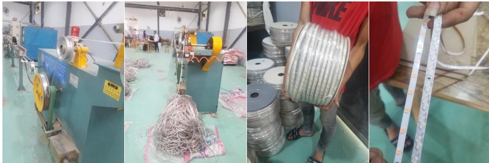
صور (٥-٨) توضح ماكينة تصنيع سلك الليد الكهربائى