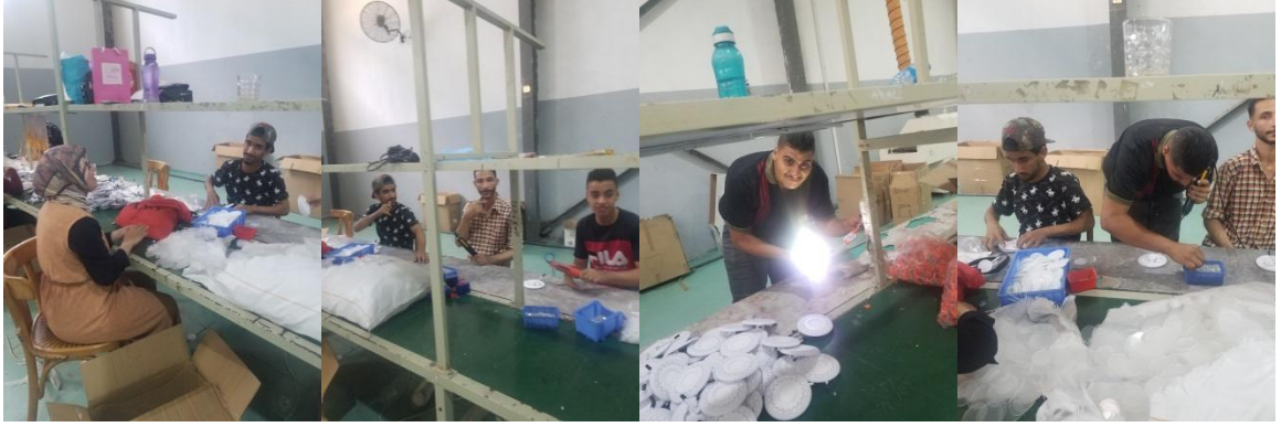
صور (١٤ - ١٨) توضح تركيب المعاقين سمعياً للكشاف الليد الكهربائي

وهناك جزء من العمال المعاقين سمعياً والذين يختصون بأعمال التجميع اليدوية للكشاف الكهربائي واللمبات الليد الكهربائية والتعبئة وقد ذكر (ع.ص): "الخرص أشطر من السلام في الشغل وأسرع بكثير عشان بيكلموش وعندهم ضمير" ومن ثم فتقسيم العمل يعتمد على الوقت والحركة والقدرة على الإنجاز، كما اتضح وجود نظام دقيق من الرقابة والإشراف على جميع العاملين لضمان الجدية والالتزام والجودة في الأداء. أنظر الصور (١٤ - ١٨).