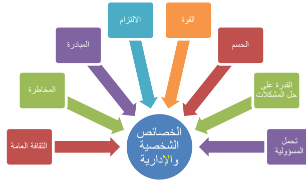
شكل رقم (١) يوضح الخصائص الشخصية والإدارية التي تميز المدير الإداري

مضحكش لو ضحكت بابي يا قلبى، وكنت كده وأنا مدرس فى المدرسة لو ضحكت فى الطابور المدرسين حتبوظ الدنيا، المصريين فراعنة تضحك مع السلامة محدش يحترمك أنا كنت الصبح أجيب الزائرة الصحية تفتش على اللبس والظواهر والشعر يجى أبوه يلاقيه حالق زيرو" ويقصد من الضحك التسبب والاستهتار فهو شخصية ملتزمة وحاسمة بدرجة كبيرة وتتسم بالشدة والقوة - رغم ملاحظة الباحثة خفة ظلة في ثنايا حديثه من حين لآخر - وذلك كان بهدف تحقيق الالتزام وشعورهم بالهبة نحوه ومن ثم يكون هناك تحقيق لمبدأ الالتزام فى العمل. يضاف إلى ذلك المبادأة والمبادرة والمخاطرة، فهو صاحب فكرة تشغيل الصم فى المصنع والتي كان الجميع يعارضها. كما أنه يتسم بالخبرة فى مجال عمله، وفي التعامل مع العاملين على اختلاف ثقافتهم، فضلاً عن حبه للعمل الاجتماعي والسياسي والثقافة العامة التي اتضحت في ثنايا حديثه، حيث تطرق للحديث عن أحوال المجتمع، وغلاء الأسعار والدولار، ومشكلات الاستيراد والتصدير، كما يتسم بقدرته على تكوين علاقاته الاجتماعية التي اتضحت من حديثه عن مقابلته لبعض النواب في مجلس الشعب وغيرهم. ويمكن تقسيم هذه الخصائص كما أشار هنري فايول في نظريته حول التكوين الإداري إلى سمات شخصية وأخرى مهنية أو إدارية، والتي يمكن توضيحها في الشكل رقم (١).