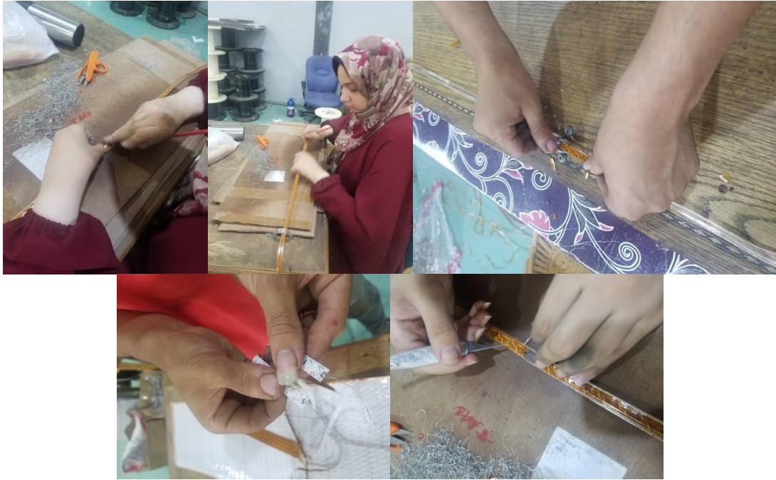
صور (٨ - ١٣) توضح مرحلة التدكيك واللضم اليدوية

مكنة استخداماتها كثير بعد مرحلة التبريد يدخل على مرحلة اللف بنجمع البكرة وفي مكنة لف ومتوصلة بلمبة عشان لو في قفلة في الخرطوم الاضاءة بتعلى متضربش، في الحالة دة أتابع المشكلة وأشوف سببها ايه لكن اللمبة لو مش موجودة مش عارفة القفلة جاية منين". وذكر كذلك: "أنا اتعلمت هنا حاجات كثير أوى ومواعيد العمل من ٨ الى ٤ بروج وباجى بالباص اللي الحاج جايبه لنا كلنا" ويتضح مما سبق أن العمل لا يحتاج إلى مهارة كبيرة أو تخصص دقيق ولكن يكون تقسيم العمل حسب المهارة والسرعة في أداء العمل.