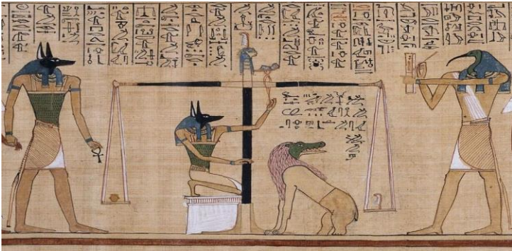
شكل رقم (٥) بردية من كتاب الموتى "بردية حونفر" (١٢٧٥ قبل الميلاد) تبين عملية وزن قلب "حونفر"، المتحف البريطاني (١).

ومن الواضح أن الحياة الهادئة والخالية من الاحقاد والثأر التي نشأ عليها المصري القديم قد أثرت بشكل كبير وواضح على فنونه، فالديانة المصرية خالية من الطقوس المروعة والانتقام ولا سيما "قانون ماعت" * دليل على العدالة الحقيقية وتوازن الحياة المصرية القديمة وتعايش جميع عناصره في انسجام، فهو من أروع ما ميز الحضارة المصرية القديمة فقيامها على أسس "ماعت" كان تجسيداً يعبر عن جوهر الحق والصدق والعدل والنظام، واعتبر القانون الإلهي الكوني الذي يرسى قواعد الخير والحق في مواجهة قوى الشر والظلم كما نص عليه كتاب الموتى الشكل رقم (٥).