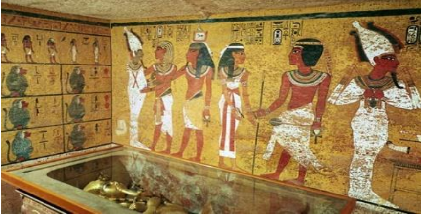
شكل رقم (٢) رسم جداري من مقبرة الملك توت عنخ آمون، وادي الملوك - الأقصر.