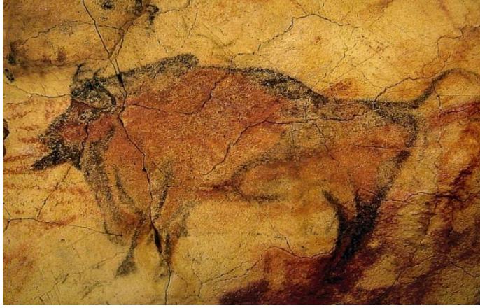
شكل رقم (١) رسم جداري من الفن البدائي، كهوف التاميرا، إسبانيا (١).

لقد كانت المعرفة التي عرضوها من خلال الخصائص التشريحية لتلك الحيوانات مذهلة، حيث كان لديهم المهارة اللازمة لنقل هذه الخصائص مستخدمين الحجارة السوداء والحمراء في التلوين الشكل رقم (١).