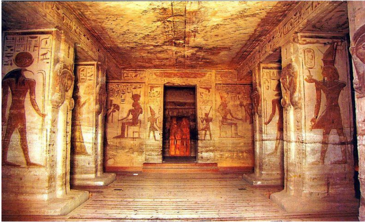
شكل رقم (٤) رسم جداري، معبد أبو سمبل، أسوان.

وضعت الرسوم الجدارية في المقابر لتعظيم فكرة الآلهة، كما تكون صورة بديلة لعالم الوجود، ووضعت على جدران القصور لتوثيق نشاطات الملوك الحياتية والدينية، فالفكر المصري اوجد نظاماً خاصاً لتوزيع مواضعه على فضاءات العمارة، ففي أبنية المعابد كانت الرسوم ذات الموضوعات الحياتية مثل حروب وانتصارات الملوك والصيد والعمل في الحقول وغيرها من الموضوعات الحياتية، وكانت تنفذ على جدران المقابر الخارجية في حين احتلت الموضوعات ذات الدلالات الدينية، مثل مشاهد التعبد أمام الآلهة والمواكب الجنائزية الاماكن العميقة الداخلية، وفي ذلك نوع من الوعي في مسرحة الحدث بين بنائته الحياتية والدينية ونوع من التميز في منظومة الفن، وبين واقعيته البصرية التي تعيد نسخ التجربة المعاشية والتأويل الرمزي المفعم بالتجديدات الصورية الشكل رقم (٤).