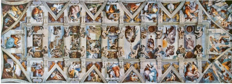
شكل رقم (٦) جدارية يوم القيامة - مايكل انجلو - كنيسة السيستين بروما (٢) .

على هذه التقنية منذ العصر الروماني والبيزنطي وفي عصر النهضة في إيطاليا وتعني رطب، وهو من طرق التصوير على (الجص). وطريقته أن يكسى الجدار بطبقة من الجص ثم يطلى فوقها بالألوان الأرضية المذابة في الماء على أن يوضع الطلاء قبل أن يتم جفاف هذه الألوان حتى يتشرب الجص باللون أثناء جفافه، وبذلك يتقادم تساقط الطلاء، أي قبل تفاعله الكيميائي وجفافه التام. ومن الفنانين الذين رسموا على الجص الرطب الفنان (مايكل أنجلو) عندما رسم جدارية (يوم القيامة - ١٥٠٨) الشكل رقم (٦) على سقف كنيسة السيستين بروما.