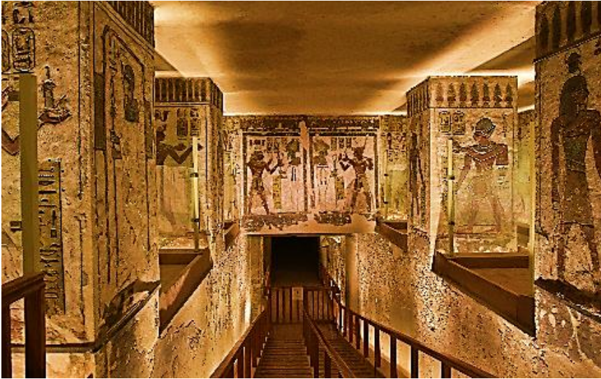
شكل رقم (٣) رسم جداري من مقبرة رمسيس الثالث - وادي الملوك - الأقصر.