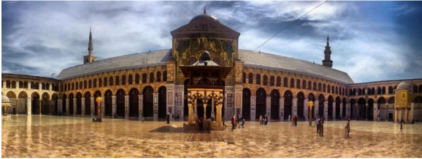
شكل رقم (١٠) جدارية من الفسيفساء، صحن المسجد الأموي، دمشق (١). ومسجد قبة الصخرة بالقدس (١١) المنطلقات الأولى للفن الإسلامي في العمارة الدينية.