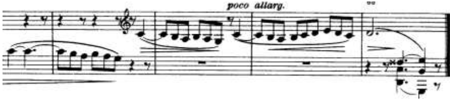
شكل (٤) يوضح الكودا