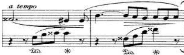
شكل (١) يوضح النموذج اللحني القائم عليه المقطوعة

تتكون هذه المقطوعة من جزء يتكرر من م ٧ : م ١٧ (١)، و يقوم المؤلف عقب كل تكرار بتغييرات طفيفة من الناحية اللحنية والهارمونية ، مع عرض النموذج اللحني الذي يقوم عليه بناء المقطوعة من م ٥ : م ٦