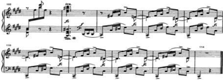
شكل (٨) يوضح الكودا