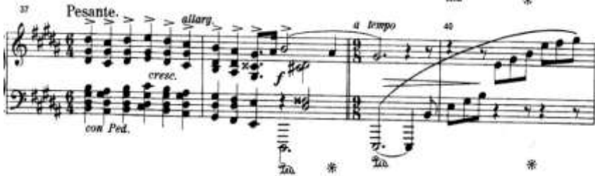
شكل (٣) يوضح تألفات عمودية ومفككة

من م ٤١ : ٥٤ : تكرار لأفكار اللحن الرئيسى بشكل غير منتظم مع النماء اللحنى والإتجاه الى سلم صول # ك .