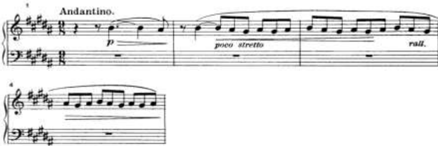
شكل (٢) يوضح مقدمة قائمة على التتابع السلمى

بدأ اللحن بمقدمة صغيرة من م ١ : م ٤ بظهور الدرجة الثالثة للسلم المستخدم وبتتابع سلمى فى حدود ثلاث درجات من الدرجة الثالثة (سى) الى درجة الأساس (صول#).