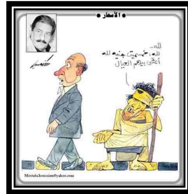
شكل(5) عمل للفنان مصطفى حسين

"حصل على بكالوريوس الفنون الجميلة عام 1959م، وبدأ عمله الصحفي عام 1952م، وحصل على جائزة على ومصطفى أمين عام 1985م وجوائز عالمية، وكان رئيساً للجمعية المصرية للكاريكاتير عام 1992م" (شوقية: 2005م: 217، 216)، "ومن أعماله الكاريكاتيرية نستطيع تتبع العادات الاجتماعية وقراءة التاريخ المصري" (عادل: 2009م: 135)، "وكان من رسامي دار الهلال والاثنين والدنيا والرسالة وفي آخر ساعة وجريدة المساء" (صلاح: 2009م: 16، 17)، نُشرت رسومه في العديد من الكتب والمجلات العربية والأجنبية، وتميزت رسومه بالسخرية إلى جانب النقد والسياسة، ومن رسومه الاجتماعية شكل(5).