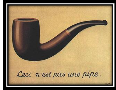
شكل(10) رينيه ماجريت-1929م (المرجع: هالة 2010م: ص 10)

(3) المفارقة الساخرة: هي سمة ما بعد حداثية وهي الاختلاف بين الأشياء وحقيقتها الفعلية بمعنى إخفاء الحقيقة الفعلية للشكل أو للمظهر الخارجي أو للكلمة والمصطلح أصله إغريقي ويعد وسيلة لمزج المعاصر بطرز أخرى تساعد على التوسع في المعنى "ماجريريت روز: 1994م: 139)، وتعتمد على التضادات الثنائية وعنصر الاكتشاف والفتنة لدى المتلقي للوصول إلى الفجوة بين ما يرى وما هو في الواقع الفعلي وبذلك يدرك المعنى المراد، ومن أشهر الصور المرئية للمفارقة اللفظية لوحة رينيه ماجريت وتسمى (هذا ليس بايب) (This is not a pipe) شكل(10)، تبدو ظاهرياً متعارضة لكنها حقيقية في أنها مجرد صورة لبايب فلا تصلح للاستخدام الفعلي وبذلك تحقق أساس من أساسيات الباروديا.