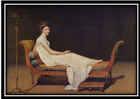
شكل(9) جاك لويس دافيد، مدام ريكامية-1880

(المرجع: https://images.app.goo.gl/rZGWaBZhEXbgTCqj6 )