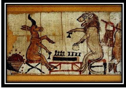
شكل(3) السخرية الكاريكاتيرية لمصر القديمة

فن عتيق تعود جذوره إلى القرن الثلاثين قبل الميلاد، حيث سجلت البرديات المصرية القديمة البدايات الأولى لهذا الفن، رسوماً ذات نزعة كاريكاتيرية واضحة من حيث الشكل والمضمون الساخر فعلى إحدى الشقفات يُرى رسماً لأسد يلعب حماراً الشطرنج ولسان حاله يقول كش حمار شكل(3).