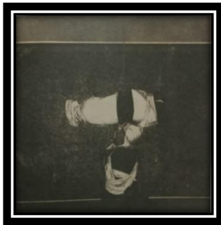
شكل (2) طباعة من سطح غائر، 50x1973، 50-1972 (المرجع معرض فن الجرافيك القومي الرابع 2016م، ص94)

"حصل على بكالوريوس الفنون الجميلة قسم الحفر عام 1967م، وحصل على الأستاذية في الرسم من أكاديمية سان فرناندو بمدريد- المعادلة لدرجة الدكتوراه المصرية- عام 1975م، مقرر لجنة الفنون التشكيلية بالمجلس الأعلى للثقافة منذ 2012م حتى الآن، شارك بالعديد من المعارض الخاصة والمحلية والدولية، حصل على 26 جائزة دولية" (معرض فن الجرافيك القومي الرابع 2016م، ص94) ، ومن أشهر أعماله شكل (2).