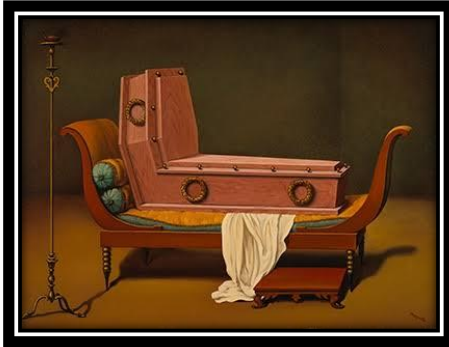
شكل(8) رينية ماجريت، منظور1 1950

(2)التغريب: مصطلح ظهر بواسطة فيكتور شيلوفسكي في عام 1917م وساد وجوده في مدارس الفن المعاصر ويعد من أهم الأساليب في تحقيق المحاكاة الساخرة "فهو إجبار المتلقي على رؤية الأشياء المألوفة في صورة غير مألوفة أو بطريقة غريبة من لتعزيز التحول في مفهوم المألوف" ( http://www.artchive.com )، وكلما كان العمل الفني أكثر غرابة وأشكاله الفنية بها عدم ألفة تحقق هدف الباروديا في تحقيق أكبر قدر من التأثير والاستجابة للمتلقي لذلك إطالة النظر للعمل يحقق رؤية أعمق وهو ما يعرف بالصدمة القديمة المتولدة من جديد، ورسم فنان السريالية رينيه ماجريت عمله المسمى منظور1 (Perspective 1) شكل(8) تناول فيه لوحة الفنان الكلاسيكي جاك لويس دافيد شكل(9) وهي مدام ريكاميه وفكرة التغريب البارودي فيه تتحقق حيث قام الفنان فيه بنقل العمل بأكمله عدا المرأة استبدالها بالتابوت تاركاً جزء من رداؤها إشارة إلى سابق وجودها مما يدل على أنه استبدل الحياة بالنقيض (الموت) أو التابوت وبذلك العمل تحققت الصدمة.