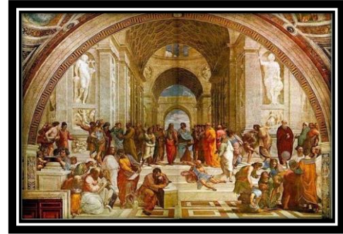
شكل(7) روفائيل مدرسة أثينا