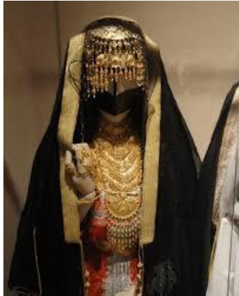
شكل (2) يوضح زي المرأة الاماراتية والتقليد الإسلامية