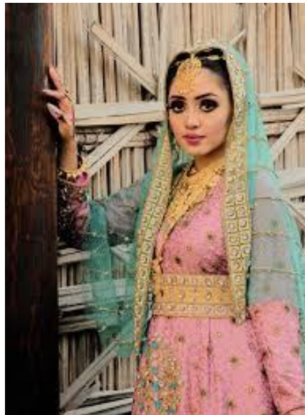
شكل (5) يوضح بساطة زي المرأة العمانية