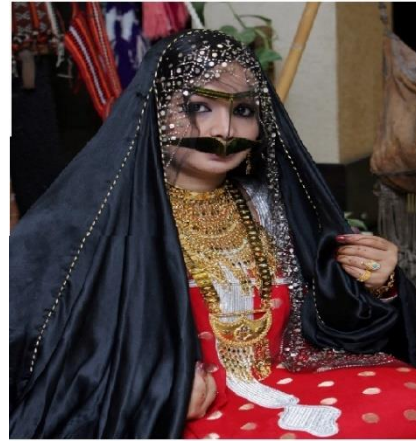
شكل (1) صورة توضح الزي الإماراتي للمرأة