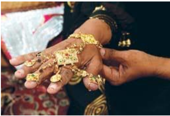
شكل(4) مكملات الزينة للمرأة