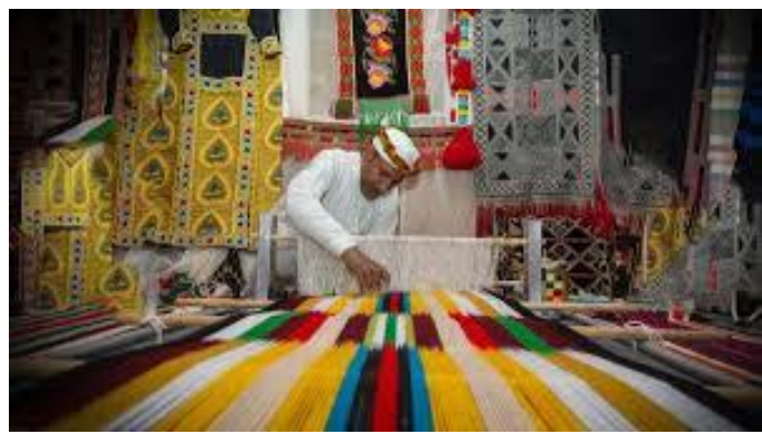
شكل (3) يوضح صناعة السدو والنسيج