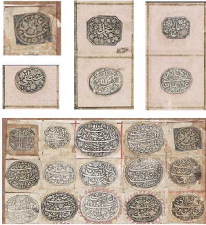
شكل رقم ( ٤ ) طوابع أختام شخصية ومؤسسية ، من العصر العثماني ، محفوظة في ألبوم ( مرقعة ) في مؤسسة بونهامز ( Bonhams ) للعاديات في لندن .

https://www.bonhams.com/auctions/23437/lot/28/?category=results&length=90&page=1