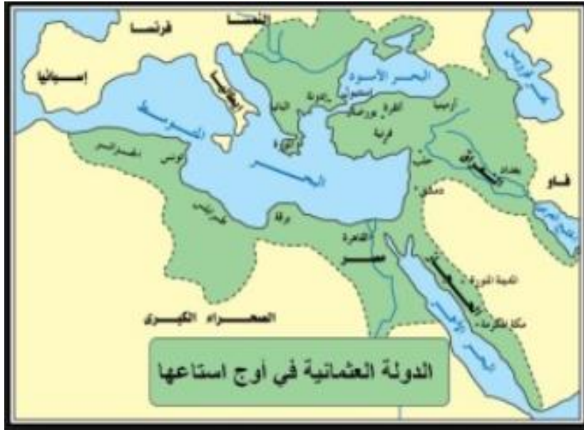
شكل رقم ( ١ ) خريطة الدولة العثمانية في أقصى اتساعها .