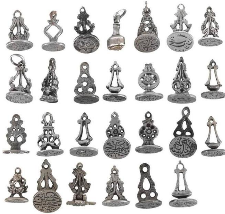
لوحة رقم ( ١٦ ) سبعة وعشرون ختما شخصيا من العصر العثماني ، ترجع لما بين القرنين ١١-١٣هـ / ١٧-١٩م .