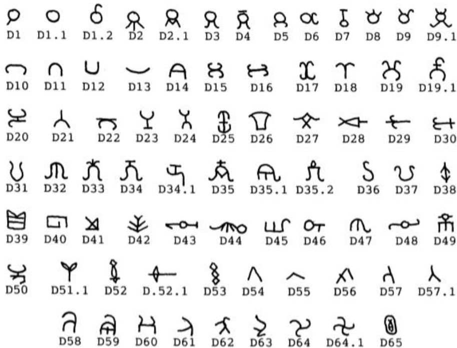
شكل رقم ( ٢ ) شارات وعلامات على أختام أناضولية قبل الاسلام تركت بعض آثارها على نظائرها العثمانية . عن :-

John.Boardman :- Seals and Signs Anatolian Stamp Seals of the Persian Period Revisited . Iran. Vol.36.1998.pp.1-3.Fig.1