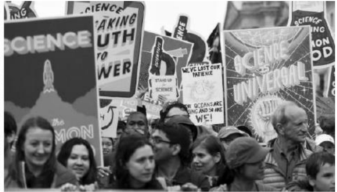
الشكل (3) اليوم الأرض العالمي

التقليل من الاستهلاك الفردي مما سيؤدي الي التقليل من المخرجات والمخلفات, وتتطلب هذه الاستراتيجية الي نشر ثقافة الترشيد ورفع المستوي المعرفي لدي افراد المجتمع, بالإضافة الي تحقيق سياسة تقليل الاستهلاك في مواد عملية التصنيع عن طريق استخدام منتجات طويلة المدي تدوم لفترة طويلة والابتعاد عن المنتجات احادية الاستخدام قدر الامكان ومنتجات التعبئة والتغليف.