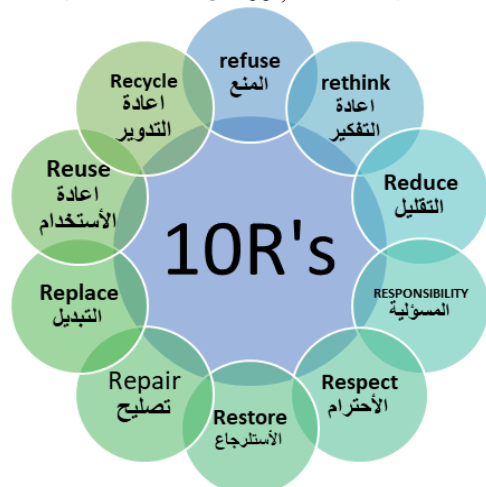
الشكل (4) مباديء ال R's10 للتعامل مع المخلفات

5. المنع Refuse: هو استراتيجية الرفض التي تتمثل في رفض استخدام بعض الخامات الضارة بالبيئة كالبلاستيك والخامات التي تحتوي في مضمونها علي مكونات بترولية واختيار البدائل الافضل للبيئة, فهذا الفعل هو اول شيء يخفف من الضغط علي المكبات وتقليل الاثار السلبية علي عناصر البيئة المحيطة, وايضا الامتناع عن انفاق الاموال في الاشياء التي قد لا تستخدم لفترة طويلة وخاصة ما تحدث ضرر بعد انتهاء صلاحية استخدامها, ورفض المنتجات احادية الاستخدام.