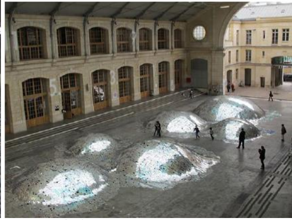
الشكل (21) "نفائات المناظر الطبيعية"

حياتها يدويًا لإنشاء سطح مموج كالأشكال العضوية في الطبيعة ويصنف الجسم على أنه من الفنون البيئية، ويتكون من المخلفات البيئية الصلبة التي تحمل صفات سامة لصناعتها من البترول