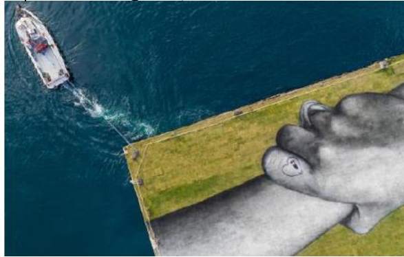
الشكل (21) "ما وراء الجدران"

على الجليد وادراكهم فجأة أن هناك ضوءاً شديدة الصدع والقفر والهش لأن الذوبان يطلق فقاعات ضغط ظلت عالقة في الجليد منذ 10000 عام مع التركيز علي عنصر الوقت الذي يمكن ان يتلاشي فيه كل شيء، خاصة بعد أن فهمنا الآليات الكامنة وراء هذه التغييرات، لدينا القدرة علي منعها من النمو. ويعتبر الفنان العمل الفني لا يتمثل فقط في قطع الثلج انما يتمثل في الفراغات بين أجزاء الثلج التي تزيد مع نقصانه مما يشعر الانسان بالتهديد علي فقدان ما حوله.