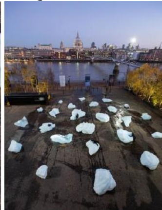
الشكل (22) "الساعة الثلجية"