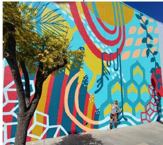
الشكل (8) جدارية للفنانة Lauren McElroy في سانتياجو , San Diego كاليفورنيا

2. الفن العام التجميلي Decorative public art :يستجيب الي الاحتياجات والمعايير الجمالية للمكان ولا تعبر في مضمونها عن فكرة او رأي ولكن تعتمد علي تناسق العناصر والتكوينات