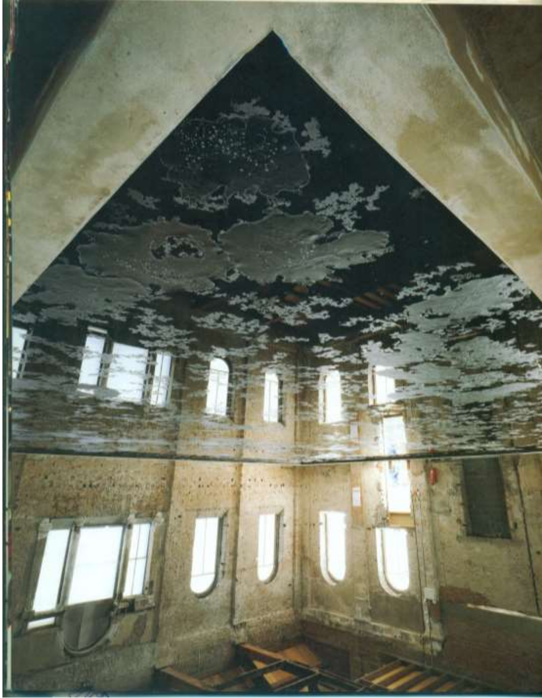
*طريقة المجسم والايهامى في صياغة الفراغ: عمل للفنان Christian Boltanski عام 1986 بعنوان (الظلال)