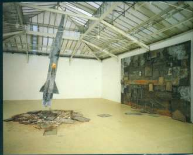
► In ANSELM KIEFER's 1991 installation Das Grab in den Lüften (The Tomb in the Air) (right) at the Yvon Lambert Gallery in Paris, a lead rocket was filled with earth and lit from inside so that it appeared to be on fire. Below it were scattered pieces of lead, glass and earth, while on the wall a construction of lead, glass and canvas acted as a backdrop.