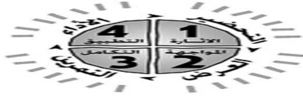
شكل(٢) مراحل التعلم السريع عند ماير(٢٠٠٨)