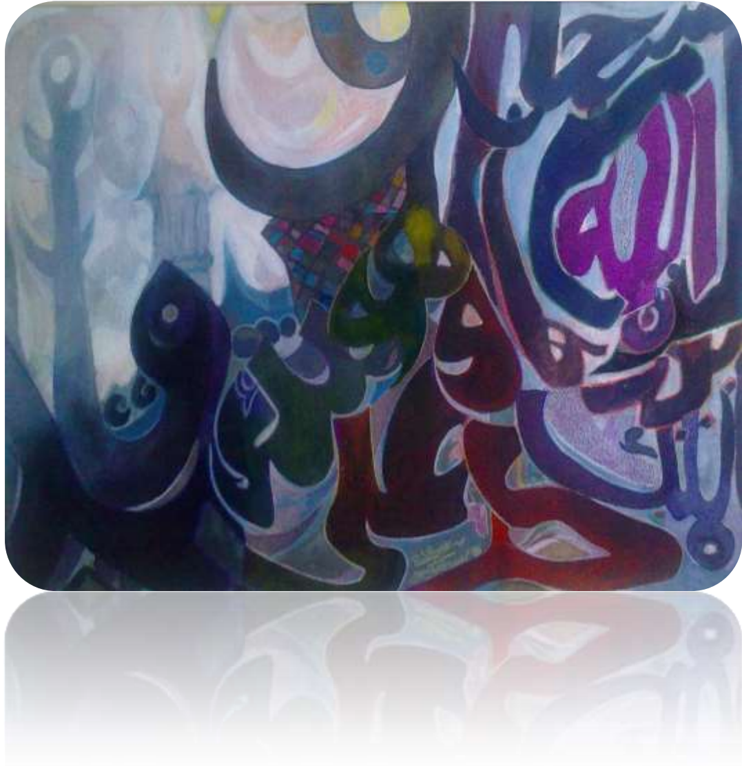
Figura 4. Caligrafías minaretas. Autoría propia. 1mx1m. 2016

Figura 4. Proceso experimental II. Ejemplo de fusión de caligrafía con paisaje imaginario. Técnicas mixtas sobre lienzo.