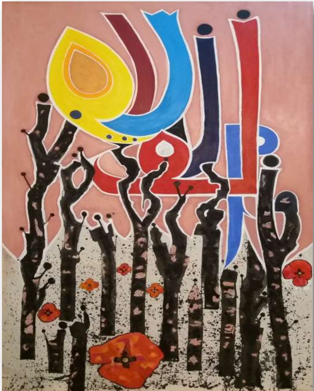
Figura 5. Campo entelado. Autoría propia. 3mx2m. 2017

Figura 5. Proceso experimental III. Ejemplo de fusión de caligrafía con paisaje inspirado en la huerta de Murcia. Técnicas mixtas y acrílico sobre lienzo.