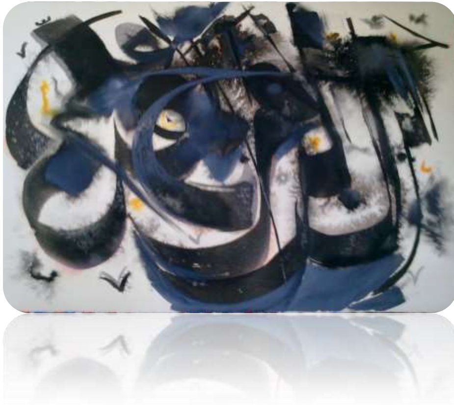
Figura 3. Caligrafía egipcia moderna. Autoría propia. 1mx1m. 2016

Figura 3. Proceso experimental I. Ejemplo de la evolución de la caligrafía egipcia moderna. Transformación del pictograma en ideograma. Técnica al agua. Tinta sobre papel.