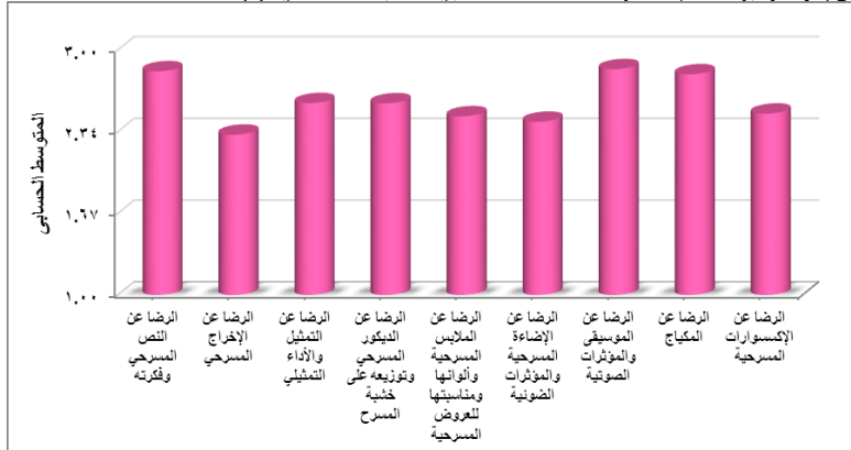
شكل (٣): يوضح المتوسطات الحسابية لأبعاد مقياس الرضا عن العروض المسرحية.

في حين وقع بُعد "الرضا عن الإخراج المسرحي" في مستوى "إلى حد ما"، حيث بلغ المتوسط الحسابي (٢.٣١)، وبلغت قيمة "ت" (١٥.٦١) ومستوى الدلالة (٠.٠٠١)، ويدل ذلك على أن مستوى هذا البُعد يقترب من المستوى المرتفع، مما يدل على عدم الرضا التام عن الاخراج المسرحي للعروض المسرحية المقدمة في مهرجان المسرح القومي. والشكل البياني (٣) يوضح المتوسطات الحسابية لأبعاد المقاييس: