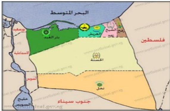
شكل رقم ١- توضح التقسيم الإداري لمحافظة شمال سيناء.

ويمثل هذا القطاع نسبة تصل إلى ٨٩% من عدد السكان بمحافظة شمال سيناء عام ٢٠١٧ وتضم شمال سيناء عدد ٦ مراكز إدارية هي: العريش (العاصمة)، رفح، الشيخ زويد، بئر العبد، الحسنة، ونخل ويدخل في نطاقها ٨٥ قرية و٤٧٣ شكل رقم (١).