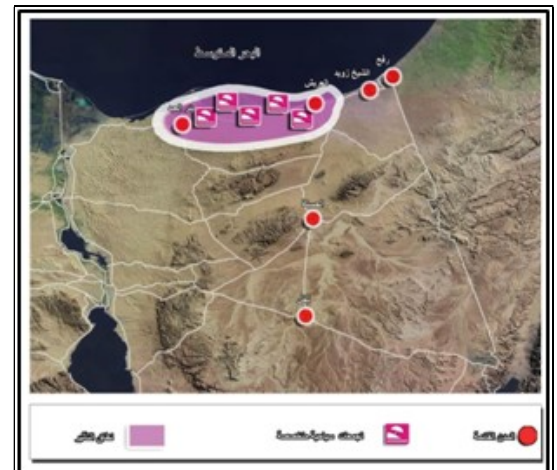
شكل رقم ٥ - التجمعات السياحية المتخصصة المقترحة بمحافظة شمال سيناء. المصدر :