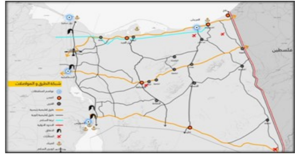
شكل رقم ٢- توضح شبكة الطرق والمواصلات بمحافظة شمال سيناء.

مطار الجورة: هو مطار يقع في شمال شبه جزيرة سيناء، وهو مطار داخلي حيث يقع قرب الساحل الشمالي لسيناء على البحر الأبيض المتوسط ويقع جنوب الشيخ زويد بحوالي ١٢ كم وهو أقرب مطار لمدينة رفح على الحدود مع أسرائيل إذ يبعد عنها مسافة ٣٠ كم فقط. ويبعد عن مطار العريش بحوالي ٥٠ كم شرقا وتبلغ مساحته ٧٨١٨ فدان هو مخصص لحركة الطائرات متعددة الجنسيات