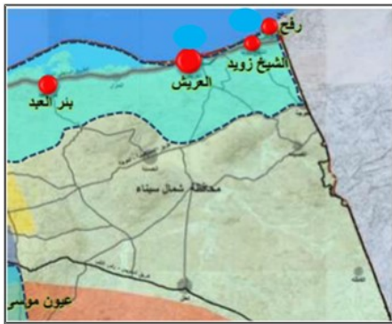
الشكل رقم ٣ - يوضح المناطق السياحية بشمال سيناء.

* مجموعة القرى الشاطئية بالمسايد والعريش وشمال شرق العريش، والشاليهات الخاصة بالأهالي على شاطئ العريش بإمداداته، ومجموعة الشاليهات بشاطئ الشيخ زويد ورفع. * مناطق سياحية أخرى قابلة للاستثمار السياحي، يقع في مقدمتها الفراغات الشاطئية على امتداد المنطقة من شمال غرب العريش حتى الحدود الآمنة لمحمية الزرايق، وبشاطئ رفح والشيخ زويد كذلك الفراغات بمناطق القرى الشاطئية بقطاع رمانة/ بالوظة وتبلغ مساحتها الإجمالية نحو مليون مربع، منها حوالي ٧٥% للقوات المسلحة. ومن بين هذه المناطق أيضا محمية الزرائيق من خلال الاستثمار السياحي التوفيقى بين الاحتياجات البيئية والاستغلال السياحي الآمن: وتقع المحمية بين الكيلو ٢٥ و٤٢ غرب العريش.