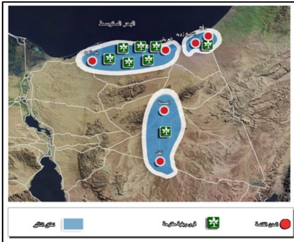
شكل رقم ٦ - القرى الريفية المقترحة بمحافظة شمال سيناء.