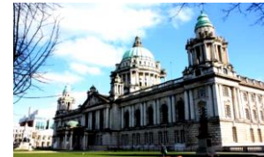
شكل (٧) قاعة مدينة بلفاست - أيرلندا الشمالية مثال لإحياء عمارة الباروك (محسن ، ٢٠٢٠)

* ولد في إيطاليا عام ١٣٧٧ ، معماري ومهندس ورسام ونحات وسينوغرافي إيطالي من عصر النهضة ، هم إنجازات فليبو برونلسكي في تصميمه وبناءه لقبه كاتدرائية فلورنسا بإيطاليا "كاتدرائية القديسة ماري" في فترة عصر النهضة .