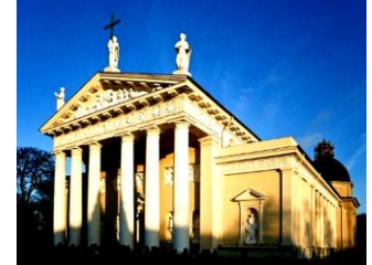
شكل (١) كاتدرائية فيلنوس - ليتوانيا مثال لإحياء العمارة الإغريقية والرومانية (محسن ، ٢٠٢٠)