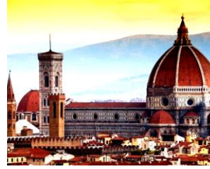
شكل (٢) كاتدرائية سانتا ماريا في فلورنسا، برونلسكي

الكلاسيكية الجديدة هي المعبرة عن هذه الحركة كرجعة في العودة إلي روعة الفن القديم حيث عكست الإهتمام بالعمارة القديمة للإغريق والرومان بطريقة مبدعة كما في شكل ، كان الإحياء في العمارة بالبادية، مستوحى من الأساليب الكلاسيكية الإغريقية والرومانية شكل (١) ، وأول من اتجه الي توظيف عمارة الماضي هو المعماري برونلسكي Brunelleschi Filippo* في مدينة فلورنسا وبناءه للكنيسة المشهورة في العام 1420 شكل (٢،٣) ، حيث وظف انساق العمارة الإغريقية والرومانية، وتناسباتها ، ثم إنتقل لجميع الطرز حيث الإحياء لعمارة عصر النهضة الإيطالية، والعمارة المصرية القديمة شكل (٤) ، والعمارة القوطية شكل (٥) ، والعمارة الرومانسكية شكل (٦) ، وعمارة الباروك شكل (٧) ، وعمارة الركوكو، وغيرها من الطرز القديمة.