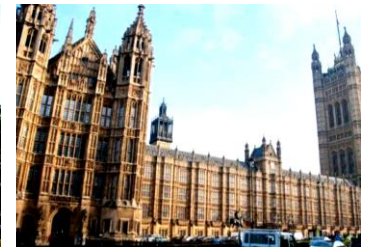
شكل (٥) مبني البرلمان البريطاني - لندن مثال لإحياء العمارة القوطية (محسن ، ٢٠٢٠)