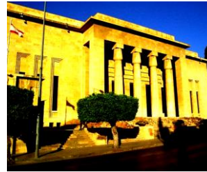
شكل (٤) المتحف الوطني اللبناني - بيروت مثال لإحياء العمارة الفرعونية (محسن ، ٢٠٢٠)