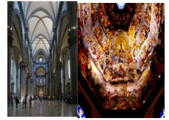
شكل (٣) التفاصيل الداخلية لكاتدرائية سانتا ماريا www.wikipedia.com https://ar.wikipedia.org/wiki/