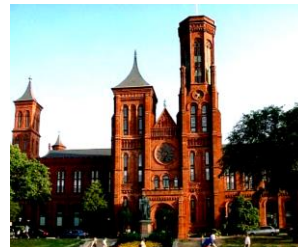
شكل (٦) مبني معهد سميثسون - واشنطن مثال لإحياء العمارة الرومانسكية (محسن ٢٠٢٠ ،