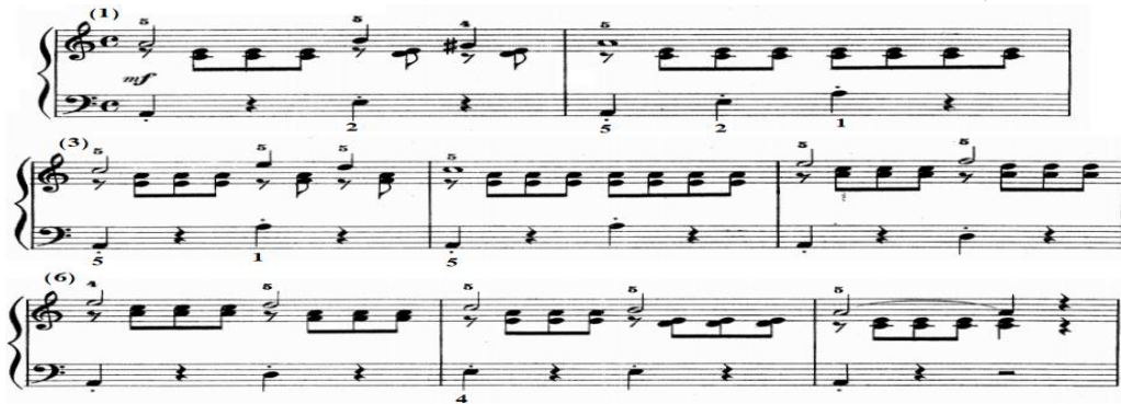
شكل رقم (١٥)

جاء اللحن باليد اليمنى في سلم لا/ص بصوت متوسط القوة mf وبإيقاع واضح marcato عبارة عن نغمات ممتدة ومفردة في صوت خارجي يصاحبها في صوت داخلي مسافات هارمونية متكررة، ويصاحب اللحن باليد اليسرى نغمات مفردة متقطعة Staccato في صوت الباص على الدرجة الأولى في سلم لا/ك يتخللها سكتات، والشكل التالي يوضح ذلك.