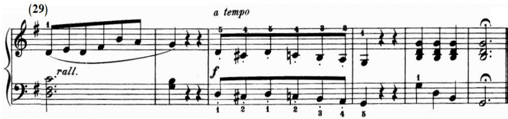
شكل رقم (١٤)

في م (٢٩)، (٣٠) جاء اللحن في اليد اليمنى عبارة عن مسافة ثانية لحنية متصلة وتكرارها يليها نغمات سلمية هابطة متصلة يصاحبها في اليد اليسرى تألف هارموني ثلاثي ممتد يرتكز على مسافة هارمونية مع التباطؤ rall ، وفي م (٣١)، (٣٢) جاء اللحن عبارة عن نغمات كروماتية هابطة متقطعة على مسافة أوكتاف بين اليدين مع الرجوع للسرعة الأصلية atempo ، وتنتهي الدراسة على تألف الدرجة الأولى في سلم صول/ك المتكرر ويصاحبه في اليد اليسرى أربيج هابط مع ظهور علامة إطالة المدة الزمنية للتألف الممتد في م (٣٤)، والشكل التالي يوضح ذلك.