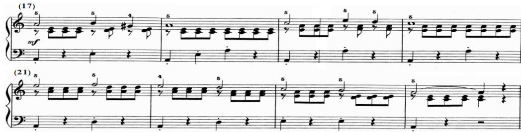
شكل رقم (١٨)

الفكرة الثالثة: من م(١٧-٢٤) تنتهي بقفلة تامة في سلم لا/ص. إعادة حرفية للفكرة الأولى من م(١-٨)، والشكل التالي يوضح ذلك.