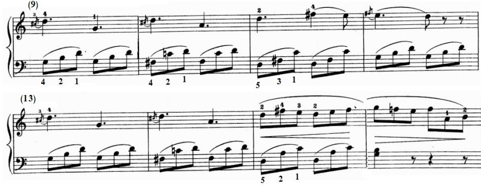
شكل رقم (٧)

جاءت تصوير للفكرة الأولى في سلم صول/ك، مع حدوث تغيير الحلية إلى أتشيكاتورا، وفي م(١٥)،(١٦) ظهرت مسافات لحنية متصلة ونغمات سلمية صاعدة وهابطة باليد اليمنى ويصاحبها باليد اليسرى تألف منفرد صاعد ومتصل يرتكز على مسافة هارمونية، والشكل التالي يوضح ذلك.