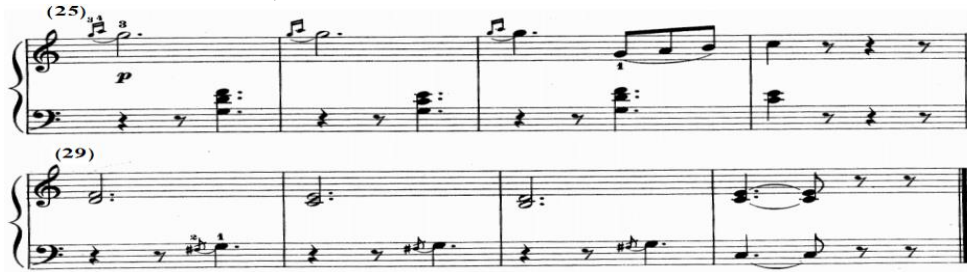
شكل رقم (١٠) الفكرة الرابعة من م (٢٥-٣٢) في الدراسة الثانية

في م (٢٥)، (٢٦) جاء حوار لحنى بين اليدين في سلم دو/ك عبارة عن نغمة ممتدة يسبقها حلية الأبوجاتورا من نغمتين في اليد اليمنى وترد عليها اليد اليسرى بتألفات هارمونية على الدرجة الخامسة والأولى يسبقها سكتات، وفي م (٢٧)، (٢٨) يلي النغمة الممتدة التى يسبقها حلية الأبوجاتورا نغمات سلمية صاعدة متصلة يصاحبها باليد اليسرى مسافة هارمونية مزدوجة، ومن م (٢٩)-(٣١) تتبادل الأدوار بين اليدين حيث تؤدي اليد اليمنى مسافات هارمونية ممتدة واليد اليسرى تؤدي نغمة ممتدة يسبقها حلية الأتشيكاتورا ويسبقها سكتات، وتنتهي الدراسة بمسافة هارمونية باليد اليمنى ونغمة مفردة باليد اليسرى خاضعين لرباط زمني، والشكل التالى يوضح ذلك.