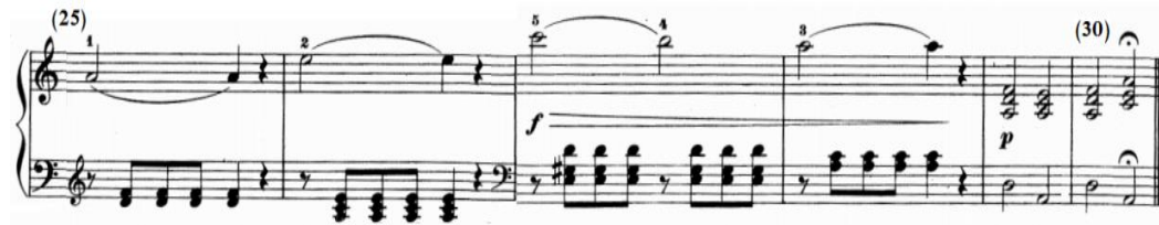
شكل رقم (١٩)

جاء اللحن باليد اليمنى عبارة عن نغمات ممتدة برباط زمني تنتهي بسكتة نوار يتخللها مسافة لحنية هابطة خاضعة لقوس لحنى قصير Slur بصوت قوى f وتدرج في خفوت الصوت dim ، وينتهي لحن الدراسة على تألفات هارمونية تركز على تألف الدرجة الأولى في سلم لا/ك بإستخدام علامة إطالة الزمن، ويصاحب اللحن باليد اليسرى في نموذج إيقاعي متكرر مع تغيير المفتاح مسافات وتآلفات هارمونية على الدرجة الأولى والخامسة في سلم لا/ك، وتنتهي بنغمات ممتدة في صوت الباص، والشكل التالي يوضح ذلك.