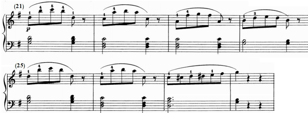
شكل رقم (١٣)

الفكرة الثالثة: من م (٢١-٢٨) تنتهي بقفلة تامة سلم صول/ك. هي إعادة حرفية للفكرة الأولى من م (١-٨)، والشكل التالي يوضح ذلك.