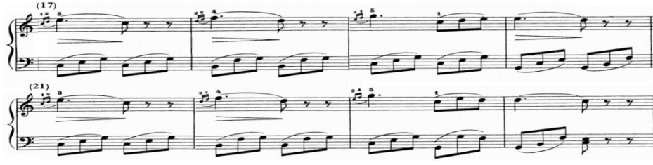
شكل رقم (٩)

هى إعادة حرفية للفكرة الأولى من م (١-٨)، والشكل التالى يوضح ذلك.