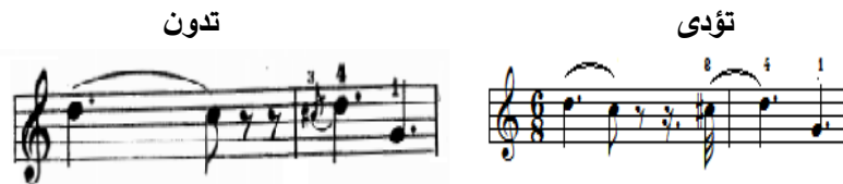
شكل رقم (٨)

يتطلب أداء المهارة أن يستقطع زمن الحلية من نهاية النغمة التي تسبقها، ويوضح الباحث في الشكل التالي كيفية تدوين وأداء حلية الأتشيكاتورا.