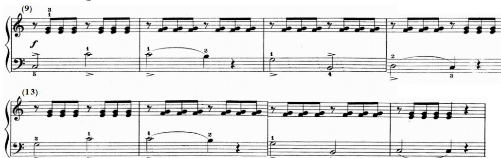
شكل رقم (١٧)

جاء اللحن باليد اليسرى في سلم دو/ك بصوت قوى f عبارة عن نغمات ممتدة خاضعة لعلامة الضغط القوى accent على الدرجة الأولى والخامسة في سلم دو/ك ومسافات لحنية هابطة خاضعة للقوس اللحنى القصير Slurs ، ويصاحب اللحن باليد اليمنى نموذج إيقاعى متكرر يحتوى على مسافات هارمونية متكررة ومتتالية تبدأ بسكتة كروش، والشكل التالى يوضح ذلك.