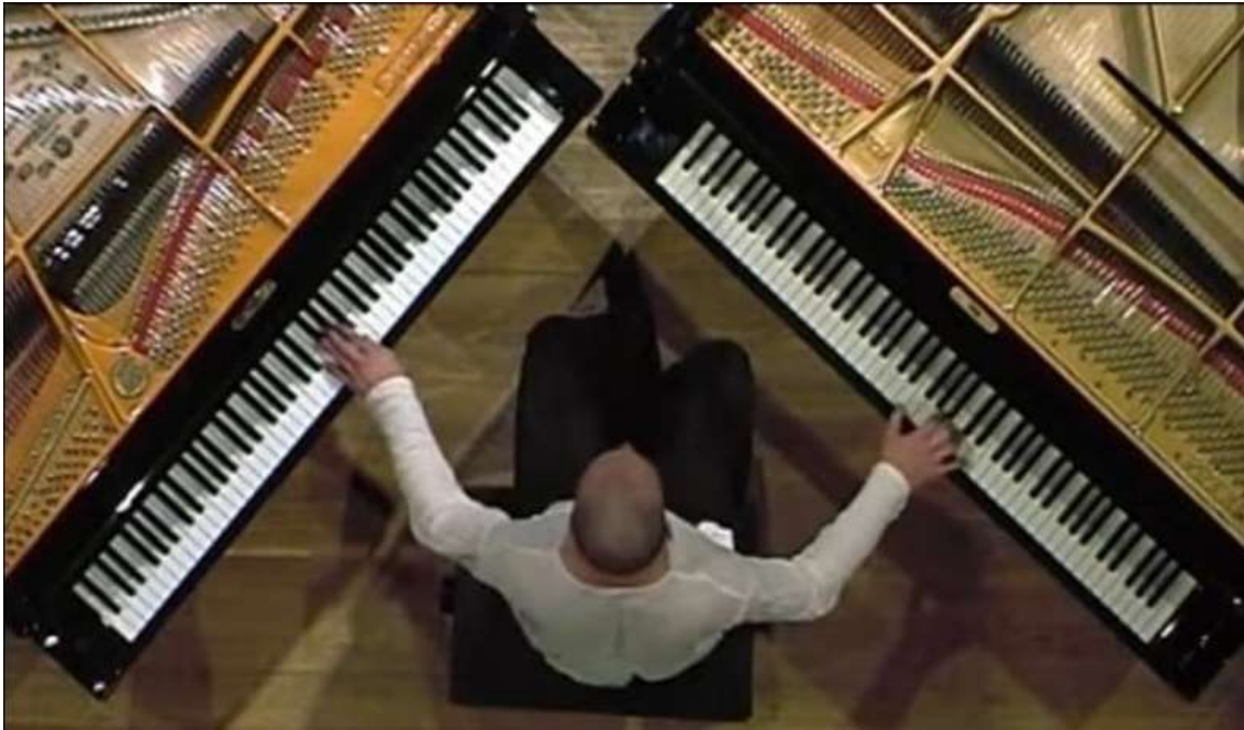
شكل رقم (٥) يوضح وضع البيانو الأول والبيانو الثاني والجلسة الصحيحة للعازف قبل بداية الأداء