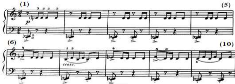
شكل رقم (٨)

جاء الأداء من م(١)- (٥) بالتبادل بين اليدين في بصوت خافت P وفي نموذج إيقاعي متكرر حيث تبدأ اليد اليسرى بمسافة هارمونية منقطعة وخاضعة للضغط القوي accent ثم ينتقل الأداء لليد اليمنى بنغمة (رى) المتكررة مع تغيير الأصابع، وجاء اللحن في م(٦) باليد اليمنى عبارة عن نغمة مفردة خاضعة للضغط القوي يليها نغمة (رى) المتكررة، ويتكرر ذلك في م(٨)، (٩) مع تغيير النغمة الأولى في م(٩)، وجاء في م(٧) باليد اليمنى مسافة ثالثة لحنية صاعدة متكررة وملتصقة Legato مع التدرج في قوة الصوت Cresc، ويتكرر ذلك بالتصوير في م(١٠)، مع استمرار اليد اليسرى في أداء المسافة الهارمونية التي يتخللها سكّات، والشكل التالي رقم (٨) يوضح ذلك.