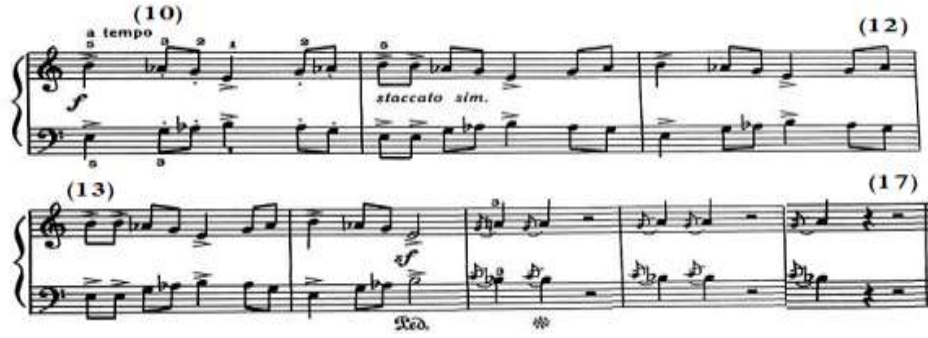
شكل رقم (٥)

مسافة ثانية لحنية صاعدة في اليد اليمنى ومسافة ثانية لحنية هابطة في اليد اليسرى، والشكل التالي رقم (٥) يوضح ذلك.