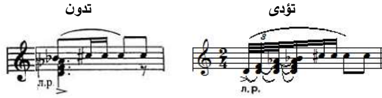
شكل رقم (١٢)

م(٢٨)،(٣٠)،(٣١)، ويتطلب أداء هذه التقنية أن تعزف نغمات حلية الأريجييو من النغمة الغليظة إلى النغمة الحادة بقوة متساوية، ويوضح الباحث في الشكل رقم (١٢) كيفية أداء حلية الأريجييو.