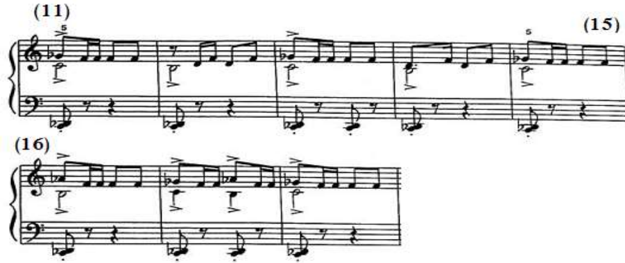
شكل رقم (٩)

إعادة بالتصوير للنموذج الإيقاعي في م(٦) بالجملة الأولى في اليد اليمنى مع التكرار وتغيير النغمة الأولى، ولكن يصاحبه في صوت نغمة ممتدة في بداية كل مازورة، ويتخلله مسافة ثلاثة لحنية صاعدة مع التكرار في م(١٢)، (١٤)، وتستمر اليد اليسرى في المصاحبة بالمسافة الهارمونية المتقطعة التي يتخللها سكتات، والشكل التالي رقم (٩) يوضح ذلك.