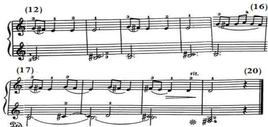
شكل رقم (٢)

الفكرة الثانية من م(١٢)- (٢٠) في مقطوعة لحن شعبي