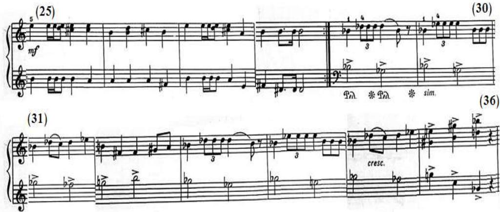
شكل رقم (٢٤)

جاء اللحن من م(٢٥)- (٢٨) في نموذج إيقاعي موحد في اليدين بصوت متوسط القوة mf في مفتاح (صول)، ويحتوي النموذج على نغمات مفردة ومسافات هارمونية متكررة باليد اليمنى ونغمات مفردة متكررة وتنتهي بمسافات لحنية هابطة باليد اليسرى، وجاء من م(٢٩)- (٣٢) إعادة إلى لحن الفكرة الثالثة من م(١٧)- (٢٠) مع التنويع باستخدام إيقاع الثلاثية باليد اليمنى، وتغيير النغمات المفردة إلى ممتدة مع الضغط القوي وأدائها أوكتاف أعلى، ويتكرر ذلك من م(٣٣)- (٣٦) مع التدرج في قوة الصوت Cresc في نهايتها، والشكل التالي رقم (٢٤) يوضح ذلك.