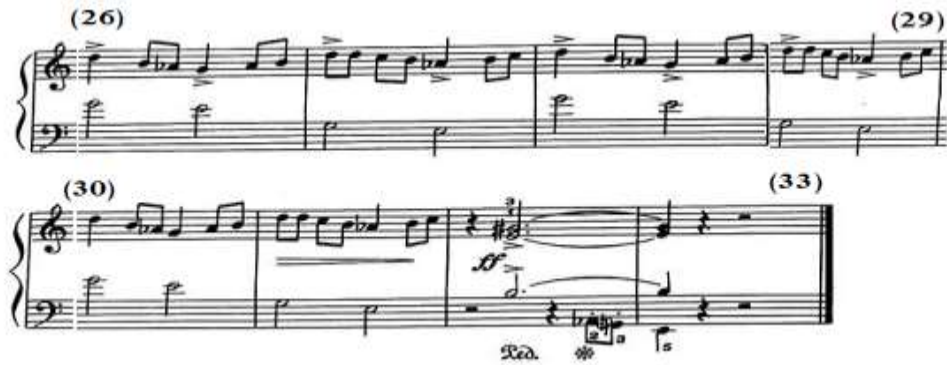
شكل رقم (٧)

جاء لحن اليدين من م(٢٦) - (٣١) إعادة حرفية للجملة الثالثة من م(٢٠) - (٢٥) مع التدرج في خفوت الصوت dim في نهايته، وفي م(٣٢)، (٣٣) تنتهي المقطوعة بمصاحبة باليد اليمنى من مسافة هارمونية ممتدة خاضعة لرباط زمني بصوت قوى جداً ff مع إستخدام الدواس، وجاء اللحن باليد اليسرى عبارة عن نغمة مفردة ممتدة خاضعة لرباط زمني يصاحبها في صوت الباص مسافة ثانية لحنية هابطة منقطعة ونغمة مفردة، والشكل التالي رقم (٧) يوضح ذلك.