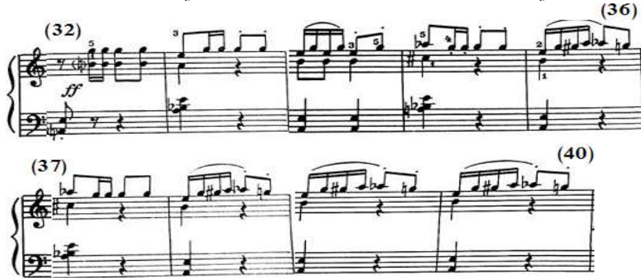
شكل رقم (١٣)

جاءت م(٣٢) إعادة إلى م(١) بالتصوير مع أدائها في مسافة سادسة هارمونية باليد اليمنى، وجاءت الجملة الخامسة إعادة للتيمة الأساسية للمقطوعة في صوت السوبرانو بالتصوير والتنويع ويصاحبها في صوت داخلي نغمات مفردة، وجاء باليد اليسرى مصاحبة من مسافة هارمونية متكررة وتألف هارموني وتكراره يفصل بينهما سككيات، والشكل التالي رقم (١٣) يوضح ذلك.