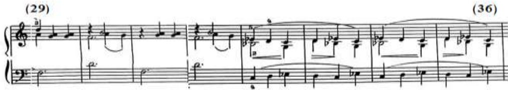
شكل رقم (١٩)

جاء من م(٢٩)-٢(٣٢) تكرار للعبارة من م(١٥)-٢(١٨) بالجملة الثالثة في الفكرة الأولى مع تغيير المسافة اللحنية باليد اليسرى إلى مسافة سادسة لحنية هابطة وصاعدة، وجاء من م(٣٣)-١(٣٦) نموذج إيقاعي موحد في اليدين يحتوى على مسافات لحنية متصلة Legato في عكس الإتجاه بين اليدين مع التدرج في قوة الصوت Cresc وخفوته dim، مع ملاحظة ظهور نغمات مفردة في صوت داخلي تصاحب لحن اليد اليمنى، والشكل التالي رقم (١٩) يوضح ذلك.