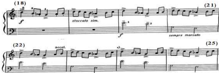
شكل رقم (٦)

جاءت إعادة للتيمة الأساسية بالجملة الأولى بالتصوير في جنس حجاز (صول)، وجاء باليد اليسرى سكتات في م(١٨)، (١٩)، من م(٢٠)- (٢٥) جاءت مصاحبة من نغمات ممتدة لأربيج دو/ك الهابط بصوت قوى، مع استمرار الأداء في إيقاع واضح وبارز sempre marcato من م(٢١)، والإسراع التدريجي accelrando من م(٢٢)٢، والشكل التالي رقم (٦) يوضح ذلك.