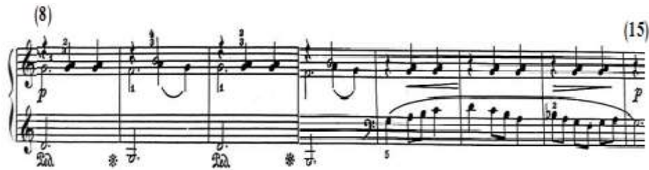
شكل رقم (١٦)

الجملة الثانية: من م ٢ (٨) - م ١ (١٥) تنتهي بقفلة تامة في سلم صول/ص. جاء من م ٢ (٨) - م ١ (١١) تكرار للعبارة من م ٢ (١) - م ١ (٤) بالجملة الأولى مع إضافة نغمات مفردة ممتدة في صوت داخلي باليد اليمنى وتغيير المسافة اللحنية بين النغمات المفردة الممتدة باليد اليسرى إلى مسافة خامسة لحنية صاعدة وهابطة، وجاء من م ١ (١٢) - م ١ (١٥) إعادة للحن اليد اليمنى من م ١ (٥) - م ١ (٨) ولكن تؤديه اليد اليسرى أوكتاف أسفل في مفتاح (فا)، ويصاحبه باليد اليمنى مصاحبه مأخوذه من م ١ (١) مع التكرار مع التدرج في قوة الصوت Cresc وخفوته dim، والشكل التالي رقم (١٦) يوضح ذلك.