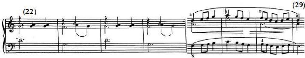
شكل رقم (١٨)

جاء من م(٢٢)-٢(٢٥) تكرار للعبارة من م(٨)-٢(١١) بالجملة الثانية في الفكرة الأولى، وجاء من م(٢٦)-١(٢٩) إعادة بالتصوير للحن اليدين بالجملة الثالثة في الفكرة الأولى من م(١٩)-١(٢١) مع تغيير مصاحبة الصوت الداخلي باليد اليمنى إلى نغمات مفردة ممتدة وخاضعة لرباط زمني، والشكل التالي رقم (١٨) يوضح ذلك.