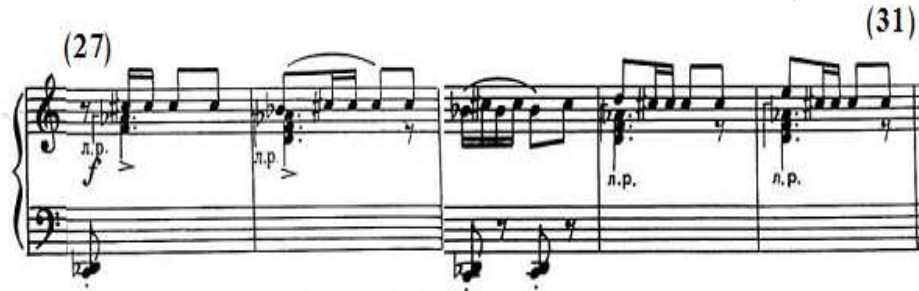
شكل رقم (١١)

بدأ اللحن باليد اليسرى في م (٢٧) بمسافة الهارمونية المتكررة من بداية المقطوعة، ثم ينتقل الأداء إلى اليد اليمنى بمسافة هارمونية ممتدة وخاضعة لحلية الأريجييو يصاحبها في صوت خارجي نغمة (دو#) المتكررة والمتصلة، وجاء في م (٢٨) تألف هارموني ثلاثي ممتد وخاضع لحلية الأريجييو باليد اليسرى ويصاحبه باليد اليمنى مسافة ثانية لحنية صاعدة يليها نغمة (دو#) المفردة المتكررة والمتصلة، ويتكرر ذلك في م (٣٠)، (٣١) مع تغيير المسافة اللحنية باليد اليمنى من صاعدة إلى مسافتين هابطتين، وجاءت م (٢٩) تصوير إلى م (٧) في الجملة الأولى باليد اليمنى، والشكل التالي رقم (١١) يوضح ذلك.