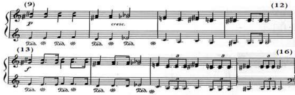
شكل رقم (٢٢)

جاء اللحن بصوت خافت P في نموذج إيقاعي موحد في اليدين في مفتاح (صول)، وجاء من م(٩)- (١٢) يحتوى على مسافات هارمونية باليد اليمنى ونغمات مفردة وتكرارها باليد اليسرى تنتهي بمسافات لحنية، ويتكرر ذلك من م(١٣)- (١٦) في اليدين بصوت قوى ولكن مع التنويع في إيقاعات أخرى في اليدين مثل إيقاع الثلاثية، والشكل التالي رقم (٢٢) يوضح ذلك.