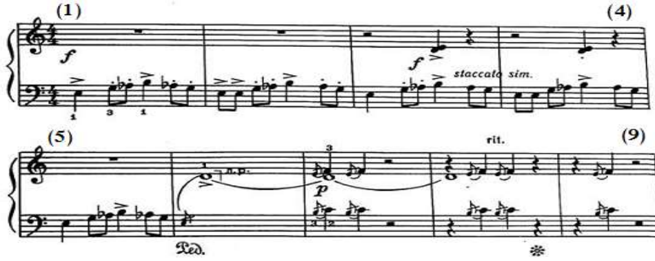
شكل رقم (٣)

الجملة الأولى: من م(١)- (٩) تنتهي على الدرجة الثانية في جنس حجاز (مي). بدأ اللحن في اليد اليسرى بصوت قوى f ، حيث ظهرت في م(١) التيمة الأساسية للمقطوعة في جنس الحجاز على درجة (مي) وجاءت عبارة عن نغمة مفردة خاضعة لعلامة الضغط القوي accent (>) يليها مسافة ثانية لحنية صاعدة متقطعة Staccato، يليها نغمة مفردة مع الضغط القوي ومسافة ثانية لحنية هابطة متقطعة مع ظهور سكتات باليد اليمنى، ويتكرر ذلك في م(٢) مع تكرار النغمة المفردة، وجاءت م(٣)، (٤) إعادة إلى م(١)، (٢) باليد اليسرى مع أداء متقطع متشابه Staccato Simile وبصوت قوي، ودخول مصاحبة باليد اليمنى في م(٣)، (٤) من مسافة هارمونية متقطعة يسبقها ويليهما سكتات، وفي م(٥) استمرت التيمة الأساسية باليد اليسرى وسكتات باليد اليمنى، وفي م(٦) جاء اللحن في اليدين عبارة عن حلقة أتشيكاتورا باليد اليسرى تسبق نغمة مفردة ممتدة باليد اليمنى خاضعة لرباط زمني والضغط القوي على مسافة سابعة لحنية صاعدة، وفي م(٧) ظهر نموذج موحد على مسافة رابعة لحنية بين اليدين يحتوى على نغمة مفردة وتكرارها تسبقها الأتشيكتورا على مسافة ثانية لحنية صاعدة تصاحب النغمة المفردة الممتدة في صوت خارجي باليد اليمنى، ويتكرر ذلك في م(٨)، (٩) ولكن بظهور سكتات قبل وبعد النغمة التي تسبقها الأتشيكتورا مع التباطؤ التدريجي ritard، والشكل التالي رقم (٣) يوضح ذلك.