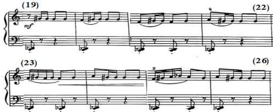
شكل رقم (١٠)

لحنية هابطة، مع العودة للنموذج المتكرر مرة أخرى في م (٢٦)، وتستمر اليد اليسرى في المصاحبة بالمسافة الهارمونية التي يتخللها سكتات، والشكل التالي رقم (١٠) يوضح ذلك.