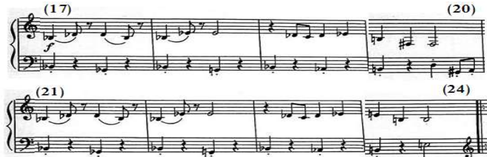
شكل رقم (٢٣)

جاءت إعادة للفكرة الأولى من م(١)- (٨) ولكن أوكتاف أعلى في اليد اليمنى، وتغيرت مصاحبة اليد اليسرى إلى نغمات مفردة متقطعة Staccato يفصل بينها سكتات نوار في مفتاح (فا)، والشكل التالى رقم (٢٣) يوضح ذلك.