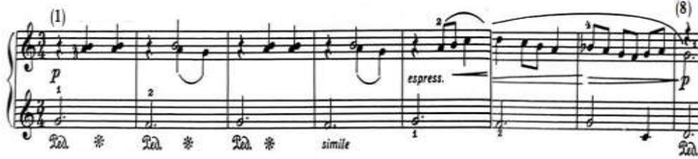
شكل رقم (١٥)

بدأ اللحن في م(١)-(٤) في صوت خافت P بالعبارة المتكررة في بداية كل جملة بالمقطوعة، حيث بدأت في م(١) بنغمة ممتدة باليد اليسرى يليها مسافة هارمونية وتكرارها باليد اليمنى مع استخدام الدواس Pedal، ويتكرر ذلك في م(٢) مع ظهور مسافة ثانية لحنية هابطة خاضعة لقوس لحنى قصير Slur في صوت داخلي باليد اليمنى، وجاء م(٣)،(٤) إعادة حرفية إلى م(١)،(٢)، ومن م(٥)-(٨) بدأ اللحن بنغمة ممتدة باليد اليسرى يليها لحن بتعبير espressivo في اليد اليمنى من نغمات سلمية صاعدة وهابطة متصلة Legato ترتكز على نغمة ممتدة مع التدرج في قوة الصوت Cresc وخفوته dim ، ويصاحبها باليد اليسرى نغمات مفردة ممتدة في مسافة ثانية لحنية صاعدة وهابطة، والشكل التالي رقم (١٥) يوضح ذلك.