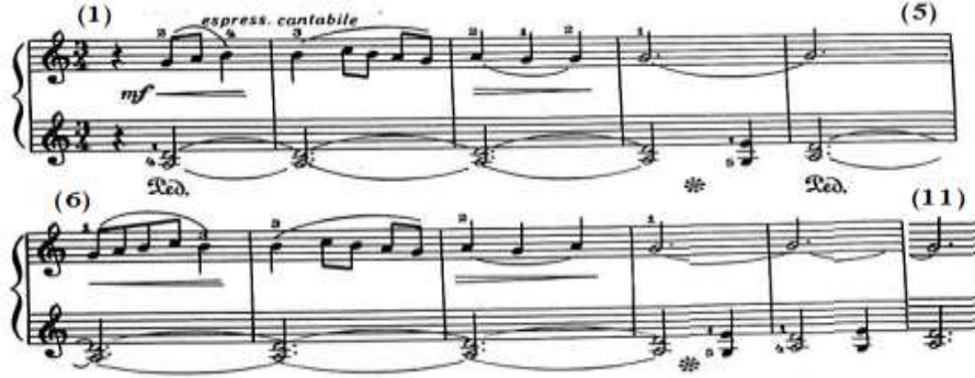
شكل رقم (١)

جاء اللحن باليد اليمنى في سلم صول/ك بصوت متوسط القوة mf وبأسلوب تعبيرى وغنائى Espressivo Cantabile ، وبدأ اللحن في م(١) بسكتة نوار يليها ثلاث نغمات سلمية صاعدة متصلة Legato مع التدرج في قوة الصوت Cresc ، وجاء في م(٢) مسافة لحنية صاعدة يليها ثلاث نغمات سلمية هابطة في قوس لحنى متصل، وجاء في م(٣) مسافة ثانية لحنية هابطة مع تكرار النغمة الثانية بالمسافة اللحنية في قوس لحنى متصل مع التدرج في خفوت الصوت dim ، وجاء باليد اليسرى من م(١)- (٤) مصاحبة بدأت بسكتة نوار يليها مسافة رابعة هارمونية ممتدة برباط زمني مع التدرج في قوة الصوت Cresc وخفوت الصوت dim ، وظهر في م(٤)، (٥) حوار لحنى بين اليدين حيث تؤدي اليد اليمنى نغمة مفردة ممتدة خاضعة لرباط زمني وترد عليها اليد اليسرى في م(٤)، (٥)، بمسافتين هارمونيتين متتاليتين وهما مسافة السادسة والرابعة الهارمونية الممتدة برباط زمني، وجاء من م(٦)- (١١) إعادة من م(١)- (٥)، مع حدوث تغيير في م(٦) حيث بدأ لحن اليد اليمنى بأربع نغمات سلمية صاعدة متصلة وتؤدي اليد اليسرى تؤدي المسافة الهارمونية الممتدة من م(٥)، مع تطويل النغمة الممتدة بالرباط الزمني في اليد اليمنى والمسافات الهارمونية باليد اليسرى في م(١٠)، (١١) مع التكرار، والشكل التالي رقم (١) يوضح ذلك.