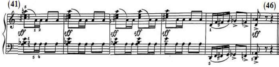
شكل رقم (١٤)

يعتمد اللحن على تكرار النموذج الإيقاعي المتكرر بالمقطوعة ولكنه موحد في اليدين، وجاء من م(٤١)- (٤٤) عبارة عن تألف هارموني ثلاثي يؤدي بالضغط بقوة شديدة sff في قوس لحني قصير مع نغمة مفردة ثم تتكرر، وجاء اللحن في اليدين في م(٤٥)، (٤٦) عبارة عن مسافات لحنية صاعدة متصلة تنتهي بمسافة لحنية هابطة يليها مسافة هارمونية خاضعين للضغط القوي، والشكل التالي رقم (١٤) يوضح ذلك.