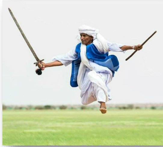
ملحق رقم ١: الاستعراض الجسدي بالسيف في نمط السيرة بشرق السودان