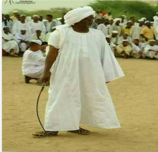
ملحق رقم ٢: إحضار السوط استعداداً لطقس الجلد في العرضة