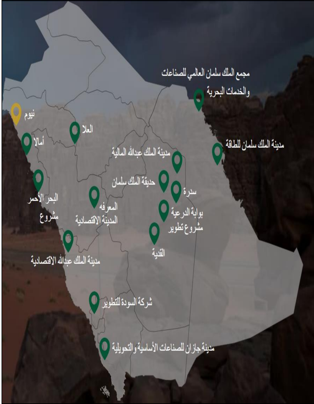
شكل ٤: مشاريع الاستثمار في المملكة العربية السعودية.