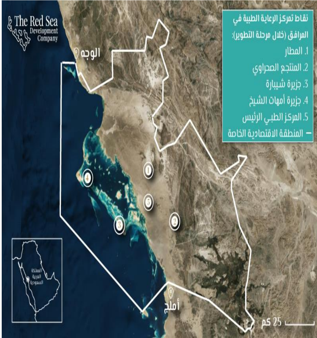
شكل ٥: مشروع البحر الأحمر السياحة الفخمة