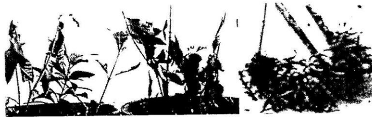
Fig. 2. Showing root & basal stem rot symptoms on plant foliage & roots.