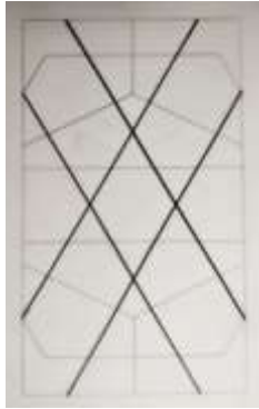
شكل رقم (١٢).

رسم تحليلي لحشوة من باب قبة الصالح نجم الدين أيوب (٢) (تنفيذ الباحث).