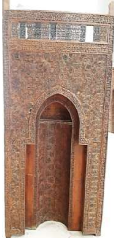
شكل رقم (٤) محراب السيدة رقية أثر رقم (٤٤٦)

والمحراب قائم علي شبكية هندسية سداسية استخدم الفنان النجمة السداسية بشكل آخر في تجميع الحشوات الخشبية والتي ترتب عليها ظهور اشكال هندسية حول النجمة وامتدت اوتار الاشكال السداسية والتي ترتب عليها أيضا ظهور ما يعرف بببيت الغراب او الخنجر وكذلك اللوزة وكانت هذه الفترة هي البداية الحقيقية لظهور مفردات الطباق النجمي.