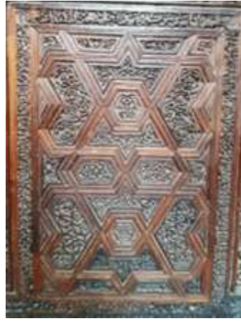
شكل رقم (٨).

رسم تحليلي لحشوة من التركيبة الخشبية لضريح الأمام الحسين (٢) (تنفيذ الباحث).