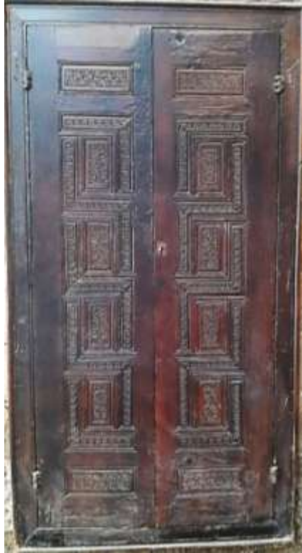
شكل رقم (١٠).

مركبة يطلق عليها اسم المفروكة ، ونوع الحشوات في العمل حشوات خشبية بسيطة ومركبة، النظم الهندسية في العمل قائم علي حشوات خشبية بسيطة ومركبة امتازت بدقة حفر الرسوم الهندسية علي الحشوة حيث اشتملت الحشوات الخشبية داخل الباب علي تكرار النجمة السداسية.