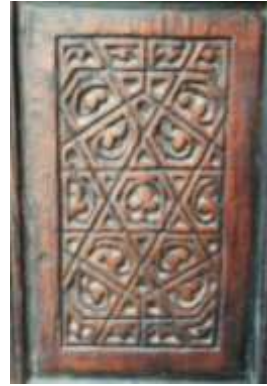
شكل رقم (١١).

رسم تحليلي لحشوة من باب قبة الصالح نجم الدين أيوب (٢) (تنفيذ الباحث).