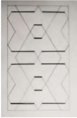
شكل رقم (٩).

رسم تحليلي لحشوة من التركيبة الخشبية لضريح الأمام الحسين (٢) (تنفيذ الباحث).