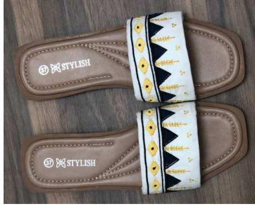
شكل ٤ التصميم المنفذ للحذاء

يتضح من الشكل ٣، أن التصميم الرابع جاء في الترتيب الأول وذلك بمتوسط رتب بلغ (٤٧٢.٦٤)، وأن التصميم السادس جاء من حيث آراء عينة البحث في الترتيب الثاني وذلك بمتوسط رتب بلغ (٥٧.٥٧). بينما جاء التصميم الخامس في الترتيب الثالث والتصميم الأول في الترتيب الرابع بمتوسط رتب (٤٥٧.٣٨). وجاء في الترتيب الأخير التصميم الثاني بمتوسط رتب (٤١٦.٨٧)، يسبقه في الترتيب التصميم الثالث بمتوسط رتب (٤٤٣.٦٢). وهذا يتفق مع دراسة (العسيري وآخرون، ٢٠١٧) بان هناك زخارف ونقوش شعبية يمكن الاستفادة منها في الابتكار والتصميم كونها مصدر للإلهام وهذا ماتم ذكره في دراسة (الخليوي، ٢٠١٩) بان الاستلهام من الهوية السعودية تساهم في الابتكار وتوسيع مدارك التخيل لدى المصمم لما لها من جوانب إبداعية وجمالية. كما ان التصميمات وفقاً لآراء المحكمين وافراد العينة يعطي افكاراً يمكن ان يستفاد منها في المكملات الأخرى وعلى ذلك تم تنفيذ التصميم الرابع كونه الأفضل شكل ٤ وشكل ٥.