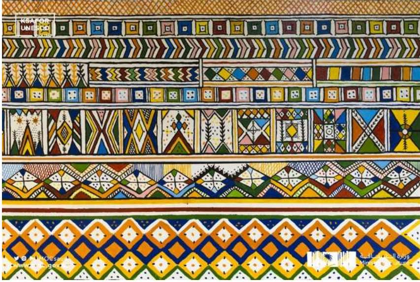
شكل ١ لوحة جدارية من القط العسيري