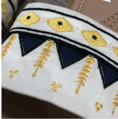
شكل ٥ الاستلهام من القط العسيري وتصميمه