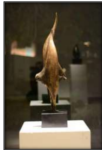
شكل (١) : اسم العمل : راقصة باليه

وفيما يلي يعرض الباحث نماذج من اعماله موضوع البحث .