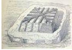
Maçonnerie armée de la pyramide