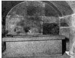
تابوت سنوسرت الثاني