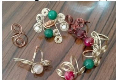
شكل (8) مجموعة من الخواتم السلك الأصفر مع الأحجار