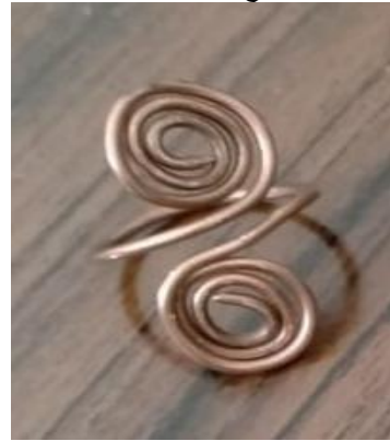
شكل (5) خاتم من السلك الأحمر