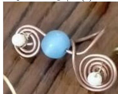
شكل (6) خاتم من السلك الأحمر والأحجار