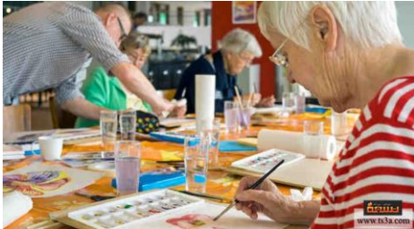
شكل رقم (2) ممارسة العلاج بالفن للتخفيف من الضغوط النفسية (5)

والهدف الرئيسي من العلاج بالفن في هذا البحث هو زيادة الدعم النفسي لعينة البحث وهي مريضات سرطان الثدي عن طريق تصميم الحلبي حتى يساعد في تحسين الحالة النفسية العامة للمريضة. إن ما يعانيه المريض المصاب بالسرطان وخاصة في بداية المرض من عدم تقبل للواقع وعدم الرغبة في العلاج، بالإضافة إلى الآثار السلبية للعلاج الكيميائي والإشعاعي، يترك اثرا كبيرا في نفسية المريض، كما يؤدي انزاله عن المجتمع وبعده عن احبابه وبيئته التي يعرفها اثناء تواجده في المستشفى في فترة العلاج الى اصابته بالشعور بالوحدة والانطوائية، وهنا يأتي دور العلاج بالفن والتصميم كمحاولة للتخفيف من وطأة المرض والأعراض المصاحبة له (4) .