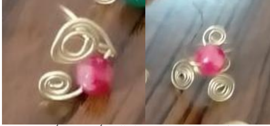
شكل (10) خاتمين من السلك الأصفر والأحجار