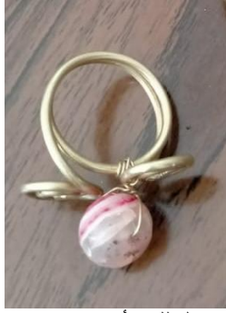
شكل (9) خاتم من السلك الأصفر مع حجر العقيق الأحمر