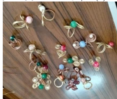
شكل (7) بعض الخواتم من نتاج ورشة العمل