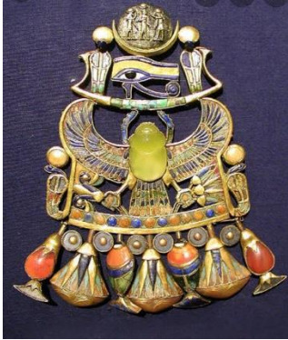
شكل (2) قلادة توت عنخ آمون

وقد عرف الإنسان الحلي منذ قديم الأزل، فكانت تستخدم في البداية كوسيلة للحماية، ومع مرور الوقت بدأ الاعتقاد في استخدامها في السحر وكانت على هيئة تمانم وتعاويذ. ومع مرور الزمن ونشأة الحضارات، تطورت الحلي بشكل كبير وتنوعت واختلقت حسب كل حضارة، فتميزت كل حضارة بمميزات وخصائص في مختلف الفنون وفي فن الحلي خاصة. وكانت الحلي المصرية القديمة من أهم الحضارات التي تميزت في فن الحلي، وكان لدى قدماء المصريين الكثير من الإبداعات والكنوز التي ما زالت تبهر العالم إلى الآن (5) .