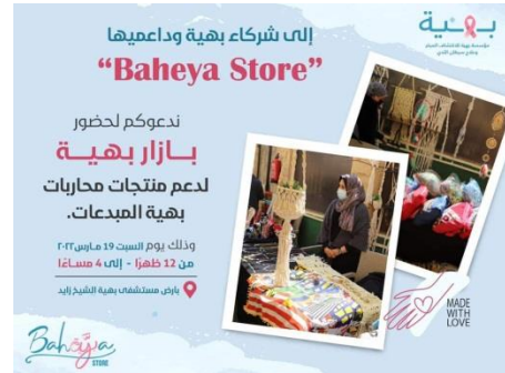
شكل (1) دعوة بازار مستشفى بهية لعلاج سرطان الثدي، عن منتجات تم عملها بواسطة محاربات السرطان (1)

المؤسسات العلاج بالفن والعمل اليدوي مثل الحلي كوسيلة فعالة ومؤثرة في الدعم النفسي لمرضى السرطان. مؤسسة كبيرة مثل مستشفى بهية بدأت في تنظيم الاحتفالات والمعارض لعرض منتجات المحاربات من مرضى السرطان بهدف مساندهم وتقديم الدعم النفسي لهم وتشجيعهم على التنفيس عن مشاعرهم عن طريق الفنون.