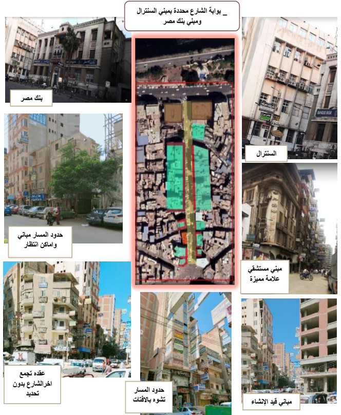
_ بوابة الشارع محددة بمبني السنترال ومبني بنك مصر

يقوم مقترح التطوير على الربط بين العناصر البصرية والاساليب التصميمية، لذلك تم وضع مقترحات للتطوير على النحو التالي: