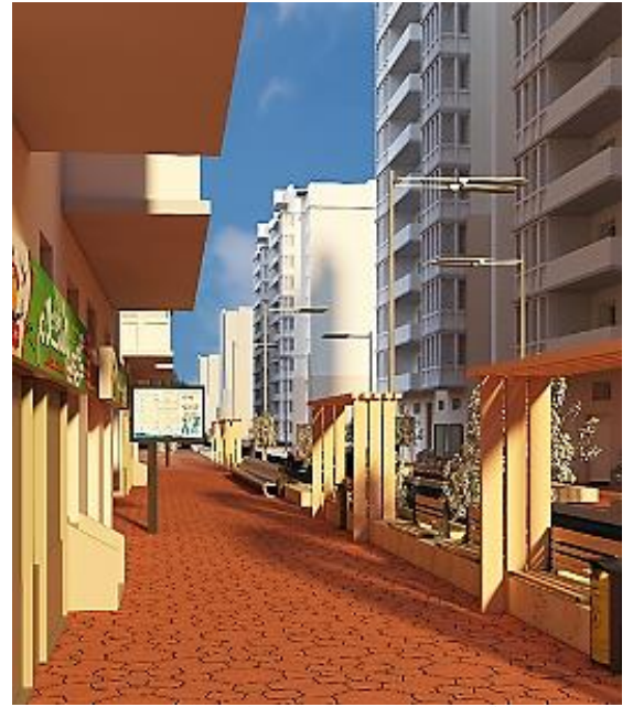
شكل 27 اماكن الانتظار والافتات الالكترونية الارشادية

يمكن تلخيص المقترح تحقيق مرونة بين العناصر البصرية واساليب التصميم تطوير شارع بنك مصر واثبات مدي امكانيه تحسين اداء المسارات العمرانية من خلال التوافق بينهم.