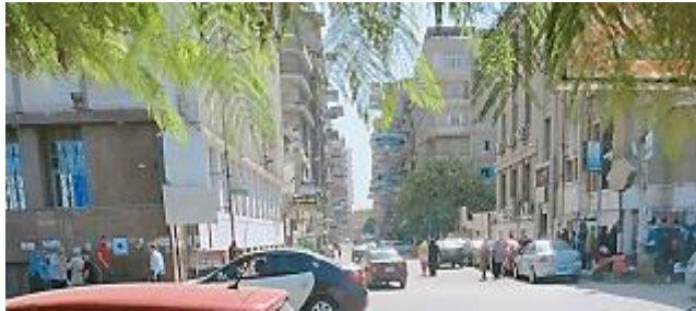
شكل 23 يوضح الانشطة الحركية والاستقرائية للشارع المصدر صور ميدانية للشارع

يوجد كثافة مرورية عالية لحركة السيارات في ساعات الذروة مع عدم وجود نظام أمني للتحكم في حركة السيارات، بالإضافة لأماكن انتظار السيارات الغير منظمة والتي تأخذ جزء كبير من مساحة الشارع.