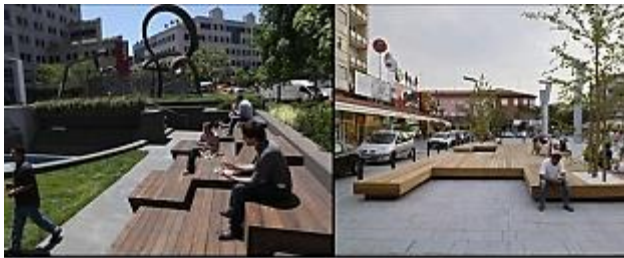
شكل 10 عناصر الفرش والتناغم مع المستخدمين

هي العناصر المكتملة لاستخدام المسار سواء عناصر طبيعية كالنباتات والعناصر المائية او عناصر صناعية كالمقاعد والمظلات والاكشاك والعلامات التذكارية والارشادية والاضاءة وغير ذلك.