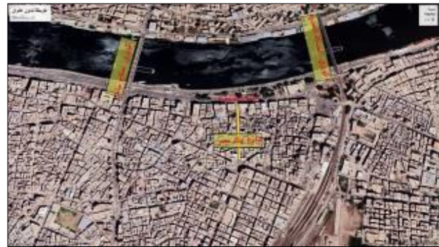
شكل 16 موقع شارع بنك مصر في قلب مدينة المنصورة