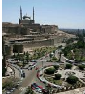
شكل 5 ميدان القلعة ونقط التقاء سواء للمستخدمين او للنقل (عقد)