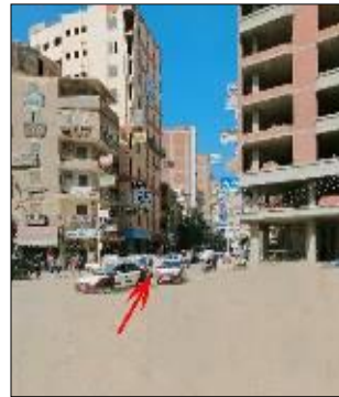
شكل 20 السماء هي التغطية للمسار المصدر صور ميدانية للشارع