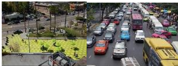
شكل 11 أنشطة الحركة و الجلوس والوقوف