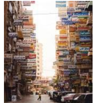
شكل 19 الحوائط المحددة للمسار مباني ولافتات