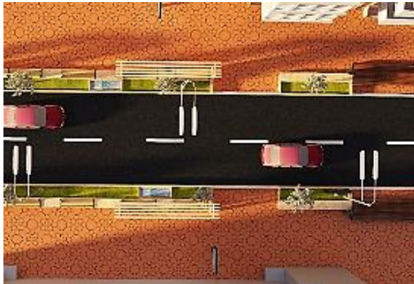
شكل 26 إعادة تشطيب وتشكيل الممرات بخامات ومواد متناسبة مع حركة المستخدمين والمرضى بحيث توفر لهم قدر كبير من الأمان والراحة

الحواط - إزالة المناسيب والدرجات ذات الارتفاعات المختلفة من أمام المحلات والتي تتعدى على حرم الرصيف، وجعلها مستوية وغير قابلة للانزلاق. الارضيات- إعادة إنشاء مسارات المشاة وتهينتها بعرض 5م على كل جانب من جوانب الطريق توحيد نوع تشطيب تخطيط الارضيات بأنواع انترلوك بالألوان والتشكيلات المناسبة مع تجديد الواجهات .