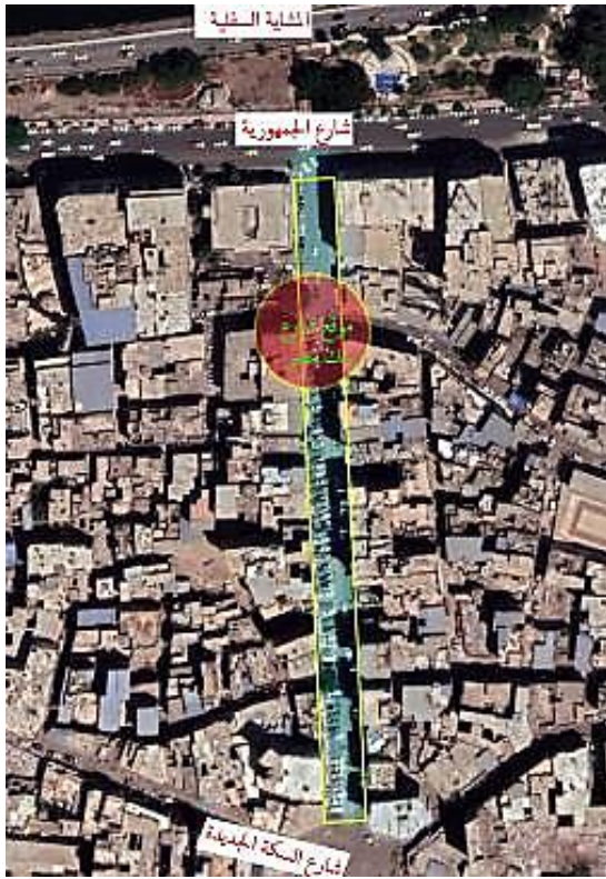
شكل 17 مسار شارع بنك مصر بين شارع الجمهورية وشارع السكة الجديدة