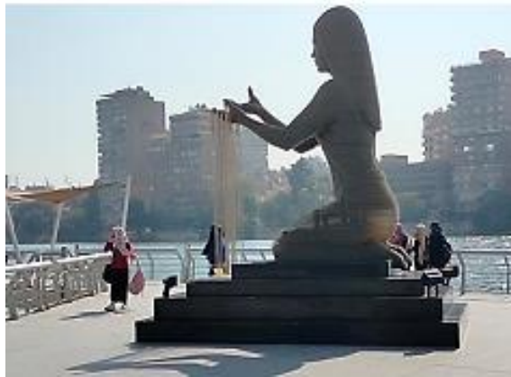
شكل 15 استخدام العلامات المميزة

https://www.elwatannews.com/news/details/5751043