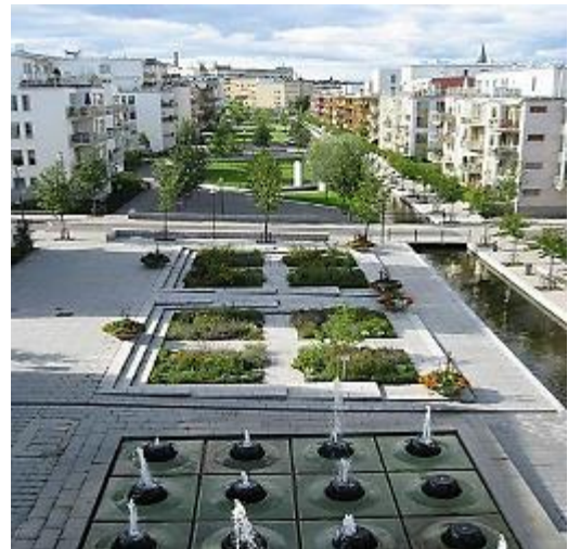
شكل 7 التحكم في التشكيل الرئيسي وتحديد شكل المسار

هي المستوي الرأسي الذي يتحكم في حجم وتشكيل المسار وتتعدد اشكاله وأبعاده من اسوار ومنشآت ومباني وعناصر نباتية واحواض زهور وعناصر مائية.