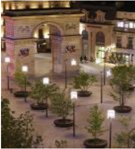
شكل 6 تحديد بداية المسار بوابات من اham العناصر التصميم البصري

هي الميادين والساحات العامة التي تنتج عند نهاية تقاطع المسارات سواء مسارات حركة مشاة او نقل آلي ثانوية كانت او رئيسية ، حيث يتم من خلالها التأكيد علي الخدمات التي يحتاج اليها المستخدمين [5].