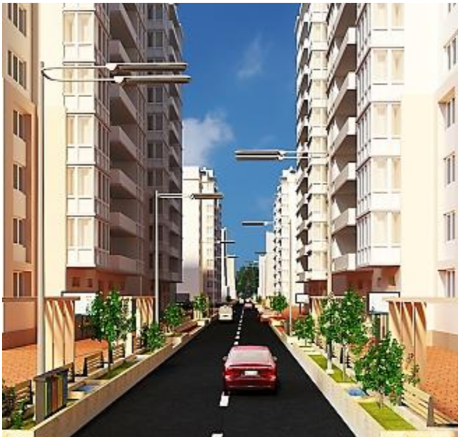
شكل 25 إزالة التعديلات والإضافات وتناسب الألوان وتعديل وتناسب أشكال الفتحات، وإضافة شاشات الكترونية في بداية المسار ونهاية لسهولة الوصول لجميع الخدمات المتاحة بالمسار.