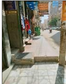
شكل 21 ارضية الرصيف وعدم الاستواء