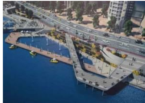
شكل 13 تطوير مسار اهل مصر