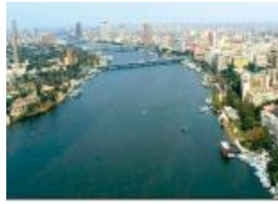
شكل 2 حدود طبيعية مثل نهر النيل