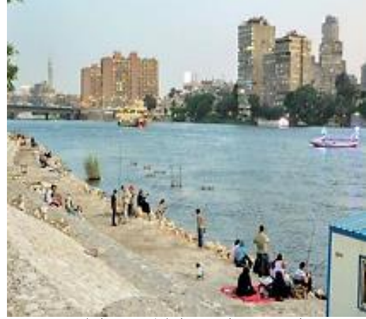
شكل 12 ممشاه اهل مصر قبل التطوير ومشاكل التنسيق العمراني https://gate.ahram.org.eg/daily/New

كان المسار يعني من الكثير من التعديلات علي نهر النيل وخلوه من عناصر التنسيق العمراني وقلة الاماكن الخضراء وعناصر الفرش ومحددات الفراغ ونقط العقد المميزة مما يجبر المشاة علي الجلوس بطرق عشوائية علي جوانب الطريق.