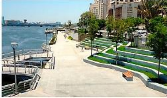
شكل 14 توفى مدرجات للمشاة ومساحات خضراء https://egy-map.com/project/ .

العقود: تحديد عقد وامكان للمشاة ومناطق تجمع متدرجة بطول ٤,٧ كم علي الكورنيش تنقسم إلى ٦٢ محلا و٥ كافيتيريات و٥ مطاعم، و٣ مدرجات سعة ١٢٤٠ فرداً، ومسرحا سعة ٧٧٢ فرداً، و٣ جراجات سعتها ١٨٠ تم استخدام تلك العناصر من خلال اساليب التصميم البصري للحوائط والارضيات والفرش بإضافة مقاعد للجلوس ونوافير مياه وبرجولات ومساحات خضراء تصل إلى ٢٣١٠٠م ٢ ، تحتوي على أكثر من ٢٣٥ شجرة و٦٢ نخلة البوابات: تحديد بوابات دخول بعناصر عمرانية للمشاة والسيارات. وامكان انتظار للسيارات .