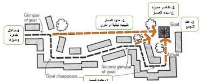
شكل 1 توضيح تسلسل عناصر الصورة البصرية المكتملة للمسار العمراني المصدر [4] تنسيق الباحثة

تنسيق وتسلسل عناصر الصورة البصرية للوصول لمسار عمراني متجانس يشكّل مكون رئيسي للنسيج العمراني للمدينة.