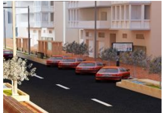
شكل 24 تنظيم حدود المسار وتحديد الانشطة بها.