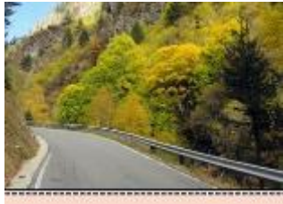
شكل 3 سور معدني حدود صناعية لغابة المزار بالأردن