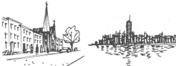
شكل 4 علامات مختلفة ومميزة للمسار Kevin Lynch

وجودها داخل المسار تعمل علي سهوله حركة المستخدمين وتوجيههم نحو مسار الحركة او نقط التجمع وتحديد معالم الطريق الي غير ذلك من المكونات التصميمية الهامة للمسار التي يمكن للعلامات المميزة التأكيد والأشارها اليها.