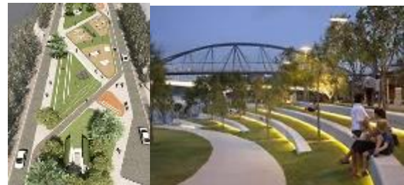
شكل 8 التنوع في تصميم ارضيات المسار

هي المستوي الافقي الذي تتم عليه جميع الانشطة داخل المسار والذي يختلف طبقا لنوع النشاط الارضيات المرصوفة للطرق او التبليطات للمشاة. وغير ذلك من دمج بين تلك الانواع المختلفة للأرضيات وبين عناصر الاضاءة وعناصر المياه لتنسق عمراي يخدم المستخدم ويحقق تناغم بصري.