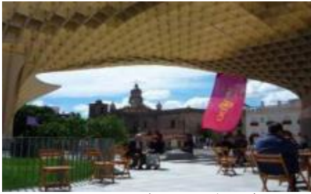
شكل 9 تغطيه اجزاء من المسار حسب الاستخدام

السماء هي السقف الخارجي للمسار في المعتاد ويمكن تحدي سقف المسار كليا او جزئيا للحماية او التشكيل.