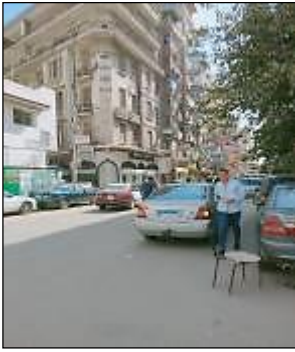
شكل 22 تغطي معظم ارضية المسار الاسفلت للسيارات