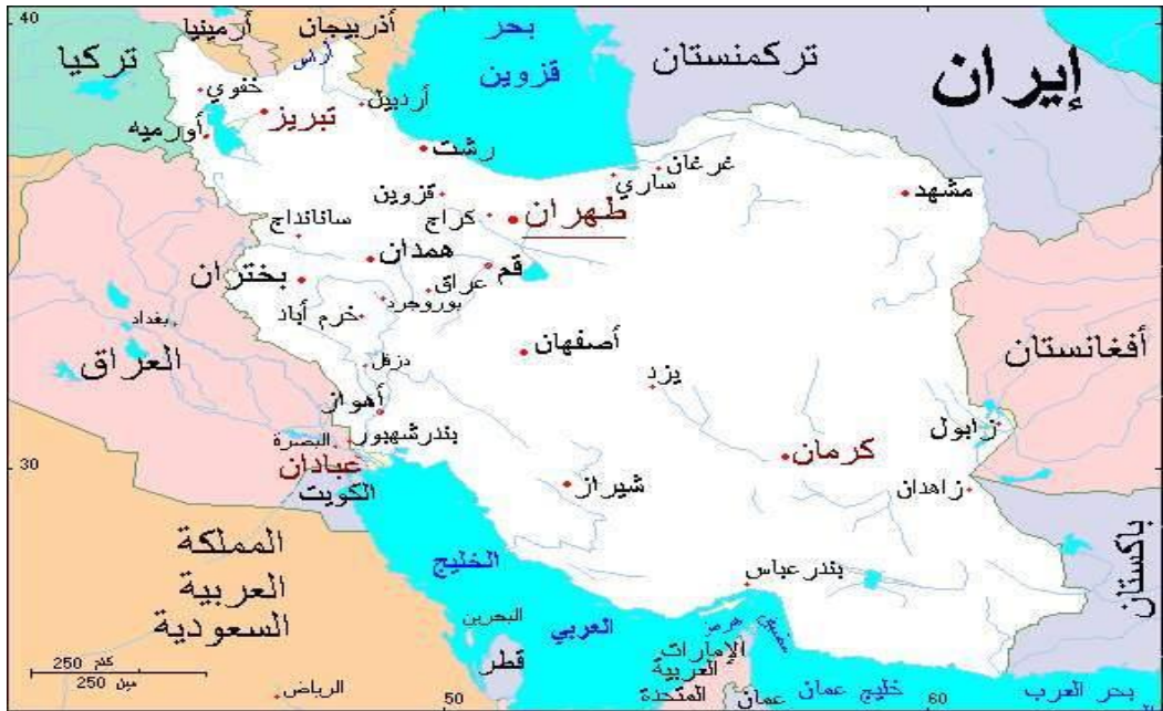
شكل (٨) موقع إيران