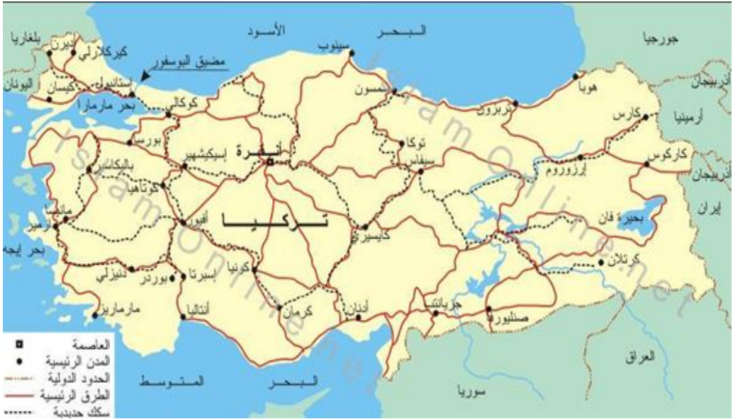
شكل (٧) موقع تركيا