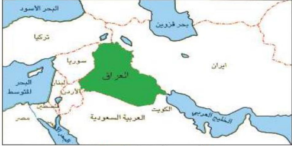
شكل(٤) العراق والمسطحات المائية

المصدر : من عمل الباحث بالاعتماد على خطاب صكار العاني، ونوري خليل البرازي (١٩٧٩) : جغرافية العراق، دار الكتب للطباعة والنشر، بغداد، العراق، ص ٤١