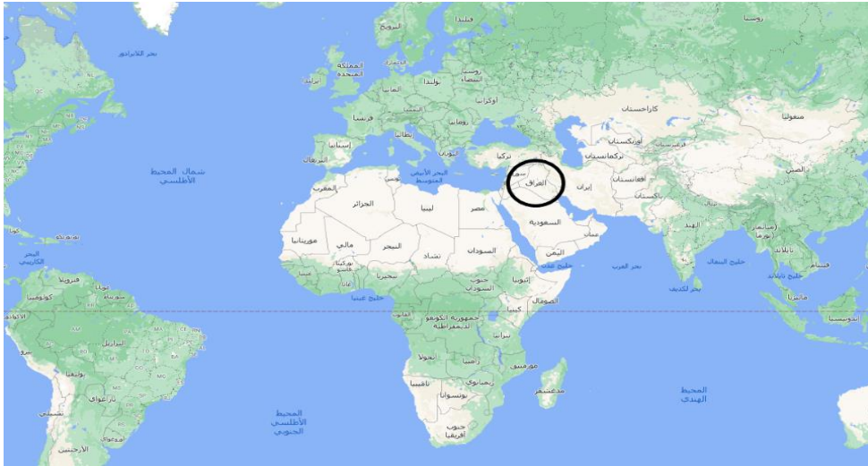
شكل (٢) الموقع الجغرافي العام للعراق بالنسبة للعالم