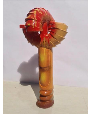
شكل رقم ( 7 ) من أعمال الباحث