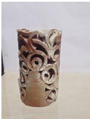
شكل رقم ( 2 ) من أعمال الباحث