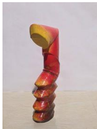
شكل رقم ( 1 ) من أعمال الباحث