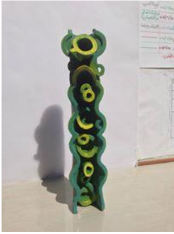
شكل رقم ( 6 ) من أعمال الباحث