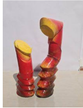
شكل رقم ( 5 ) من أعمال الباحث