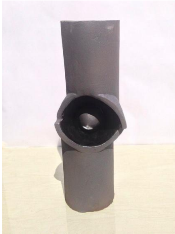
شكل رقم ( 8 ) من أعمال الباحث