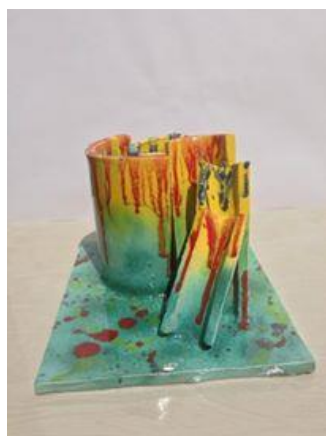
شكل رقم ( 3 ) من أعمال الباحث