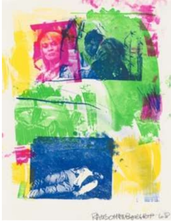
شكل (41) روبرت راوشنبرج _ Robert Rauschenberg _ Storyline I from the Reels _ (B+C) series _ طباعة ليثوجرافية ، طباعة من الشاشة الحرارية _ colour lithograph _ 54.6 × 43.3 سم _ 1968 _ معرض أستراليا الوطني ، كانبرا _ تم شراؤها عام 1973

وفي العمل الطباعي (Storyline I from the Reels (C+B) series) شكل (41) يعرض سلسلة تستحوذ اللقطات من الفيلم (الشهيد بوني وكلايد Bonnie) الذي أنتج عام 1967م، ويكشف افتتاح الفنان بالمشاهير وصناعة الترفيه بطريقة تعبيرية تصور الأحداث الثقافية والسياسية وأعمال الشغب في أمريكا وحرب فيتنام، حيث كان "راوشنبرج" فنانًا وناشطًا ماهرًا في توظيف الفن لرفع الوعي الفردي الاجتماعي للقضايا البيئية والسياسية" (1) .