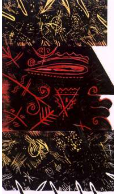
شكل (51) ثريا البقصي_ طباعة ملونة من سطح بارز ، غائر(معدن) _2003

"كما قامت الفنانة الأمريكية كارين كونك KAREN KUNC (1952_ ) بالعديد من التجارب للطباعة البارزة، تتبع مطبوعاتها من تأملها القوى للعالم الطبيعي، واللقاءات العابرة، وعدم القدرة على قياس الوقت والمسافة، يسجل أسلوبها الفريد في الطباعة عملية التطور والإبداع كما موضح بعملها (المرحلة التحول Phase_Shift) عام 2009م شكل(52) فقامت باستخدام (البوليمر الضوئي) (1) مع الطباعة البارزة من سطح خشب، كما قامت بالمزج بين الاسطح الطباعية من القوالب الطباعية البارزة والغائرة واستخدام الألوان المائية كما موضح بعملها Marais ( Edge ) 2018م بشكل(53)، وعمل (سحابة العاصفة Tempest Cloud) عام 2018م شكل (54)" (2) .