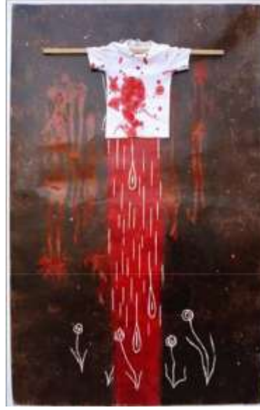
شكل (50) كاظم شمهود_ طباعة من سطح بارز خشب ، كولاج، ألوان غير طباعية_ 120×200 سم

وعمل الفنانة الكويتية ثريا البقصي (1951_ )، حيث تميزت أعمالها بالخيال الأسطوري، التنوع في استخدام الخامات كما موضح بشكل (51) طباعة بارزة وغائرة معاً، وقوالب متعددة" (1).