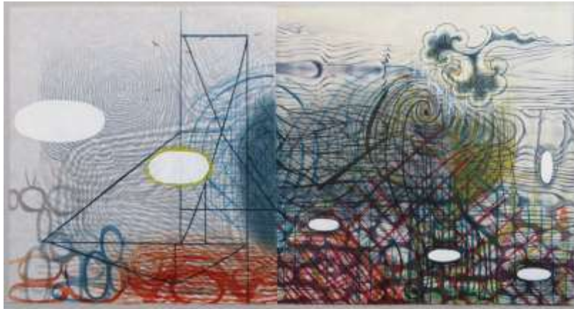
شكل (54) كارين كونك _ KAREN KUNC _ Tempest Cloud سحابة العاصفة _ طباعة بارزة، غائرة، ألوان مائية _ woodcut_ etching_ pochoir 2018_ watercolor 24×12 بوصة