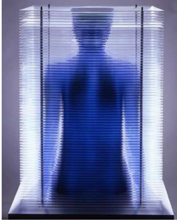
شكل (39) مارلين أوليفر Marilene Oliver _ المشع Radiant _ طباعة رقمية علي الاكريليك Inkjet print on acrylic _ 50×70×100سم _ 2005

حيث قام الفنانون المعاصرون بتبني تقنيات ومواد ووسائل عرض جديدة، وتنقلو بين أنماط وأشكال مختلفة من الفنون، بما يتناسب مع أفكارهم ولتصوير القضايا التي تهمهم فإن فن الجرافيك هو شكل من أشكال الفنون التي مرت بتغيرات مهمة وجذرية مع اتساع تعريفه ليشمل التكنولوجيا الرقمية (Digital technologies)، والتصوير الفوتوغرافي (photography) والوسائط المختلطة (mixed media) وغيرها، ولقد كان هناك الكثير من الفنانين الذين تحددوا التصور العام لفن الجرافيك، من خلال استكشاف تقنيات ومواد وطرق عرض جديدة والتي لا يمكن التنبؤ بها باستعمال هذا الفن، وبالخروج عن كل ما هو تقليدي أو متعارف عليه فلا نعلم ما قد يصل إليه هذا الفن في المستقبل، مع استمرار الفنانين بتحدي الأفكار المسبقة وإيجاد طرق مبتكرة لتنفيذ وعرض أعمالهم باستخدام فن الجرافيك بما يخدم أغراضهم (1) .