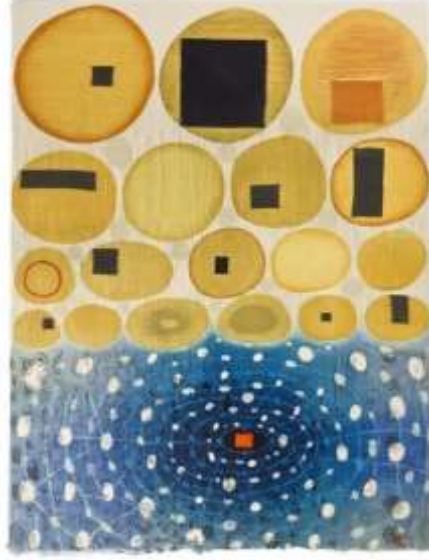
شكل (52) كارين كونك KAREN KUNC _ Phase_Shift _ طباعة بارزة، بوليمر ضوئي Woodcut photo_polymer relief _ 80.8×65.7 سم_ 2009