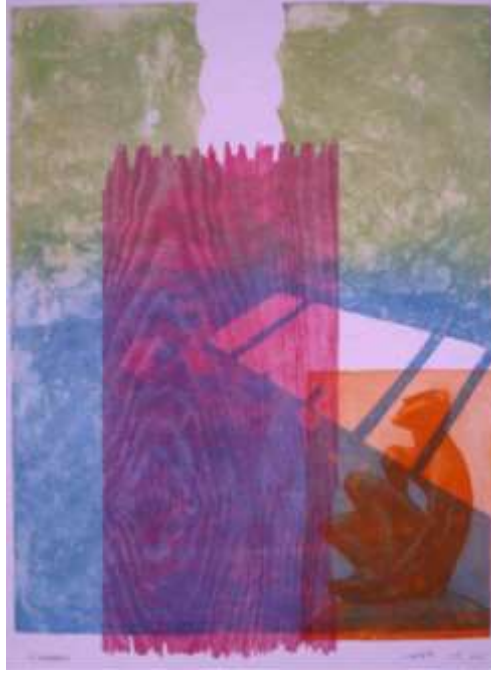
شكل (48) كاظم شمهود_ طباعة ملونة من سطح بارز (خشب)، غائر (زنك) _ من قوالب متعددة.