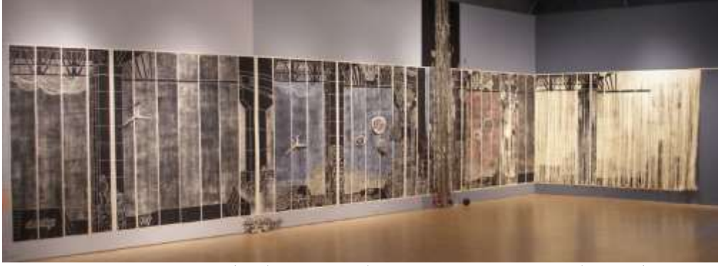
شكل (36) ليبي هيغ Libby Hague _ كل شيء يحتاج إلي كل شيء Everything needs everything _ عرض لعمل مركب بالحفر والطباعة البارزة بواسطة الخشب علي ورق أوكا الياباني_ جامعة مونت سانت فنمست للفنون بكندا_ 6×54 قدم_ 2006