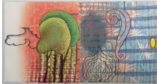
شكل (53) كارين كونك KAREN KUNC _ Marais Edge _ طباعة بارزة، غائرة، ألوان مائية woodcut_ etching_ pochoir_ 24×12 بوصة_ 2018 watercolor