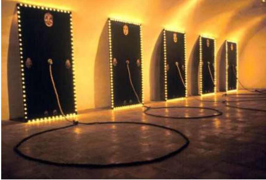
شكل (34) بلقيس راميريز Belkis ramirez _للبيع En Oferta_ عمل مركب مستند علي قوالب الخشب الطباعية البارزة وتلوينها_ إضافة احبال _ 1996

ظهر ذلك في أعمال الفنانة الدومنيكية بلقيس راميريز Belkis ramirez (1957) والتي استخدمت تقنيات فن الجرافيك الحديثة في معظم أعمالها إما بالطباعة علي المواد المختلفة أو بإستخدام القالب الطباعي كعمل فني في حد ذاته كما مضح في عملها (للبيع En Oferta) عام 1996م فكانت الألواح في هذا العمل عبارة عن حفر علي الخشب حيث كانت تقوم بتصوير وجه وأيدي وقدم المرأة علي كل لوح وبدون ظهور أي تفاصيل للجسد، ويخرج من منطقة السرة حبل يمتد نحو الأرض كرمز لهجر الأجداد شكل(34).