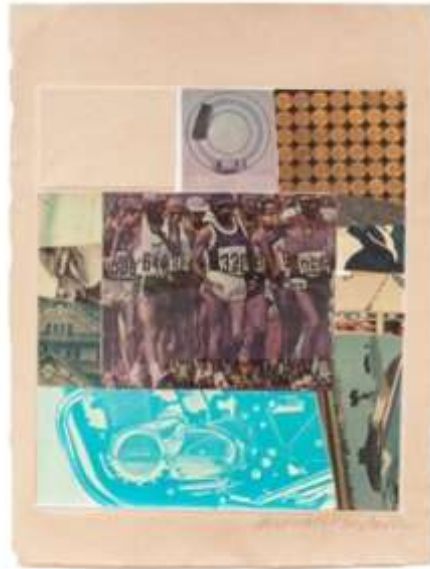
شكل (40) روبرت راوشنبرج Robert Rauschenberg _ ريش الحصان الثلاث عشر Thirteen-VIII Horsefeathers _ طباعة ليثوجرافية (أوفست) من ثمان ألوان مع طباعة من الشاشة الحريرية والكولاج والطباعة بالضغط مع عناصر مجمعة _ 44,77 x 60.96سم_1972_ National Gallery of Australia_Canberra معرض أستراليا الوطني، كانبرا

تعد سلسلة راوشنبرج الثلاث عشر المعروفة باسم (ريش الحصان الثلاث عشر Horsefeathers thirteen) هي خير مثال لموهبة الفنان الفطرية في بناء تركيبات معقدة تمزج البيئة الطبيعية مع البيئة المصنعة، فكل صورة فيها حالة وكأنها تستعد للحظة الديناميكية الغير مستقرة التي يتزامن فيها الحركة مع التشويق، كما لا يوجد تسلسل هرمي لصور المجموعة بل تمثل تجربة بصرية لخبرة الفنان حيث قدمها في ترتيب عشوائي نابع من ذكريات الفنان ومشاهداته اليومية، فكل ما اختاره الفنان من صور وعناصر لإدراجها ضمن أعماله الفنية لا تأتي صدفة، بل هي عناصر ترتبط ارتباطاً وثيقاً بالحياة الاجتماعية الأمريكية والأحداث والقضايا السياسية في الفترة التي أنتج فيها العمل شكل (40).