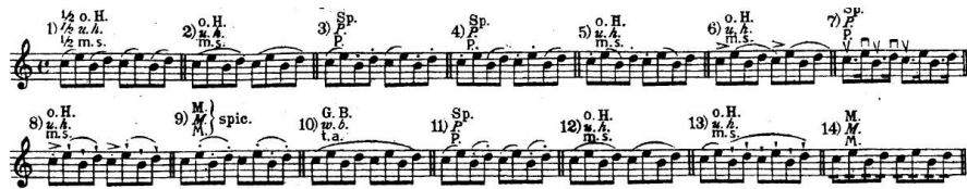
أشكال القوس للتمرين الأول

١. تمرين ١ و ٢ التدريب علي أداء مسافة الثالثة الميلودية والأربيجات في ميزان (٤/٤) والتأكيد علي الأداء بالإصبع الرابع في تمرين رقم (١) والرابع المنخفض والإصبع الثالث الممدود مد أمامي في تمرين رقم (٢) وتثبيت الأصبع الأول في التمرين الأول في مازورة (١،٢ - ٩،١٠ - ١٣،١٤ ) والتمرين الثاني (١،٢ - ٥،٦) ووضع أشكال متعددة (١٤) شكل قوس في التمرين الأول و (٥) أشكال قوس في التمرين الثاني تتنوع أشكال القوس فيهما بين المتصل والمنقطع .