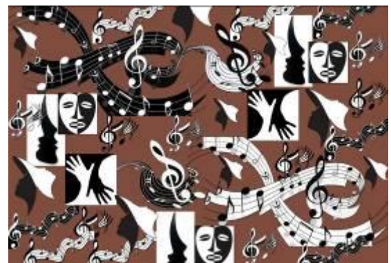
تصميم رقم (2) والأفكار والنماذج التوظيفية المقترحة