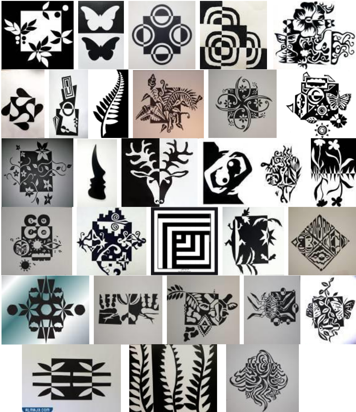
شكل (2) يوضح مجموعة من تصاميم النوتان

واتسمت القيم اللونية لفن النوتان في أعمال ويسلي بالتفرد في توظيف التباين الذي يُحدث تناغم مميز نتيجة لاختلاف درجة الألوان عندما توضع متجاورة، حيث يتسبب ذلك في جعلها تظهر بدرجة دكانة مختلفة بالزيادة أو النقص عن لونها الطبيعي (22) .