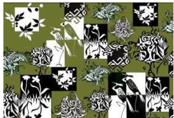
تصميم رقم (8) والأفكار والنماذج التوظيفية المقترحة