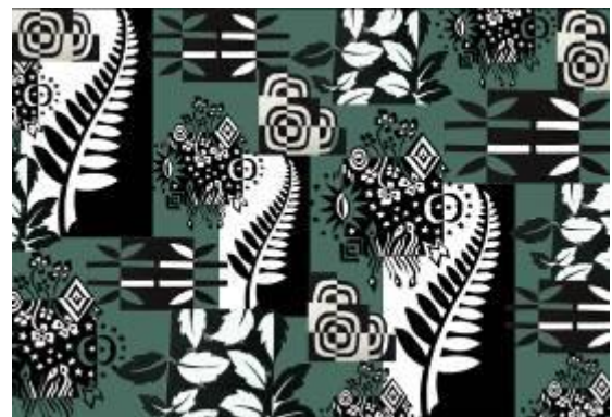
تصميم رقم (7) والأفكار والنماذج التوظيفية المقترحة