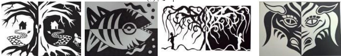
شكل (3) يوضح أسلوب التماثل / التناظر لرسم النوتان (11)