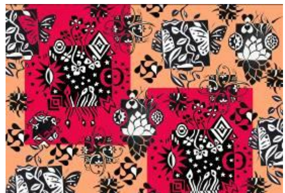
تصميم رقم (4) والأفكار والنماذج التوظيفية المقترحة