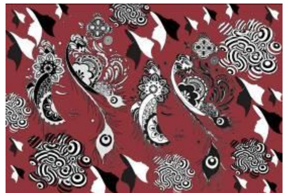
نصميم رقم (3) والأفكار والنماذج التوظيفية المقترحة