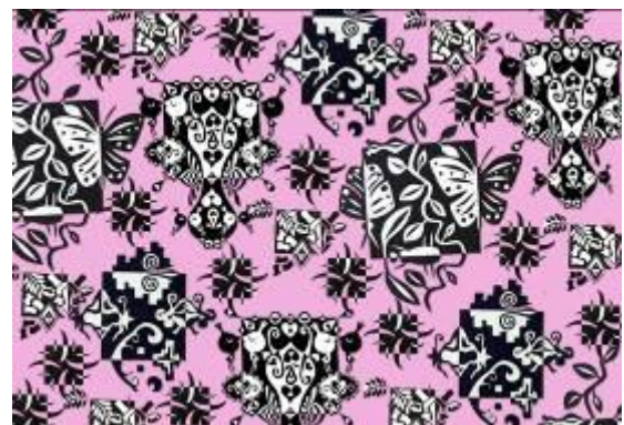
نصميم رقم (6) والأفكار والنماذج التوظيفية المقترحة