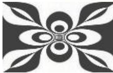
فن النوتان (21)

شكل (7) يوضح الفرق بين النوتان والخداع البصري