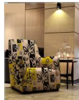
تصميم رقم (1) والأفكار والنماذج التوظيفية المقترحة