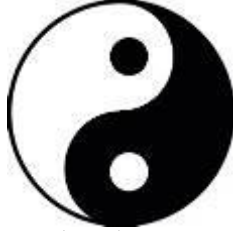
شكل (1) يوضح رمز الين واليانغ فكرة النوتان

نشأ النوتان في القرن السابع الميلادي في الصين واليابان ومورس لقرون عديدة وكان يشير إلى تدرج قيمة اللون. أراد داو Dow نقل جماليات التصميم الياباني بكل ما فيه من تدرج لقيمة اللون والحصول على قيمتين لونيتين (الأبيض والأسود) حتي يؤكد للجميع المبدأ الأساسي للنوتان وهو تفاعل الضوء والظلام والإيجابية والسلبية بشكل متوازن أطلق عليه فيما بعد بنية النوتان (17-ص 74) . ومن أكثر الرموز المألوفة التي توضح مفهوم النوتان هو شكل الين واليانغ الدائري من الفلسفة الشرقية، الصورة المستديرة ذات الأشكال المترابطة التي تشبه الدفعة، واحدة بيضاء والأخرى سوداء (18) . كما هو موضح في الشكل رقم (1).