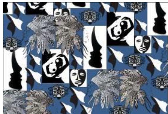
نصميم رقم (5) والأفكار والنماذج التوظيفية المقترحة