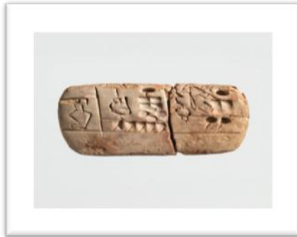
(شكل رقم ١) نص إداري

وبجانب هذه الأشكال الاعتيادية الشائعة من الألواح الطينية، كان هناك أشكالاً أخرى استخدمت لعدة أغراض (٥) ، كالشكل الدائري الذي كان يُستخدم في صناعة الكتب المدرسية، والخرائط، والعقود الخاصة بالأراضي، والشكل البيضاوي والمخروطي، الذي كان يستخدم فوق صواري السفن (٦) ، كما استخدمت الألواح الطينية المخروطية؛ لتدوين كتابات مسمارية متعلقة باسم الملك وألقابه، وإنجازاته ثم تطورت وأصبحت بعد ذلك تشبه نبات الفطر (٧) ، بينما الشكل الكروي كان يستخدم للتعليق (٨) ، والشكل الزيتوني كان يستخدم كأحجية وتمائم وتعاويذ (٩) ، أما الشكل المثلث كان يستخدم: إما تعاويذ، أو كبطاقات تعريفية (١٠) . بينما الألواح الطينية البرميلية، أو الأسطوانية كان يستخدمها السومريون، ومن بعدهم البابليون؛ لتدوين النقوش التذكارية والتاريخية.