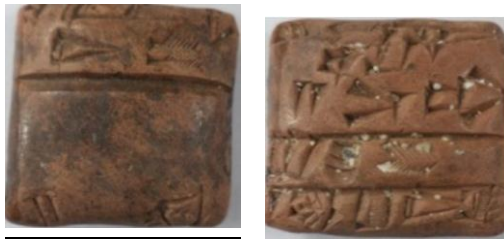
(شكل رقم ٦)

https://www.schoyencollection.com/music-notation/sumerian-music/earliest-music-record-ms-2340