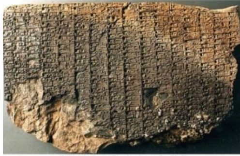
(شكل رقم ٥)