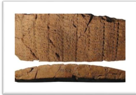
(شكل رقم ٢) كسرة من قائمة معجمية

وفي المخاريط يصل أكبر قطر للجهة العريضة (قطر ١) في مخاريط عينة الدراسة في (جدول رقم ٣) إلى ٦.٢ سم؛ لتخليد ذكرى إنجازات الملك سين كاشيد وأقل قطر للجهة العريضة (قطر ١) هي ٤ سم لمخروط يمثل ذكرى استعادة معبد إينو، وأكبر قطر للجهة الرفيعة (قطر ٢) ٥.٨ سم لمخروط يمثل ذكرى بناء معبد نانشة من العصر السومري الحديث، وأقل قطر للجهة الرفيعة (قطر ٢) هي ٣.٣ سم يرجع أيضاً لمخروط ذكرى إنجازات الملك سين كاشيد.