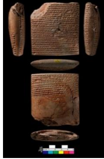
(شكل رقم ٨)

والأدباء، والشعراء المسؤولين عن المحتوى الفكري ، فغالباً ما يندر كتابة أسمائهم على المحتوى الفكري العراقي القديم.(٣٨)