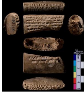
(شكل رقم ٧) تقرير فلكي

ومن نماذجها التي اشتملت على بعض المعلومات البسيطة، تقرير فلكي لكوكب المشتري اشتمل حرد المتن الخاص به على اسم الكاتب واسم والده "تاب-سيلي[مردوخ] ابن بيل أوبا هير" (شكل رقم ٧). (٣٣)