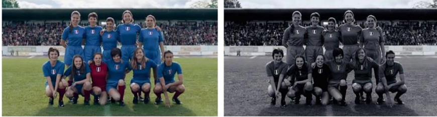
Dernières images du film

Ce passage vers le noir et blanc constitue un rappel vers la réalité historique.