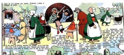
Bécassine nourrice (l'album, 1922)