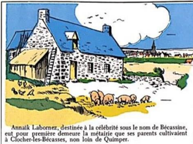
Annak Labornez, destinée à la célébrité sous le nom de Bécassine, eut pour première demeure la métairie que ses parents cultivaient à Clocher-les-Béccasses, non loin de Quimper.