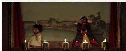
Bécassine! (le film 2018)

« À guignol, ça n'est pas des grandes pièces comme celle où Hilarion aimerait jouer, mais c'est gai, c'est facile à comprendre, c'est tout à fait un genre de ...théâtre à ma convenance » (Caumery, Bécassine , L'Intégrale : Livre I, pl.222)