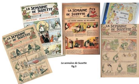
La semaine de Suzette fig.3

Le film Bécassine ! fait renaître à l'écran, le premier personnage féminin à succès dans une bande dessinée française. Les aventures de la petite fille bretonne « Bécassine » étaient publiées dans La semaine de Suzette , journal pour les petites filles, édité chez Gautier Languereau (1867 - 1941).