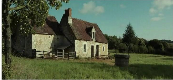
Bécassine le film (2018)

Nous sommes censés être dans le village où est née l'héroïne. Tous les personnages de la bande dessinée gardent leurs identités : nom propre, caractère et rôle.