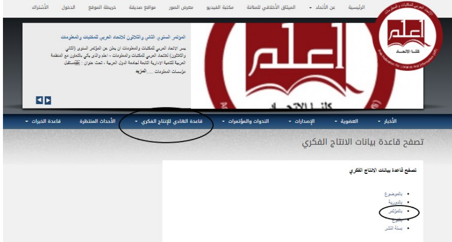
شكل (٣) واجهة قاعدة الهادي

المنظومة بعض مؤتمرات جمعيات المكتبات العربية مثل الجمعية المصرية للمكتبات و المعاومات (3) ، المؤتمر الإقليمي للافلا (1) ، الجمعية السعودية للمكتبات والمعلومات (1)، جمعية المكتبات المتخصصة ، فرع الخليج (٣) ، كما غطت مؤتمرات وندوات المنظمة العربية للتنمية الادارية (5)، بالإضافة إلى بعض المؤتمرات لهيئات أخرى.