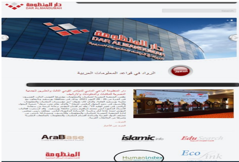
شكل ( ١ ) واجهة قاعدة دارالمنظومة

٤- بحوث مؤتمرات المكتبات والمعلومات في قواعد البيانات العربية تم اختيار ثلاث قواعد بيانات عربية لوصف وتحليل واقع بحوث المؤتمرات في مجال المكتبات والمعلومات بغرض تناول التمثيل الموضوعي بصورة أكثر تفصيلا. والقواعد هي: دار المنظومة ، قاعدة معرفة ، قاعدة الهادي. وقد تم اختيار هذه القواعد لأنها خصصت قواعد لبحوث المؤتمرات في المجال أو أتاحت إمكانية تصفحها مستقلة عن باقي مصادر المعلومات .