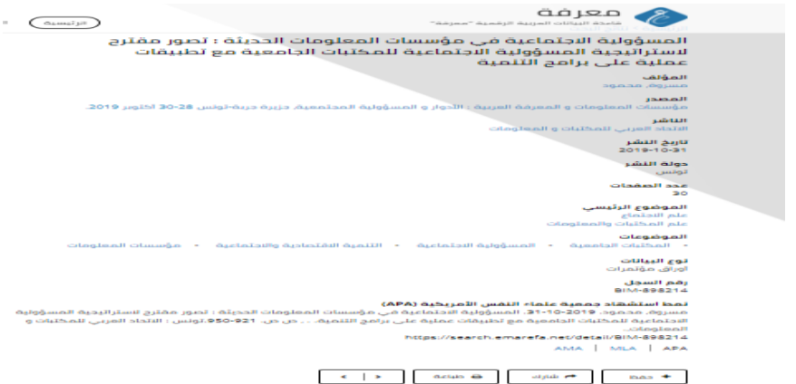
الشكل رقم (٥) شاشة عرض البيانات المفصلة لأوراق المؤتمرات في معرفة