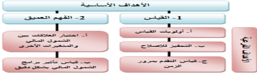
شكل رقم (2) نموذج أهداف قياس التمول المالي

وحدد (Chattopadhyay, 2011) ثلاثة أبعاد أساسية لنظام مالي شامل تمثلت في الاختراق المصرفي وتوافر الخدمات المصرفية واستخدام النظام المصرفي، وأبيده في ذلك (Sasidaran & Ramkishen, 2018). واطاف (Arora, 2010) إلى المؤشر ثلاثي الأبعاد الذي سبق أن قدمته وطورته Sarma بعدين آخرين متمثلين في بعد السهولة ويعني الوقت المستغرق في إتمام المعاملات المالية، والذي يعكس مدى تعقد الاجراءات وكثرة المستندات المطلوبة لذلك. وبعد التكلفة ويعني تكلفة الخدمات المالية ذاتها باعتبارها تكلفة مباشرة وكذلك تكلفة الوصول إلى مكان الحصول على الخدمات المالية باعتبارها تكلفة غير مباشرة. وأشار إلى ضرورة مراعاة المتغيرات الحضرية/الريفية للأفراد، ونوع متلقي الخدمات المالية والأفراد ذوي الاعاقة كنفات في حاجة ماسة إلى الشمول المالي. واتفق معهم (Gupte, et al., 2012) من حيث الأبعاد الأربعة المتمثلة في التواصل (الاختراق وامكانية الوصول) والاستخدام وسهولة المعاملات وتكلفة المعاملات. واتفق معهم (Cámara & Tuesta, 2014) من حيث بعدي الوصول إلى الخدمات المالية الرسمية واستخدامها واطاف بعد عوائق الوصول والاستخدام، واطاف أن مؤشرات قياس الوصول المالي التقليدية غير وافية نظراً للتطورات التكنولوجية المتلاحقة في الوصول والاستخدام للخدمات المالية عبر الانترنت والهاتف المحمول والمراسلات المصرفية للتغلب على بعد المسافات الجغرافية. كما ارتكز المؤشر الذي قدمه (Mialou, et al., 2017) على بعدي انتشار واستخدام الخدمات المالية الرسمية فحسب. واعتمد (Sonja, 2016) على ثلاثة أبعاد تمثلت في بعد