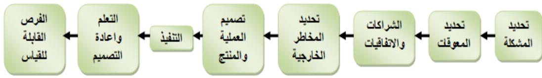
شكل رقم (3) نموذج "Victoria" الخطي لتصميم إستراتيجية الشمول المالي

المناطق الريفية، ولكن يظل تعزيز الشمول المالي في المدى البعيد لتلك الفئة تحتاج إلى محور الأمية المالية وترسيخ المعرفة المالية لديهم بشأن كيفية استخدام الخدمات المصرفية والمنتجات المالية المتنوعة. كما قدم البحث نموذجاً خطياً صمم من خلاله إستراتيجية للشمول المالي تهدف إلى دعم أصحاب المشروعات الصغيرة المتخصصة في تربية الأحياء المائية كما يوضحها شكل رقم (٣).