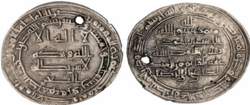
لوحة (١) درهم فضي من العصر العباسي (١٣٢-٦٥٦هـ) باسم الحسين بن احمد ضرب قزوين - الثغر-، سنة ٢٥٣هـ، يبلغ وزنه ٢.٧٦ جرام، محفوظ بسلوفاكيا