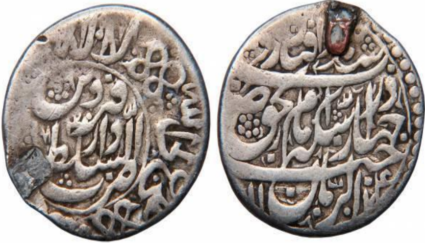
لوحة (٨) عباسي من الفضة عهد كريم خان الزندي (١١٦٣-١١٩٣هـ)، ضرب دار السلطنة قزوین، ويحمل تاريخ سكه سنة ١١٧٤هـ، يبلغ وزنه ٤.٣٥ جرام، وفطره ٢٣ ملم نقلا عن /

https://www.zeno.ru/data/4037/medium/IMG_14301.jpg