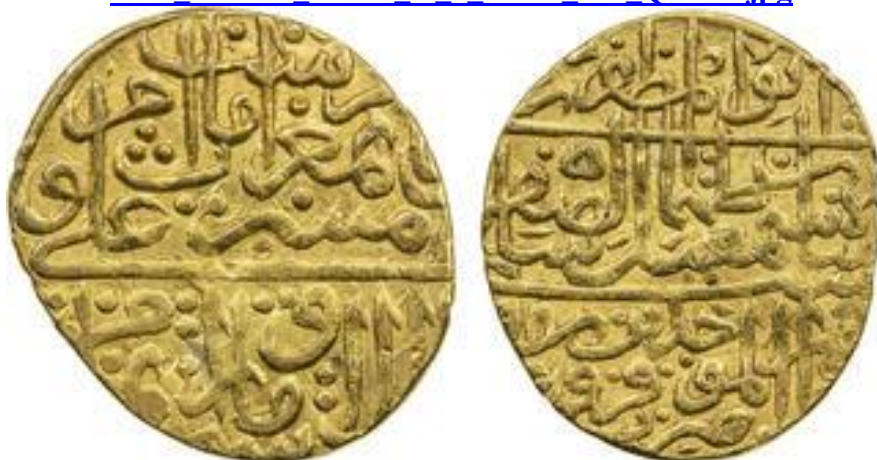
لوحة (٥) نصف مثقال ذهب من عهد اسماعيل شاه الصفوي ضرب دار الموحدين قزوین سنة ٩٨٥ هـ