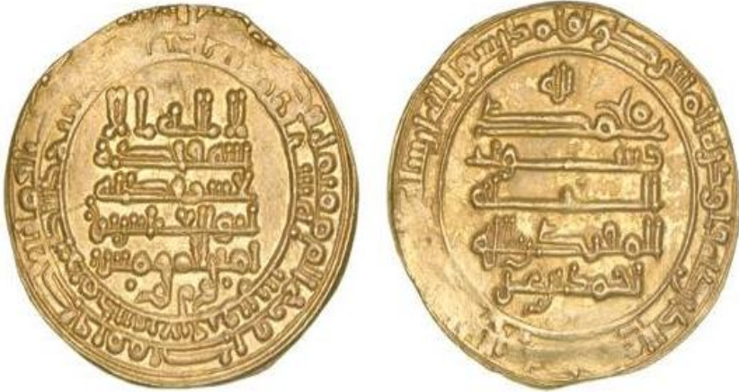
لوحة (٢) دينار من الذهب من عهد الخليفة المقتدر بالله العباسي (٢٩٥-٣٩١هـ)، ضرب بمدينة ثغر قزوین، سنة ٥٣٠٦هـ، يبلغ وزنه ٤.١٧ جرام