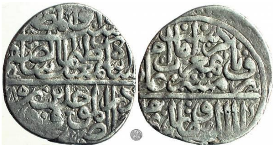
لوحة (٤) نقد فضي فئة ٢ شاهي من عهد الشاه اسماعيل الثاني الصفوي ، ضرب قزوین " دار الموحدين " مؤرخ ب ٩٨٥ هـ