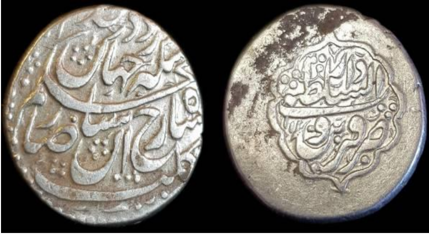
لوحة (٦) روبية فضية من عهد شاه رخ الأفشاري-فترة حكمه الاولي- (١١٦١-١١٦٣هـ) ضرب قزوین ، وتحمل تاريخ السك سنة ١١٦١هـ ، يبلغ وزنها ١١ جرام ، محفوظة بايران ، نقلًا عن /

https://www.zeno.ru/data/4682/medium/PicsArt_11-22-06_43_34.jpg