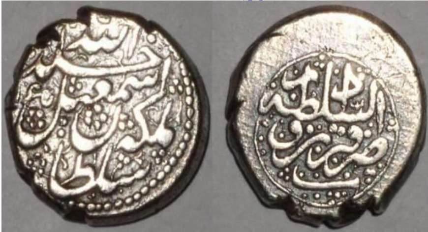
لوحة (٧) روبية فضية تحمل اسم الشاه إسماعيل الثالث (١١٦٣-١١٦٩هـ) ، ضرب دار السلطنة قزوین ، وتاريخ السك سنة ١١٦٥هـ ، يبلغ وزنها ١١.٤٧ جرام ، وقطرها ٢٠م ، محفوظة بمسكو نقلًا عن /

https://www.zeno.ru/data/4682/medium/PicsArt_11-22-06_43_34.jpg