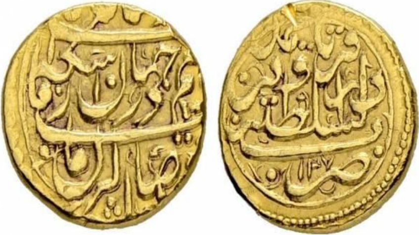
لوحة (٩) نصف تومان من الذهب من عهد اغا محمد خان القاجاري (١١٩٣-١٢١١هـ)، ضرب دار السلطنة قزوین، ويحمل تاريخ سكه سنة ١٢٠٧هـ، يبلغ وزنه ٤.٣ جرام، محفوظ بالولايات المتحدة الامريكية نقلا عن /

https://www.zeno.ru/data/4037/medium/IMG_14301.jpg