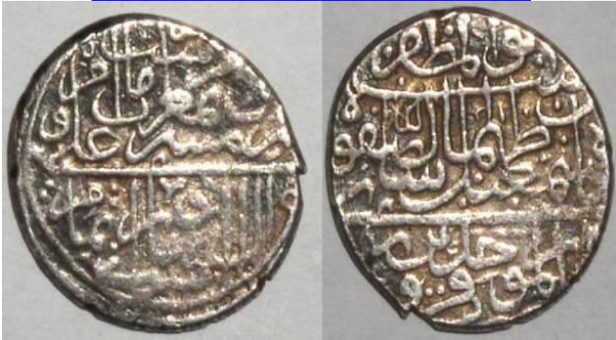
لوحة (٣) نقد فضي فنة ٢ شاهي من عهد الشاه اسماعيل الثاني الصفوي (٩٨٤-٩٨٥هـ)، ضرب دار الموحدين قزوین، ومؤرخ بسنة ٩٨٤هـ، يبلغ وزنه ٤.٤ جرام، وقطره ٢٠مم، محفوظ بموسكو نقلا عن /

https://www.zeno.ru/data/21632/11371291.jpg