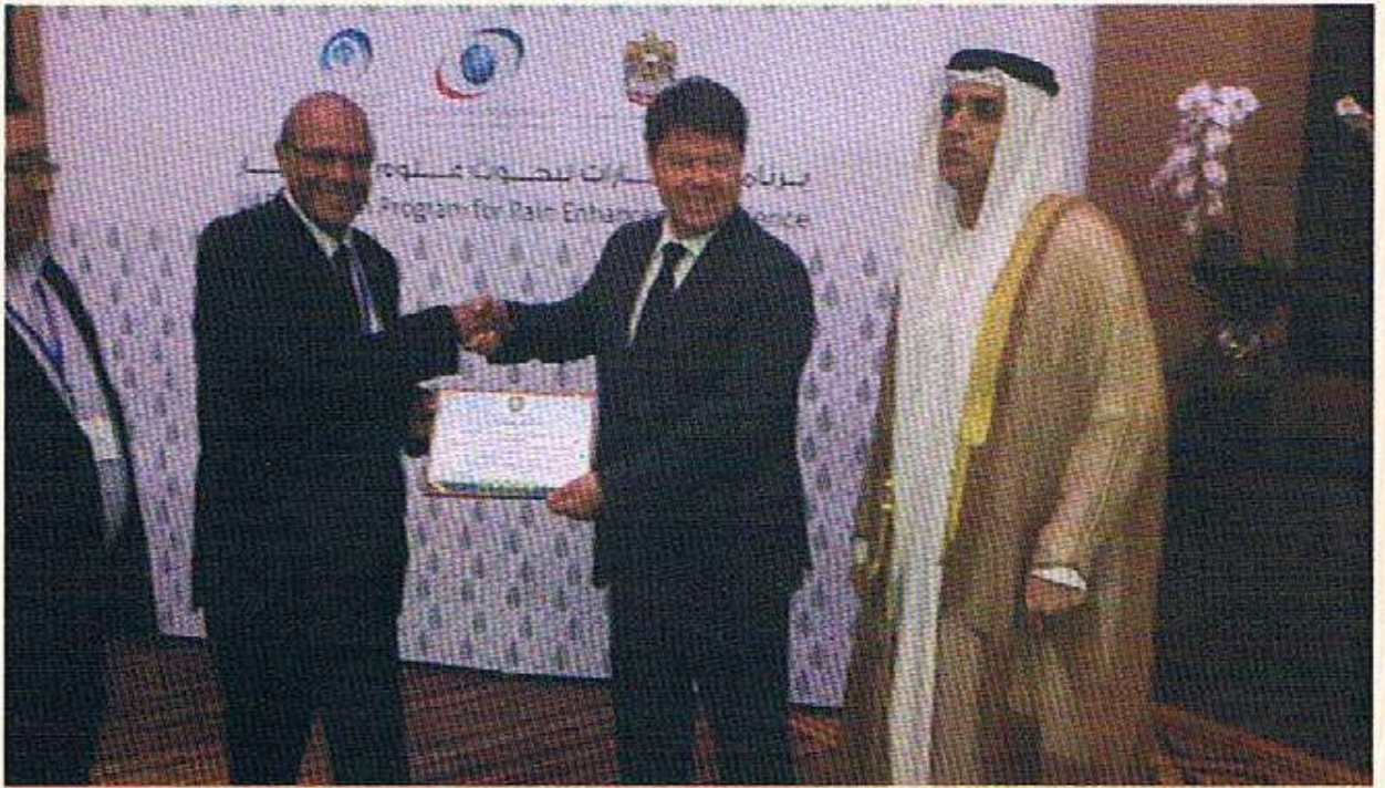
لقاء يجمع بين الأمين العام للمنظمة العالمية للأرصاد الجوية ورئيس اللجنة العربية الدائمة للأرصاد الجوية ود / أحمد عبدالعال رئيس الهيئة