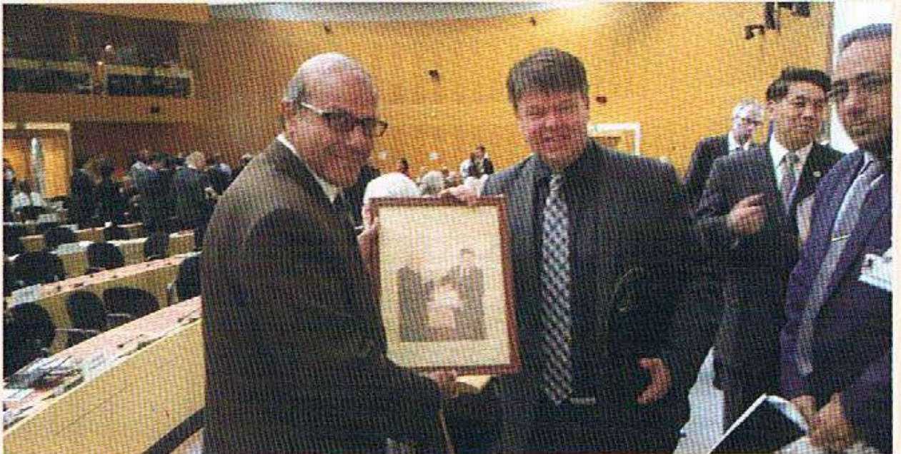
مع السيد بترى تالاس - السكرتير العام للمنظمة العالمية للأرصاد الجوية