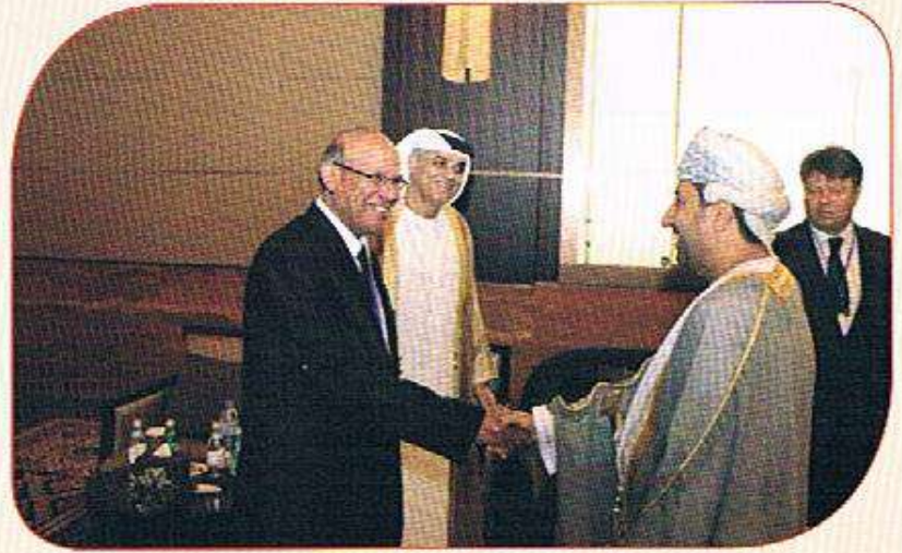
لقاء بين الدكتور أحمد عبدالعال ورئيس سلطة الطيران المدني بعمان ورئيس اللجنة الدائمة للأرصاء الجوية والأمين العام للمنظمة العالمية للأرصاء