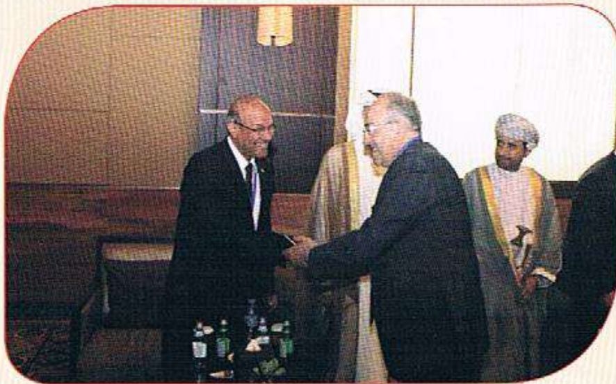
لقاء بين الدكتور أحمد عبدالعال وسفير تونس بالاتارات