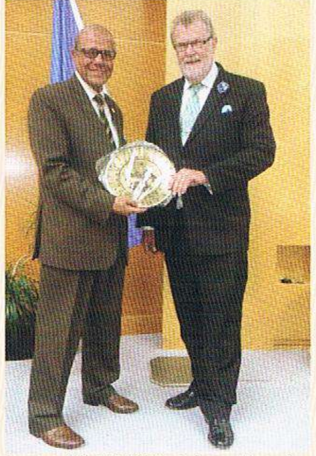
مع السيد دايفيد جريمز - رئيس للمنظمة العالمية للأرصاد الجوية