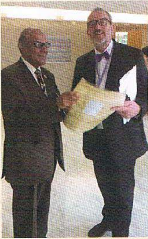
مع النائب الثاني لرئيس المنظمة العالمية للأرصاد الجوية