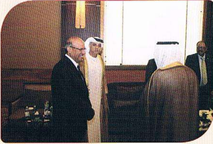
لقاء يجمع بين السيد عبدالله المندوس رئيس اللجنة العربية الدائمة للأرصاء الجوية وثانيه الدكتور أحمد عبدالعال رئيس الهيئة