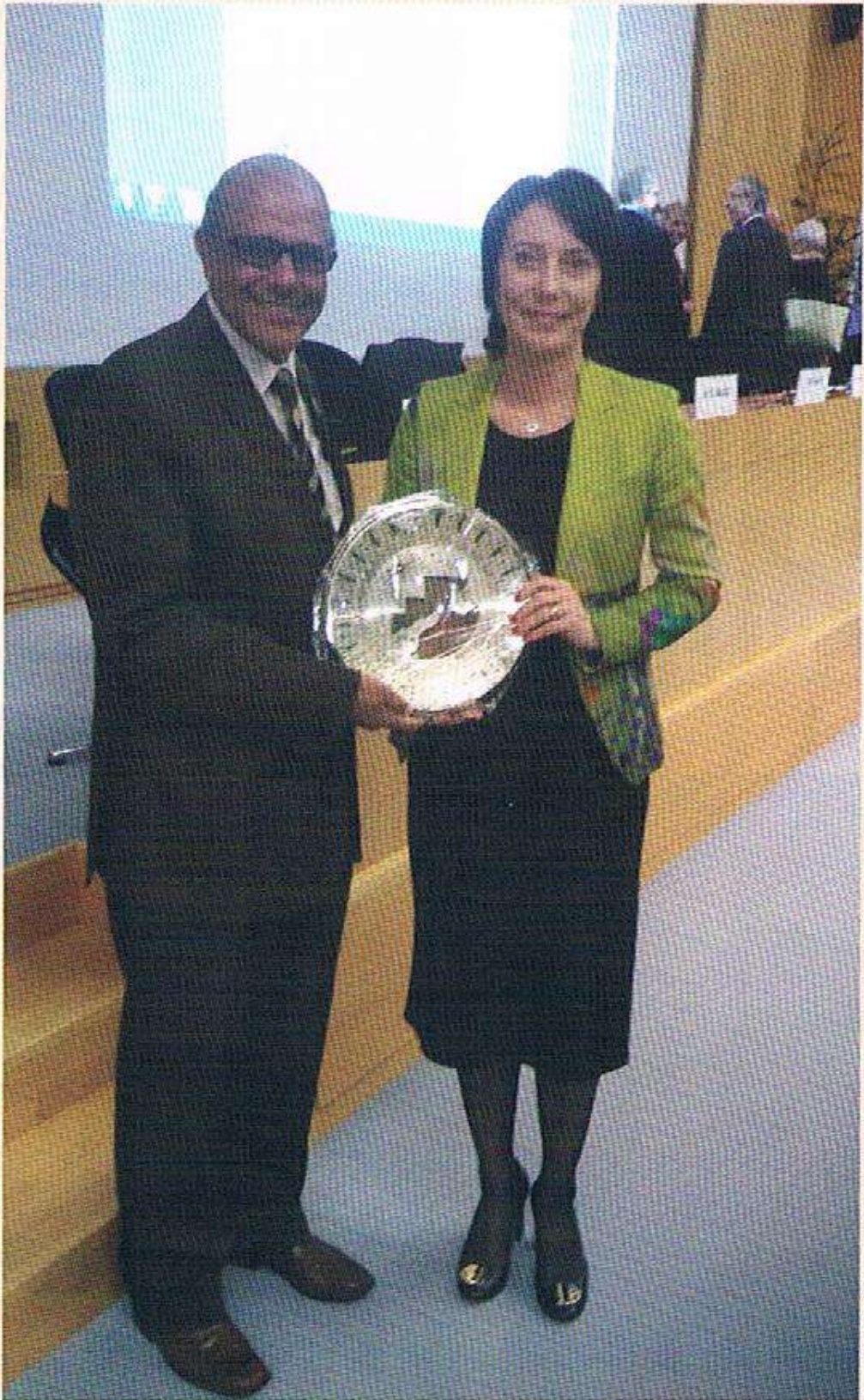
مع السيدة/ إيلينا مانكوففا - مساعد السكرتير العام للمنظمة العالمية للأرصاد الجوية