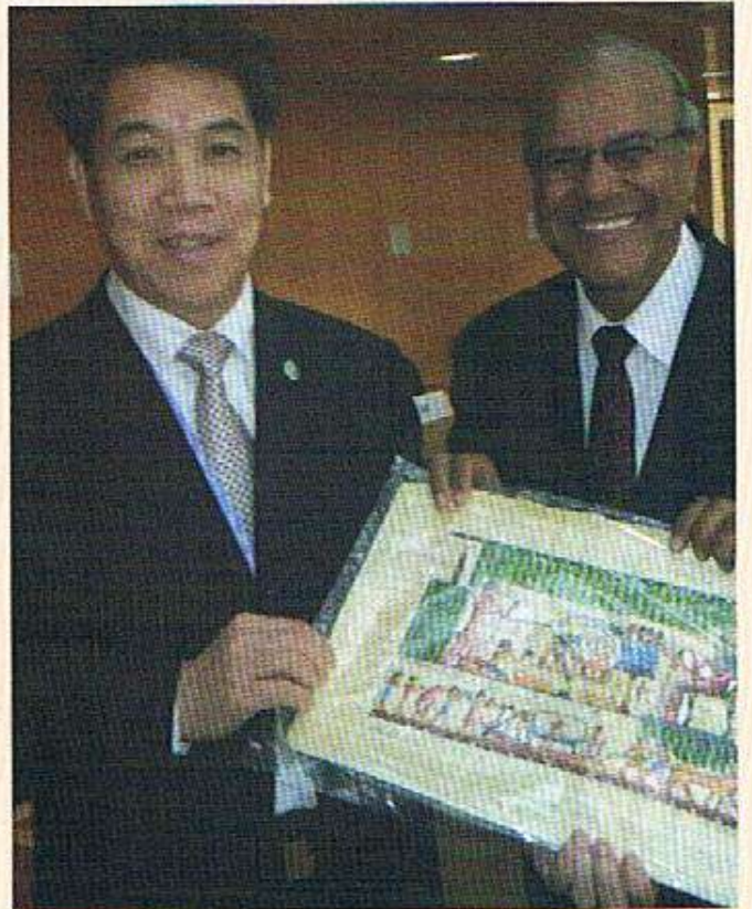
مع السيد جينك - رئيس هيئة الأرصاد الجوية الصينية