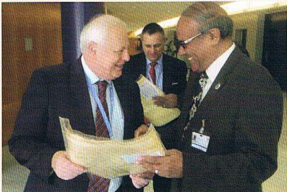
مع السيد رئيس الاتحاد الإقليمي الثالث - أوروبا