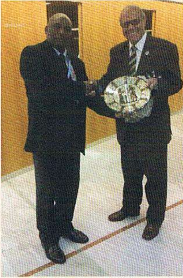
مع السيد أموس مكارال - رئيس الاتحاد الاقليمي الأول - إفريقيا