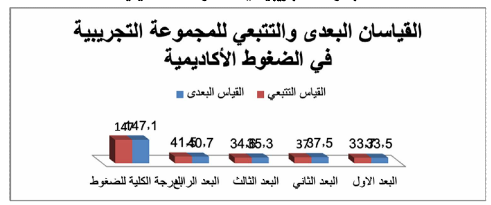
شكل (٦) المتوسطات الحسابية للقياسين البعدي والتتبعي للمجموعة التجريبية في الضغوط الأكاديمية

والشكل البياني التالي يوضح المتوسطات الحسابية للقياسين البعدي والتتبعي للمجموعة التجريبية في الضغوط الأكاديمية.