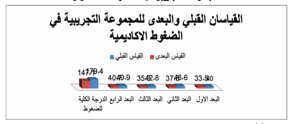
شكل (٢) المتوسطات الحسابية للقياسين القبلي والبعدي للمجموعة التجريبية في الضغوط الأكاديمية

والشكل البياني التالي يوضح المتوسطات الحسابية للقياسين القبلي والبعدي للمجموعة التجريبية في الضغوط الأكاديمية.