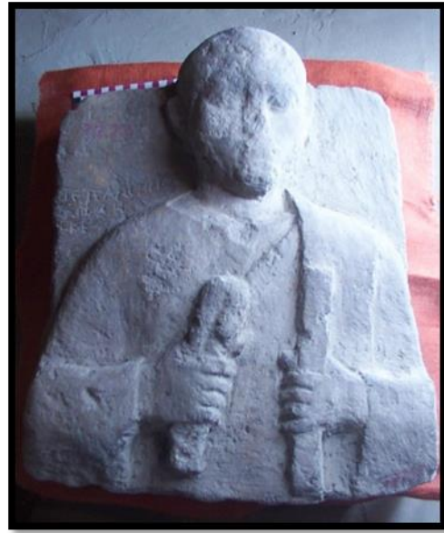
لوحة رقم 3 المتحف المصري سجل رقم CG.7272 Abdalla, Graeco Roman Funerary Stelae, Cat. 225.