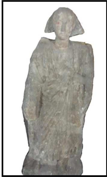
لوحة رقم 4 المتحف القبطي سجل رقم Nr. 13247 Gabr, Three Unpublished Sculpture, p.46.