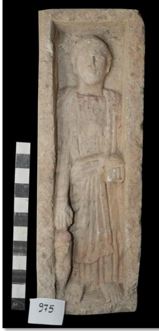
لوحة رقم 2 لوحة شاهدة لتمثال كامل محفوظة في المخزن المتحفى بالأشمونين سجل رقم 975