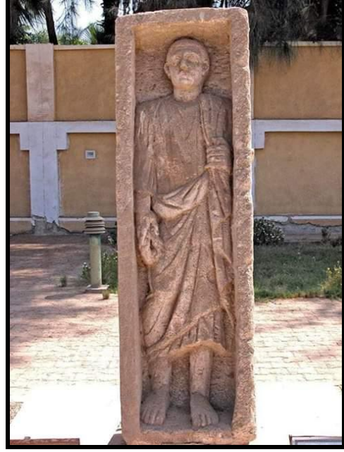
لوحة رقم 1 لوحة شاهدة لتمثال كامل محفوظة في المخزن المتحفى بالأشمونين سجل رقم 571