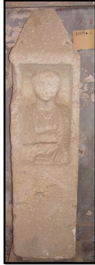
لوحة رقم 5 المتحف اليوناني الروماني سجل رقم 23375

Török, Notes on pre-Coptic and Coptic art, Vol. 29, p.137, fig. 9.