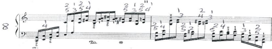
شكل رقم (٢) يوضح لحن الفكره B

نفس أسلوب الأداء في الفكره A مع انتقال لسلم ري / ص و مي / ص من م ٩ : م ١٢ ، ومن م ١٥ تحويل لسلم لابيمول / ك ثم صول / ك .