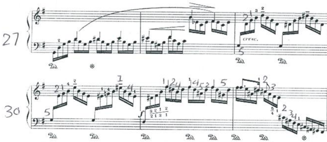
شكل رقم (٥) يوضح التركيبية الإيقاعية للفكرة B