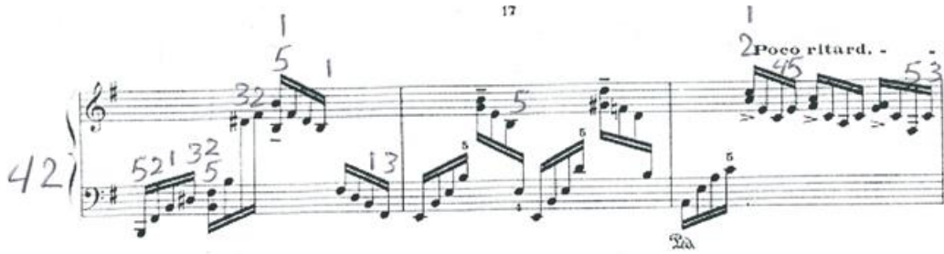
شكل رقم(٦) يوضح الفكرة A2