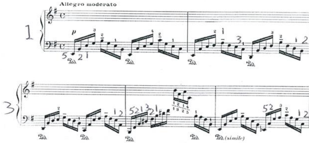
شكل رقم(٣) يوضح النماذج اللحنيه والايقاعيه للدراسه رقم ٤

يؤدى اللحن بأسلوب التالفات المفككه علي درجات سلم مي الصغير ثم الانتقال الي سلم صول الكبير .