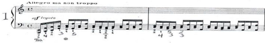
شكل رقم (١) يوضح بدايه الفكره A

تؤدي اليد اليسري نغمات مزدوجة علي مسافات متنوعة في سلم دو/ ك بشكل متصل Legato ، ويؤدي هذا الجزء أداء متوسط القوة mf .