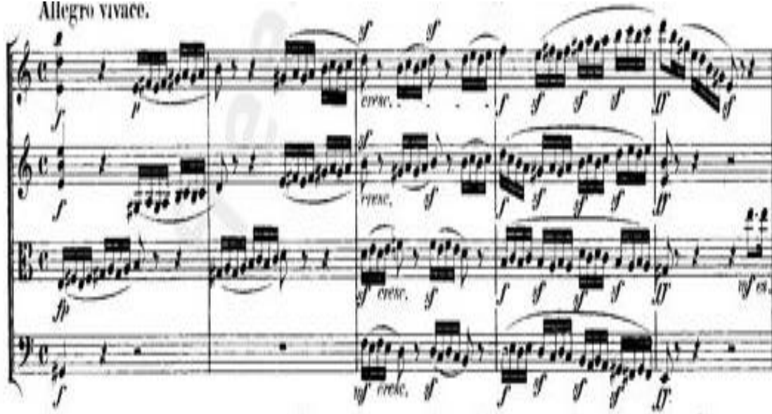
الشكل رقم (٢)

وترى الباحثة أن الحركة الأولى أعمدت بشكل كامل على القوس المتصل الليجاتو وهو قوس درامي استخدمه مندلسون للتقليل بين الحالات المزاجية الدرامية المختلفة ، وأعتمد عليه بشكل كامل في اغلب الجمل اللحنية للرباعي الوتري موضوع البحث ، كما هو موضح في المثال الآتي (الشكل رقم ٢) .