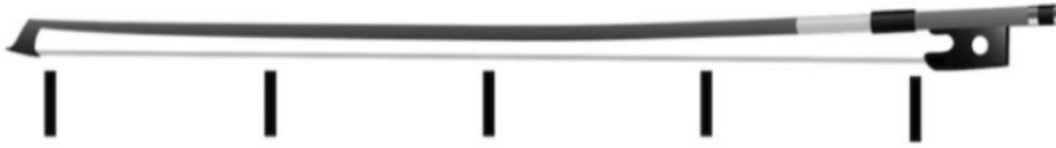
Example 2: From "Musette," Suzuki Book 2

ولعلاج هذه المشكلة لابد أن يتدرب الطالب على سحب القوس بسرعة ثابتة ، فمن الممكن أن يقسم القوس قسمة بصرية بالتساوي على النغمات الموجودة في الجملة اللحنية ، كما هو موضح بالشكل رقم (٣) .