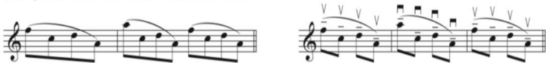
الشكل رقم (٣)