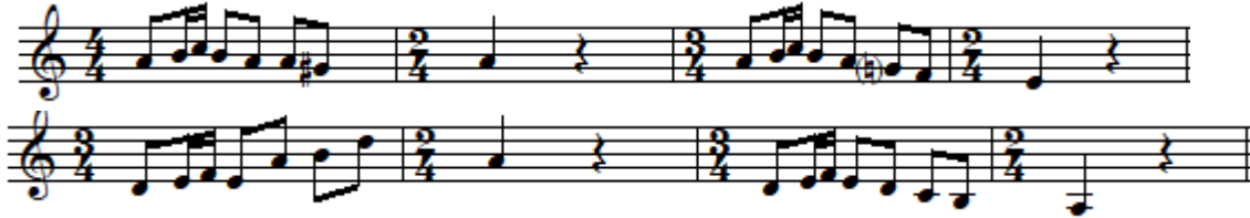
شكل رقم (٢)