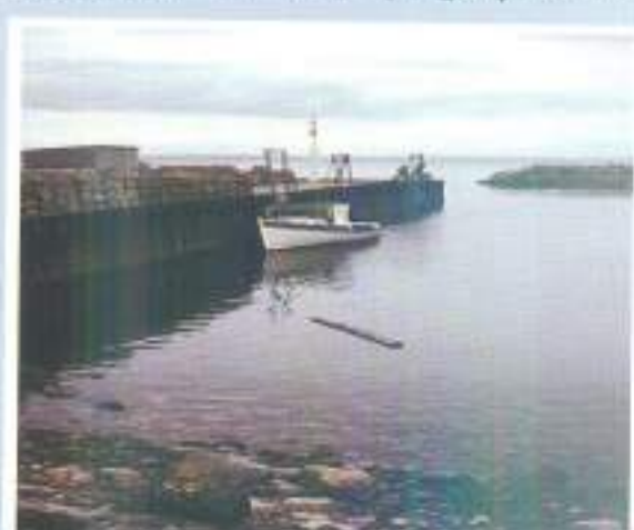
شكل (٢) المد