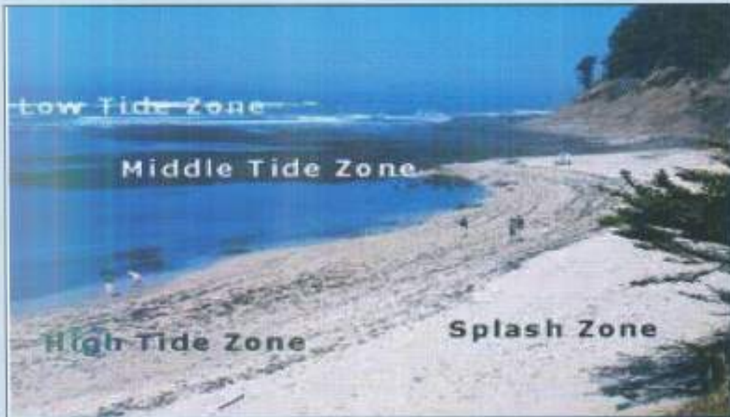
شكل (٥) يوضح اعلى واقل مد وجزر

في الأسبوعين الأول والثالث من كل شهر قمري يكون المد ضعيف بسبب وقوع كل من الشمس والقمر على ضلعي زاوية رأسها - مركز الأرض وبذلك تحاول جاذبية الشمس تعديل جاذبية القمر .