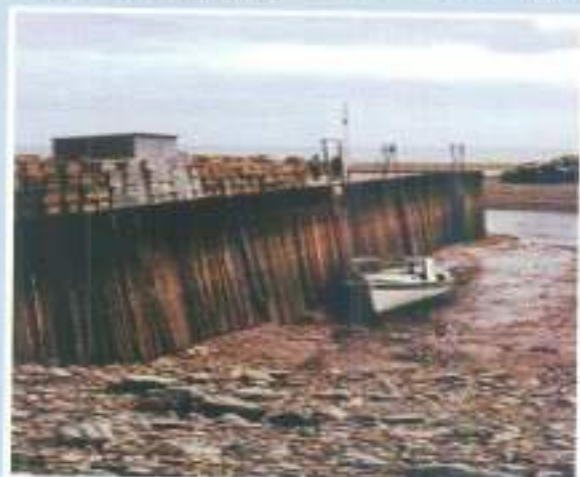
شكل (٤) الجزر

ظاهرتا المد والجزر عبارة عن موجات كبيرة يترقب عليها طغيان مياه البحر على مساحات من اليابس وتلاحظ خاصة عند الشواطئ المنبسطة ثم لا يلبث أن ينحصر عنها في فترات دورية متعاقبة وتعرف حركة طغيان الماء بالمد ويعرف انحصار الماء عن اليابس بالجزر.