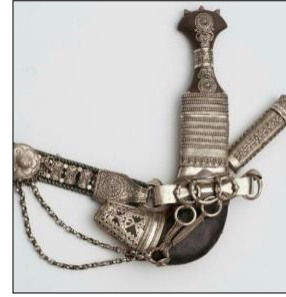
شكل رقم (1)

خنجر فضي يمتاز بزخارف هندسية وشرائط من التواشيح النباتية الاسلامية يظهر طريقة النقش بالقلع (الريوسية)، من ظفار ق(20م)، مكون من قرن وحيد القرن، والحديد، والفضة ( https://www.nm.gov.om/collection/gift/crafts-industries )