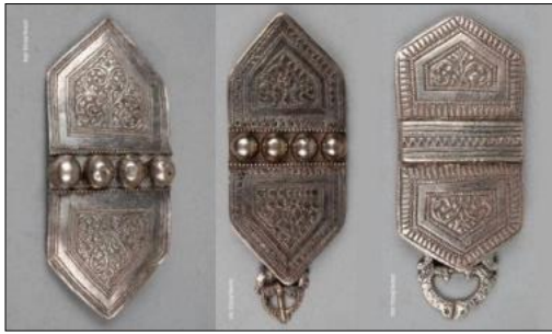
شكل رقم (12)

حزام الخنجر العماني تمتاز بالدقة والزخارف الهندسية، حيث صنع من الجلد وتم النقش عليه بخيوط من فضة ( http://www.khanjar.om/Parts_ar.html )