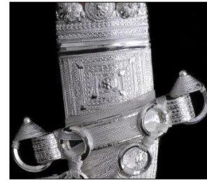
شكل رقم (9)

شكل النصل وهو جزء من الخنجر ويحتوي على زخارف نباتية وهندسية ، ويصنع غالبا من الفولاذ، ومعلق ملقاط رجالي بحلقة من حلقات الاربعة للخنجر ( https://nl.pinterest.com/pin/336855247130465707 )