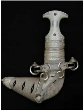
شكل رقم (6)

خنجر يمتاز بزخارف نباتية إسلامية يظهر طريقة النقش بالقلع، مكون من قرن وحيد القرن، والحديد، والفضة . ( https://www.pinterest.com/pin/336855247130465738 )