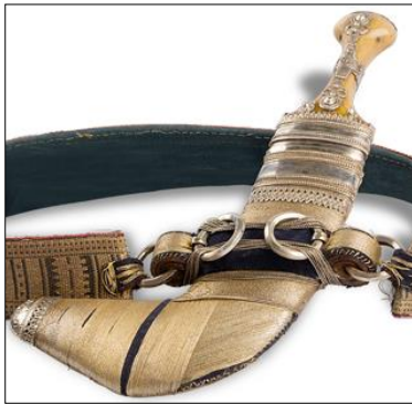
شكل رقم (5)

خنجر يظهر طريقة النقش بالقلع، مكون من قرن وحيد القرن، والحديد، وخشب، و جلد، والفضة ق(19م). ( https://www.nm.gov.om/collection/gift/crafts-industries )