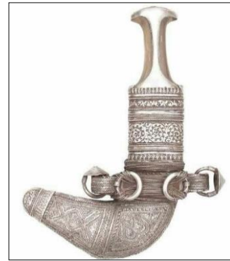
شكل رقم (2)

خنجر للسultan السيد حمود بن محمد البوسعيدي يمتاز بزخارف نباتية، يتكون من قرن، وفضه، وخيوط الذهب، وقماش، الفولاذ، ذات أربع حلقات من أواخر القرن(19م). ( https://www.nm.gov.om/collection/gift/crafts-industries )