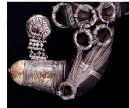
شكل رقم (10)

جزء تفصيلي لصدر الخنجر من الفضة يمتاز بالزخارف الدقيقة الهندسية وتمتاز بالحز البارز والغائر، ويكون بها معظم الحلقات التي تعمل على ربط أجزاء الخنجر بعضها ببعض