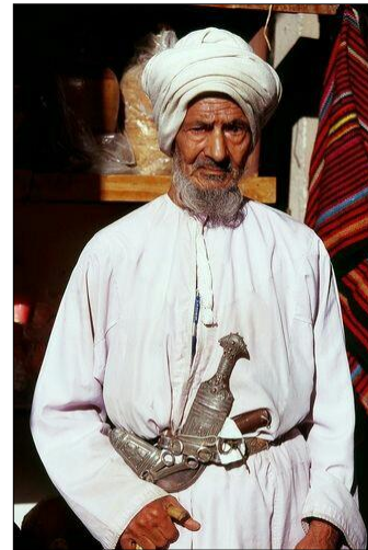
شكل رقم (3)

خنجر فضي يمتاز بزخارف هندسية يظهر طريقة النقش التكاسير، مكون من قرن وحيد القرن، والحديد، والفضة مستخدما الحني، و الصنفرة، والتصفيح، والوصل بالحلقات، وأسلاك الفضة، ولحام الفضة.