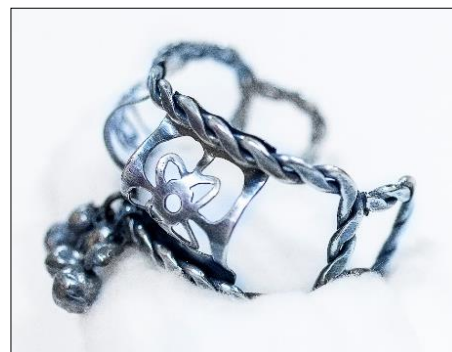
(أ)، (ب) شكل(16)