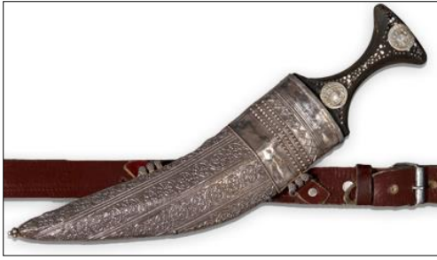
شكل رقم (4)

خنجر فضي يمتاز بزخارف هندسية وشرائط من التواشيح النباتية الاسلامية يظهر طريقة النقش بالقلع (الريوسية)، من ظفار ق(20م)، مكون من قرن وحيد القرن، والحديد، والفضة ( https://www.nm.gov.om/collection/gift/crafts-industries )