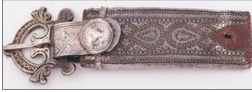
شكل رقم (11)

حزام الخنجر العماني تمتاز بالدقة والزخارف الهندسية، حيث صنع من الجلد وتم النقش عليه بخيوط من فضة ( http://www.khanjar.om/Parts_ar.html )