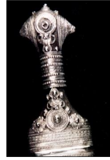
شكل رقم (7)

أجزاء الخنجر ( http://www.khanjar.om/Parts_ar.html )