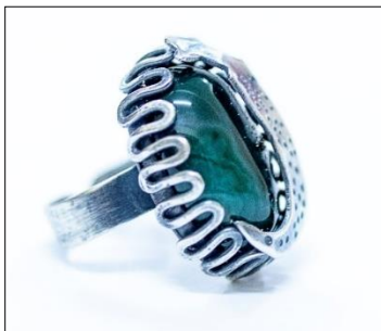
(أ)، (ب) شكل(15)